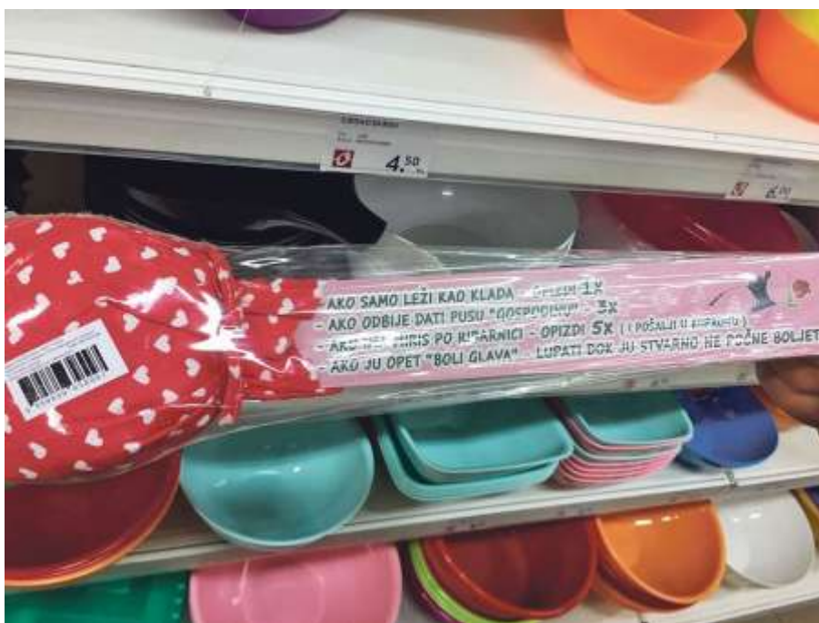
Slika 5.

Govor mržnje pripada u vrstu nasilja, a da humor ne smije biti maska za relativizaciju već spomenutog nasilja potvrđuje primjer s početka 2018. godine, takozvani „Slučaj opizdilica“. U siječnju ove godine medijsku je prašinu podignuo predmet „Opizdilica za seksualni odgoj žena“ koji se mogao kupiti u jednom trgovačkom lancu u Hrvatskoj i Njemačkoj, a proizvodi ga domaća tvrtka. Radi se o drvenom štapu s mekanim vrhom i s jasno napisanim uputama kako kazniti neposlušnu ženu koja odbija spolne odnose s muškarcem. Na Slici 5. prikazan je navedeni proizvod s tekstom.