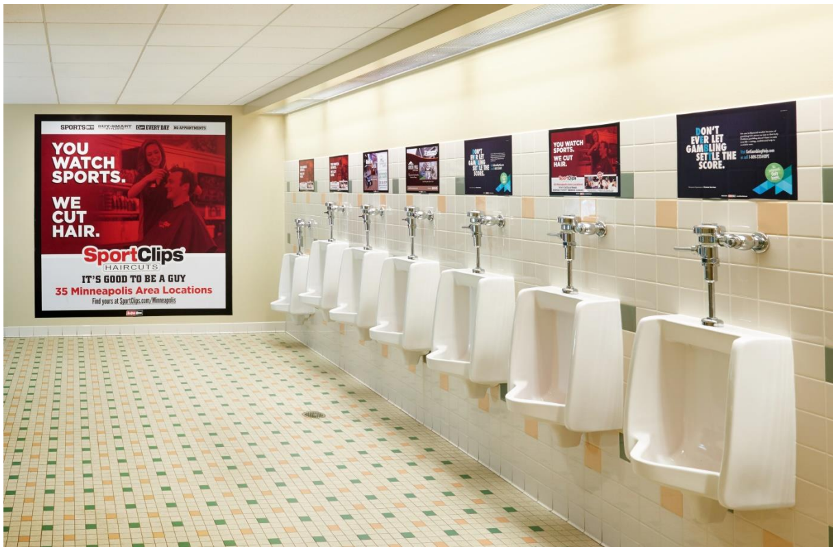
Slika 1 – primjer indoor oglašavanja u sanitarnom prostoru