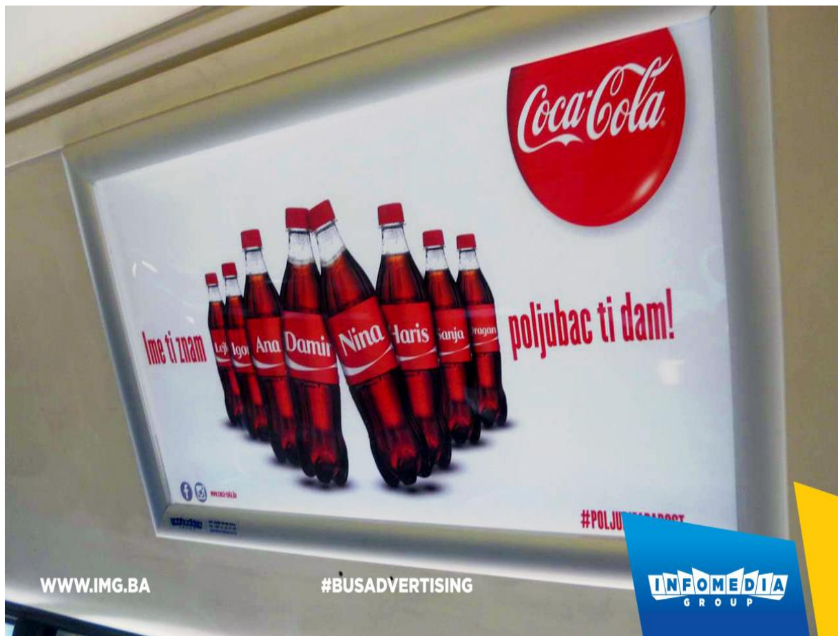
Slika 3 – indoor oglašavanje brenda Coca-Cola