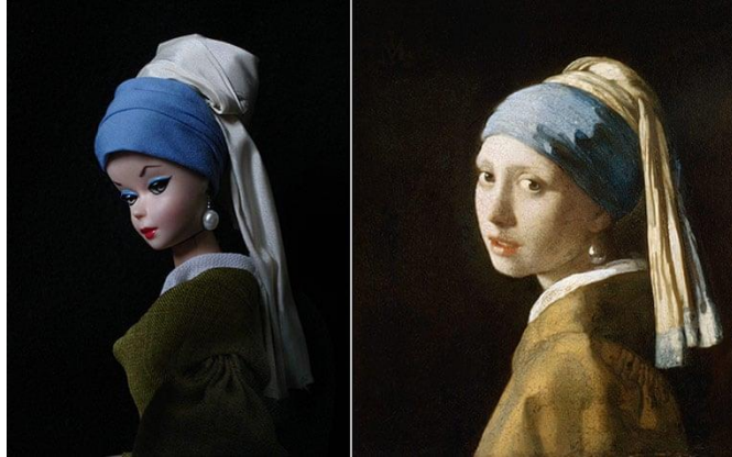
Slika 6, -Joselyn Grivaud-Vermeer's Girl with a Pearl Earring, izvor

https://www.theguardian.com/artanddesign/gallery/2012/jan/29/fine-art-posed-by-barbies