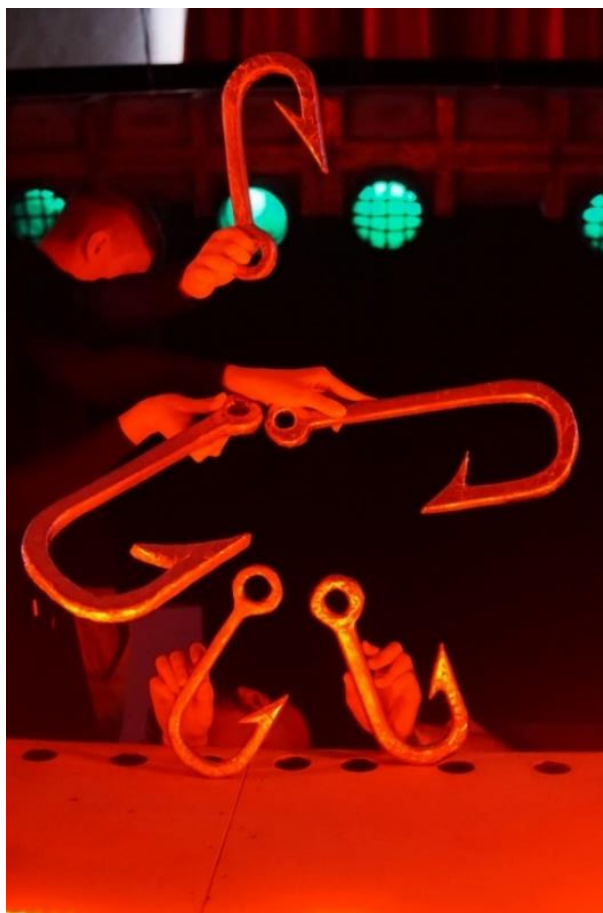
Slika 11. Čudovište složeno od udica.

Osim lutaka, svjetla i pomoćne animacije u predstavi Na tragu animirala sam i predmete. Proučavala sam kako bi se sendvič, konzerva, koktel od algi ili plastična vrećica kretale pod vodom. Također, u drugoj sceni animirane su velike kaširane udice. Lik glumca Gorana Grgeča bori se protiv udica tijekom snimanja akcijskog filma. Scena filma osmišljena je kao koreografija u kojoj se riba grgeč provlači između plivajućih udica i bježi od njih dok ga udice love. Naposljetku, budući da ga nisu uspjele uloviti, udice se dogovore da će se pretvoriti u „čudovište“. Animatori kroz koreografiju na sceni slažu „čudovište“ spajanjem udica u oblik čovjeka. Na Slici 11. nalazi se prikaz tako animiranog „čudovišta“. Udica koju animira Petra Cicvarić postaje glava, dvije udice postaju noge te ih animira Vanja Gvozdić, a dvije udice postaju ruke koje ja animiram. Čudovište hoda pokušavajući rukama upecati Grgeča, no on ih uspijeva pobijediti.