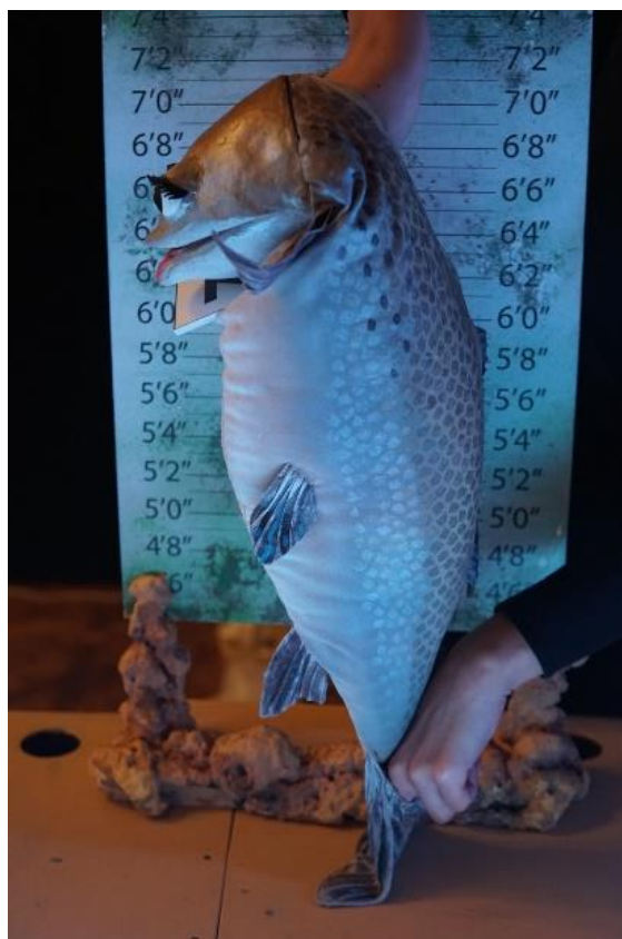
Slika 4. Položaji animatorovih ruku u odnosu na lutku koja stoji.