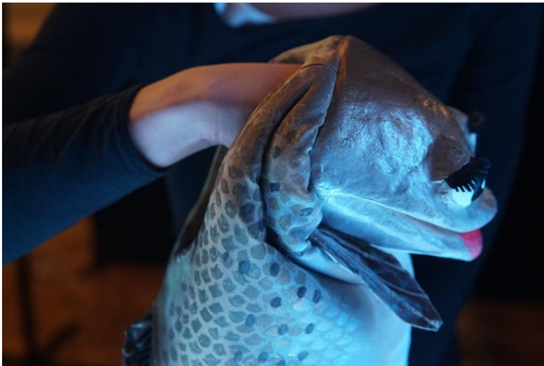
Slika 2. Položaj animatorove ruke u lutkinjoj glavi.