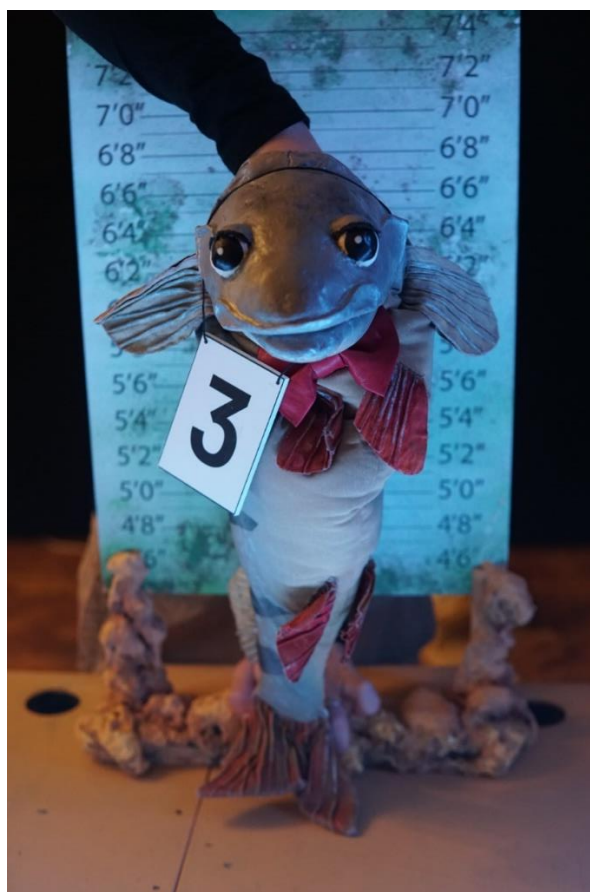
Slika 5. Goran Grgeč - riba grgeč.

„nametnut“, te na taj način ona postaje posrednik između djeteta i okoline. 15 S druge strane, lutke, iako karakterno naglašenih atributa, vrlo realistično prikazuju vrste riba koje uprizoruju te publika lako može povezati lik iz predstave sa stvarnom ribom koju može vidjeti u akvarijima Aquatike. Primjera radi, slika 5. prikazuje lutku Gorana Grgeča, odnosno ribu grgeč. Ovdje treba dodati kako su dramski glumci su kroz povijest odgovarali za ono što se na sceni govori umjesto autora. Stoga je upravo lutka govorila sve ono što dramski glumac nije smio, bila je šticeana anonimnošću paravana. 16 Lutke su, dakle, kroz povijest bile borci za humaniji ljudski život. Na isti način lutke predstave Na tragu postaju borci za humaniji životinjski, ali i ljudski život. Konačno, tehniku zijevalica odabrao je redatelj Peđa Gvozdić u dogovoru s lutkarskim tehnologom Mladenom Bolfekom, a sve zbog velike količine govorenog teksta koje likovi imaju.