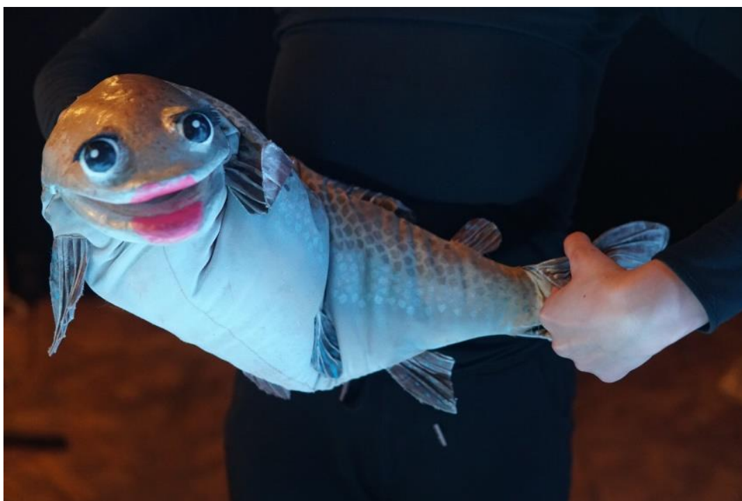
Slika 3. Položaji animatorovih ruku u odnosu na lutku koja pliva.