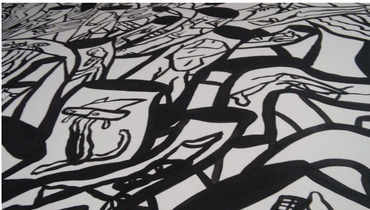
Prilog 12: Detalj oslikanog zida