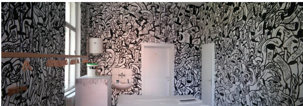
Prilog 5: Prikaz dijela oslikane prostorije