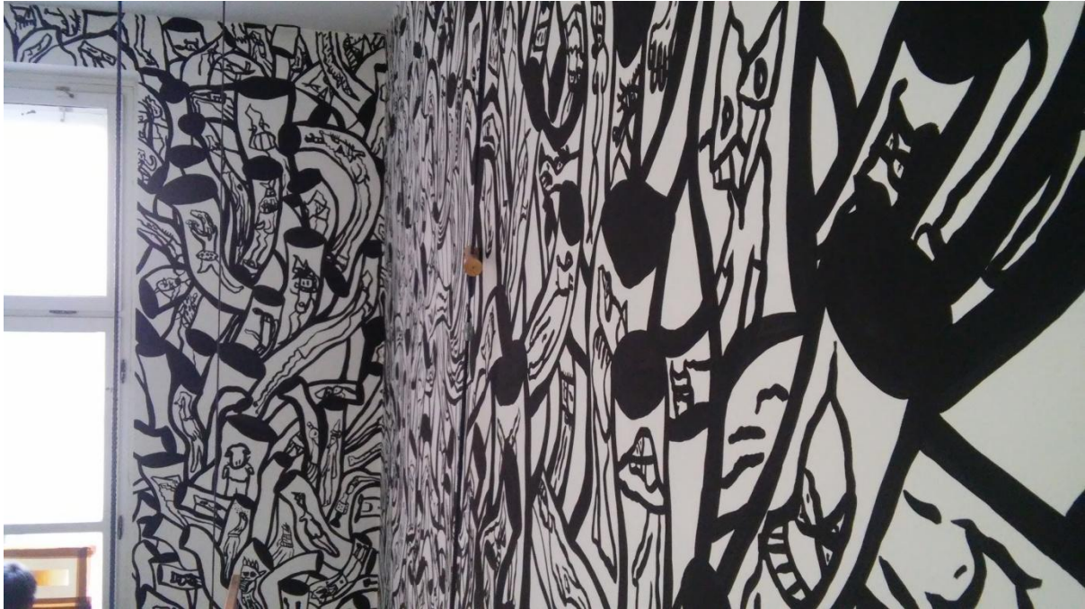
Prilog 10: Detalji oslikanih zidova