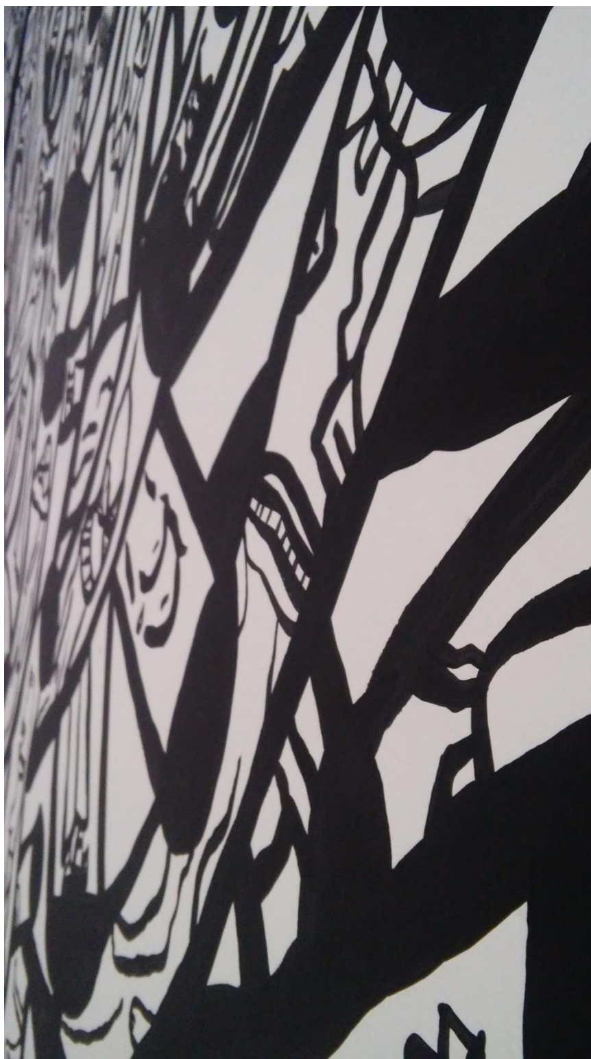
Prilog 9: Detalj jednog oslikanog zida