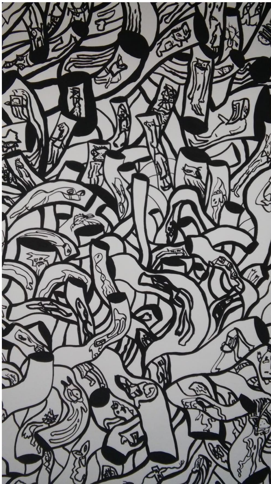
Prilog 6: Detalj jednog od oslikanih zidova