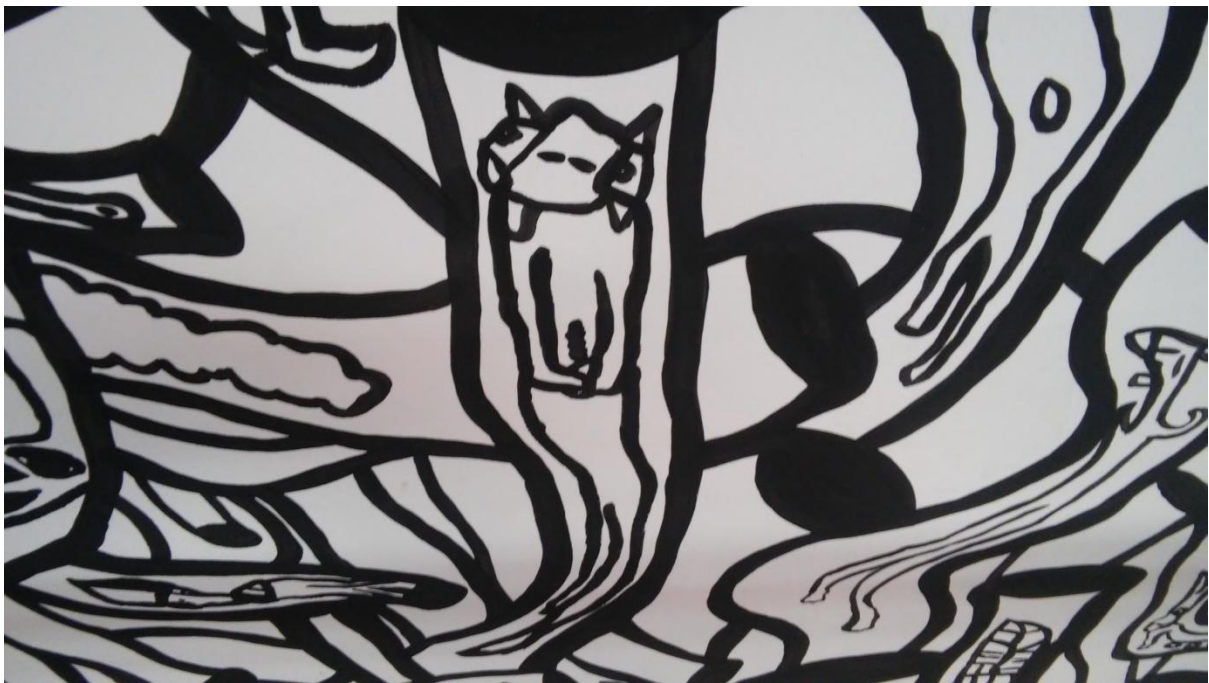
Prilog 11: Detalj jednog od oslikanih zidova – imaginacijski zoomorfni lik