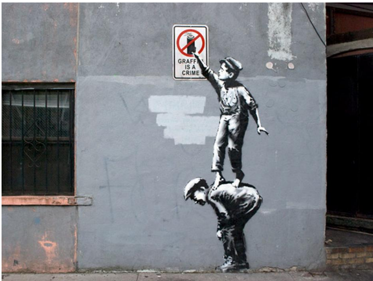
Prilog 3: Banksy - Graffiti is a crime - boys stencil poster