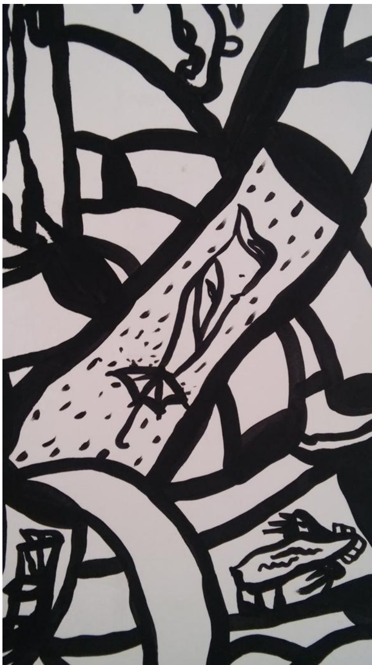
Prilog 4: Detalj oslikana zida, lik koji ima tijelo kišobrana