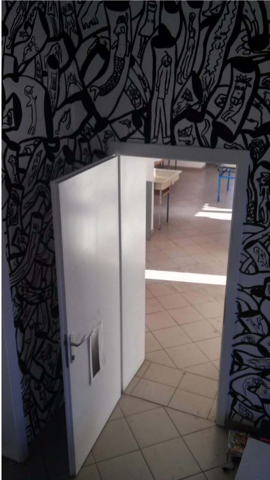
Prilog 14: Detalji oslikanih zidova