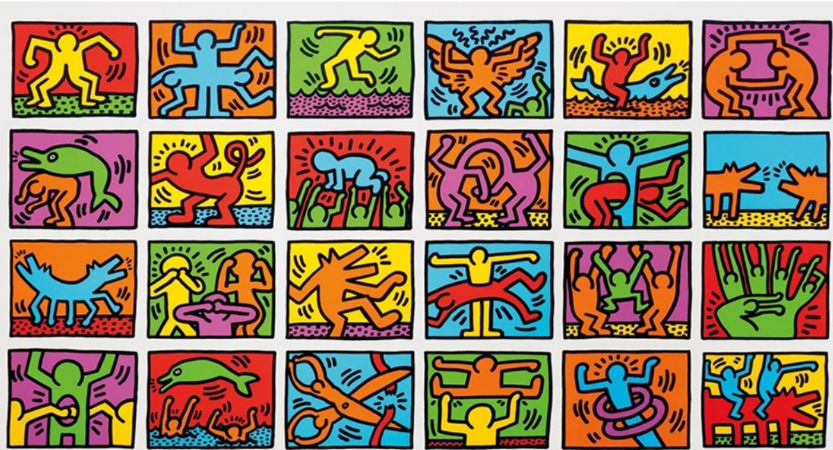
Prilog 1: Keith Haring - The World Is Beautiful