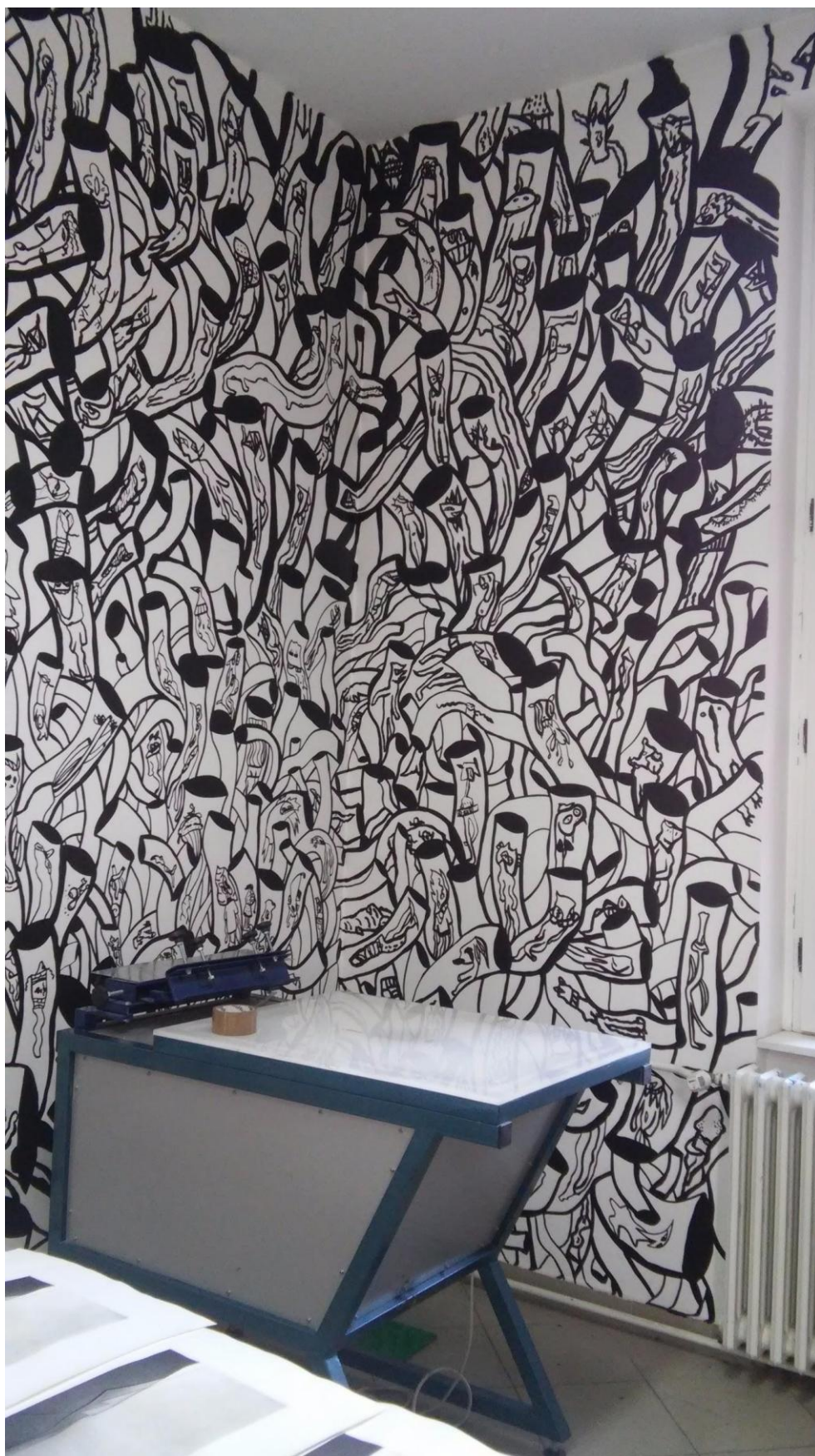
Prilog 15: Detalji oslikanih zidova