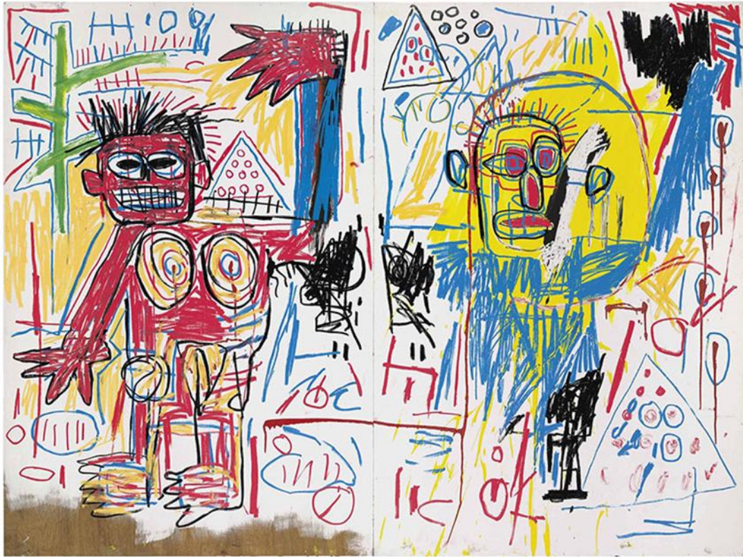
Prilog 2: Jean Michel Basquiat - Untitled (Diptych)