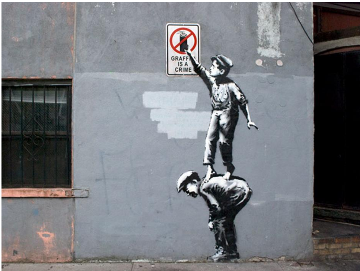
Prilog 3: Banksy - Graffiti is a crime - boys stencil poster