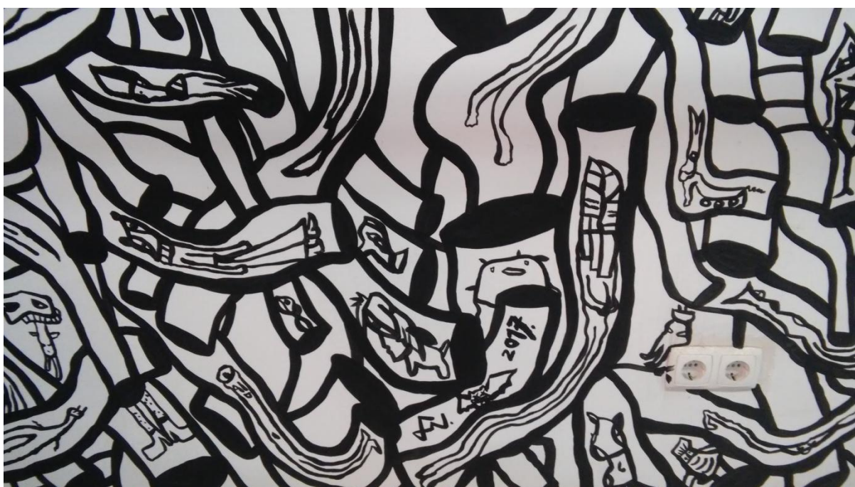
Prilog 13: Detalj oslikanog zida – zoomorfni i antropomorfni likovi