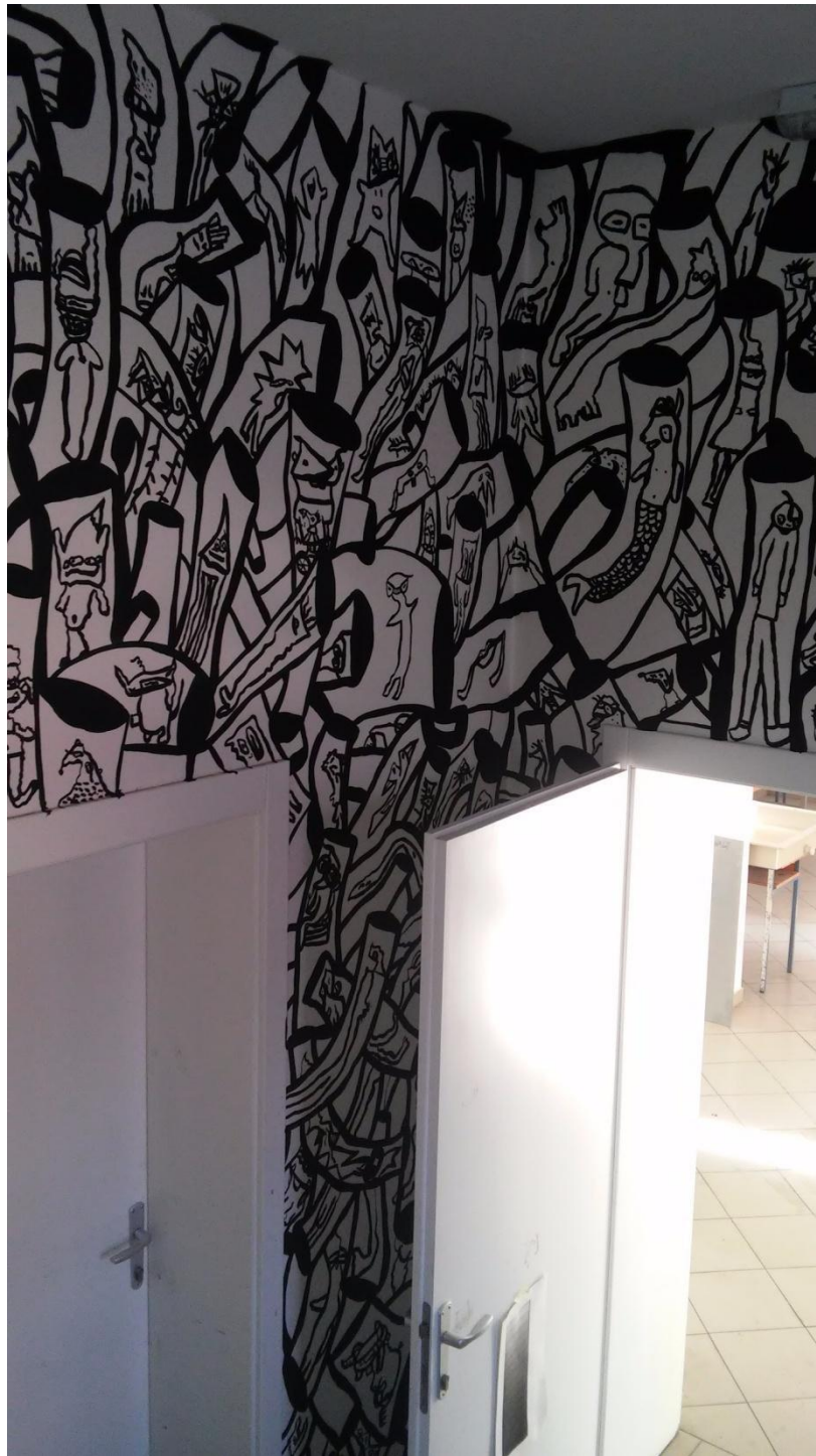
Prilog 7: Detalji oslikanih zidova