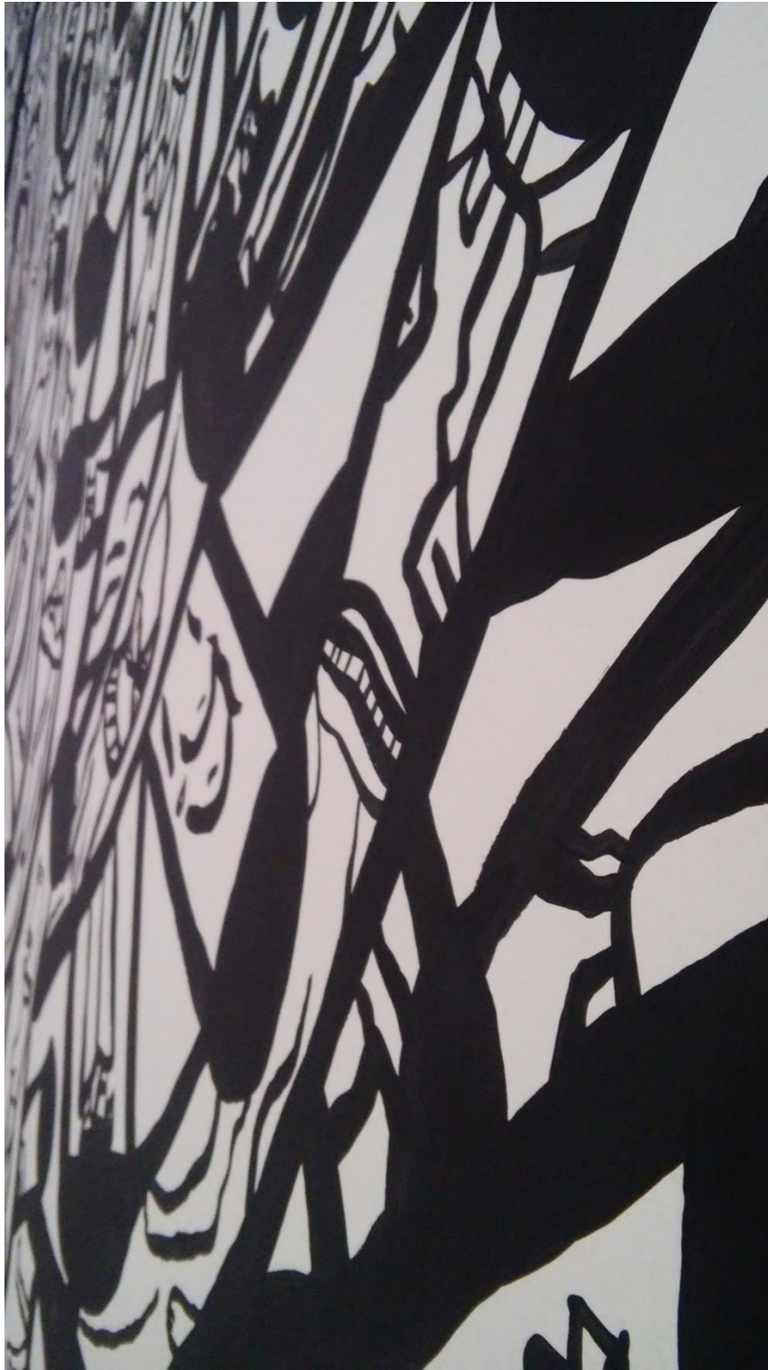
Prilog 9: Detalj jednog oslikanog zida