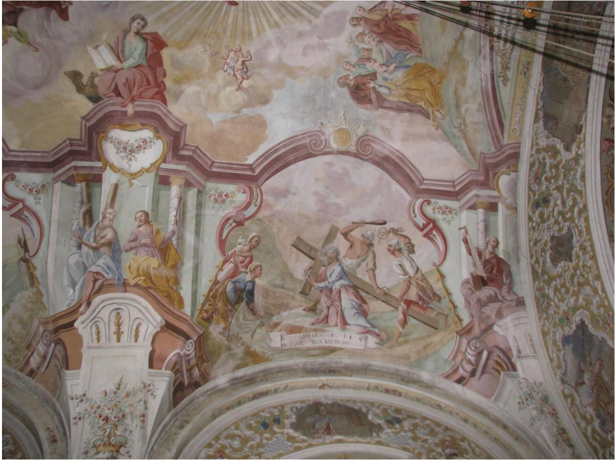
Prilog 13. Isus nosi križ