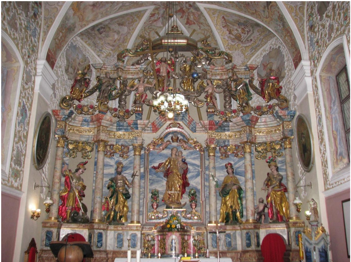
Prilog 18. Pogled na oltar