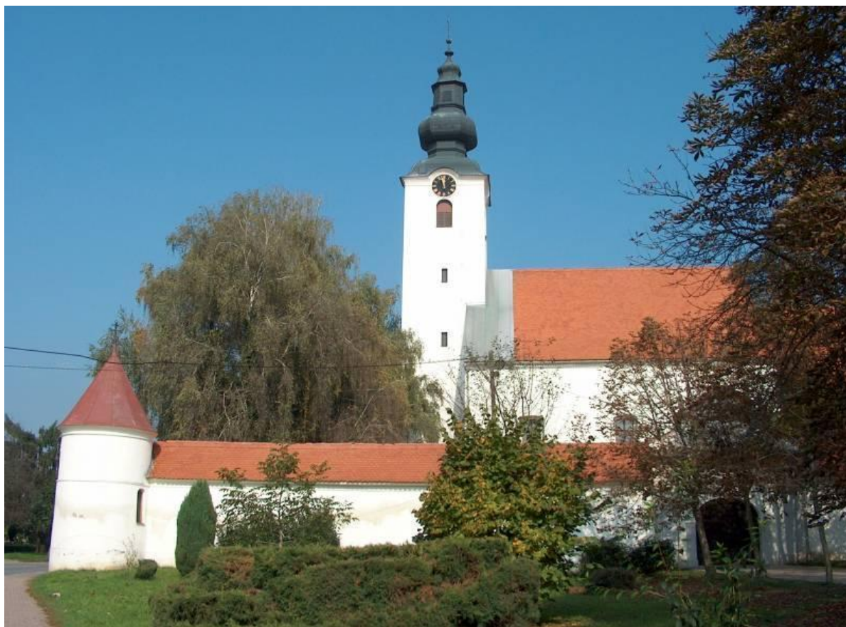
Prilog 2. Pogled na eksterijer crkve. Preuzeto iz: http://www.kutinaplaces.com/lokacije/posjetite/crkva-sv-marije-snezne (datum pristupanja internetskoj stranici - 21. 8. 2017.)