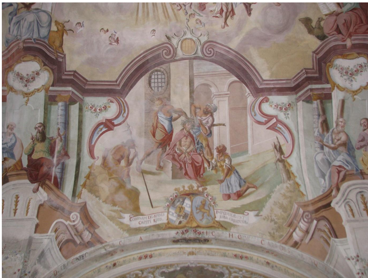
Prilog 12. Krunjenje Isusa trnovom krunom