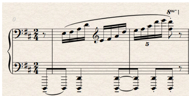
Slika 18. Taktovi 38 i 39

Tehničke mogućnosti klavira i tambura uvelike se razlikuju. Zbog same građe instrumenata, neke stvari koju su moguće na klaviru nisu moguće na tamburi.