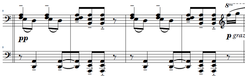
Slika 10. Taktovi 2-5 (original)

Pri obrađivanju uvijek treba uzeti u obzir da je autor djela pisao za instrumente drugačijega tipa koji imaju drugačiji sustav i zvučni spektar te bi, u cilju zadržavanja izvornosti zvuka, trebalo pronaći način kako što vjernije „imitirati“ original. U nastavku su prikazani usporedni primjeri istog postupka kroz ostatak djela.