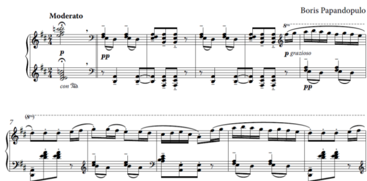
Slika 4. Taktovi 1-11

Skladatelj sličnost s temom s varijacijama ponekad postiže tako da temi doda pokoji ornament ili promijeni harmonijsku strukturu desne ruke (koja vrlo često paralelno prati samu melodiju), čime zapravo dobije varijaciju.