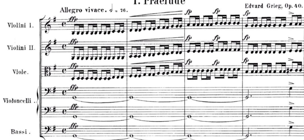
Slika 22. E. Grieg: Holberg suita (gudači) – taktovi 1-4

Naveden je primjer gdje se sam autor poslužio ovakvim rješenjem prilikom obrade. Postupak kojem obrađivači u ovakvim slučajevima pribjegavaju je sljedeći: rastavljeni akord pretvaraju u običan suzvučni akord, a tonove, ovisno o registru, podijele po dionicama.