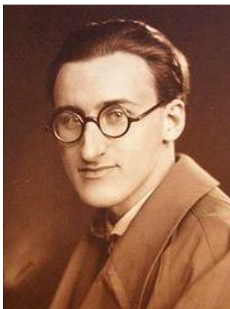
Slika 1. Boris Papandopulo u mlađim danima

Boris Papandopulo (Bad Honnef, Njemačka, 25. II. 1906 – Zagreb, 16. X. 1991) bio je hrvatski dirigent i jedan od najvećih hrvatskih skladatelja. Potekao je iz ugledne obitelji Strozzi koja je njegovala kazališnu i glazbenu umjetnost. Majka Marija Strozzi-Pečić također je bila glazbenica, bila je cijenjena sopranistica, a otac, Konstantin Papandopulos Rus je plemenitaške pozadine. Papandopulo je diplomirao kompoziciju i dirigiranje. Kompoziciju je studirao na Muzičkoj akademiji u Zagrebu, u klasi Blagoja Berse, a dirigiranje u Beču na Novom konzervatoriju u klasi Dirka Focka. (Hrvatska enciklopedija; mrežno izdanje: Boris Papandopulo)