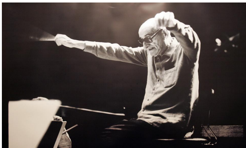
Slika 2. Boris Papandopulo kao dirigent

Tijekom svoje karijere, Boris Papandopulo ravnao je mnogim orkestrima i zborovima te je bio zaposlen u mnogim kazališnim i koncertnim kućama. Bio je zborovođa pjevačkoga društva Kolo (1928.–34.) i dirigent Društvenog orkestra Hrvatskoga glazbenog zavoda u Zagrebu (1931.–34.), zborovođa pjevačkoga društva Zvonimir u Splitu (1935.–38.), potom u Zagrebu zborovođa Kola (1938.–46.), dirigent (1940.–45.) i ravnatelj Opere (1943.–45.) te dirigent Simfonijskog orkestra Hrvatskoga krugovala (1942.–45.). Nakon II. svjetskog rata dirigirao je Operom u Rijeci (i bio njezin direktor 1946.–48., 1953.–59.), potom Operom u Sarajevu (1948.–53.), Zagrebu (1959.–65.) i Splitu (1968.–74.). Istodobno je bio gost-dirigent u kazalištu Komedija u Zagrebu te Opere u Kairu. Neko je vrijeme djelovao i kao glazbeni pisac i kritičar (1931.–38.). Godine 1965. imenovan je redovitim članom JAZU. (Hrvatska enciklopedija; mrežno izdanje: Boris Papandopulo)