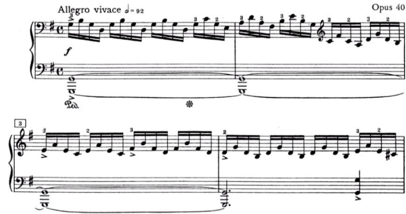
Slika 21. E. Grieg: Holberg suita (klavir) – taktovi 1-4