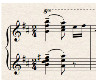
Slika 16. Takt 17 - dva akorda povezana lukom

Prethodni primjeri pokazali su odluku da se kroz većinu djela izbjegava tremolo tehnika zbog zvučnog aspekta. Takav način obrade neizbježno dovodi do narušavanja „integriteta“ sviranja tambure. Uz činjenicu da treba što vjernije prikazati originalnu artikulaciju, treba pripaziti na to da obrada zvuči što prirodnije u izvedbi sastava za koji je napisana. Stoga, na pojedinim mjestima koja to omogućavaju, artikulaciju treba prilagoditi prirodi tambura.