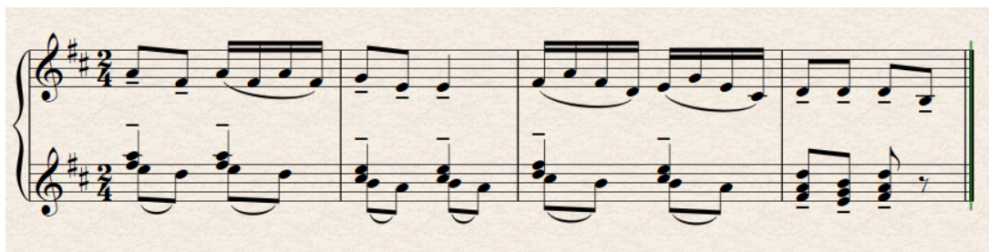
Slika 12. Taktovi 26-29 (original)