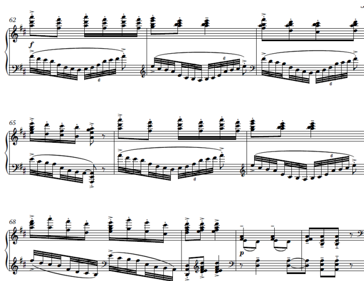
Slika 5. Taktovi 62-71