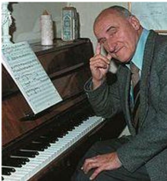
Slika 3. Boris Papandopulo za klavirom

Skladateljski opus Borisa Papandopula zasigurno je dio njegove karijere po kojem je on danas najprepoznatljiviji. Kroz svoj rad napisao je preko 400 različitih djela raznih upotreba i za razne sastave. Pisao je orkestralnu, koncertantnu, komornu glazbu, solističke skladbe, glazbeno-scenska djela, filmsku glazbu, kantate, sakralnu glazbu te glazbu za glas ili zbor. Uz vrhunski skladateljski zanat koji je izučio te nepresušnu maštu i talent koji je imao, ne čudi što je, najvjerojatnije, on najplodniji hrvatski skladatelj u povijesti. (Hrvatski biografski leksikon; mrežno izdanje: Boris Papandopulo)