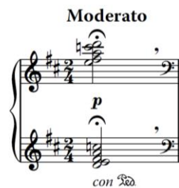
Slika 8. Početak djela

Contradanza za klavir počinje akordom koji je pod oznakom corone .