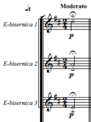
Slika 9. Prikaz označavanja portato tehnike

Nameće se pitanje kako artikulacijski tretirati ovo mjesto. Ovdje moramo govoriti o akustičkom aspektu. Kada klavirist odsvira ovaj akord, on ima određeno trajanje, zatim se zvuk krene gasiti dok u potpunosti nestane. Ako tamburama napišemo da sviraju tremolo , rezultat će biti drugačiji tako što će akord biti repetiran, a ne izveden iz jednog udarca (kao što je slučaj na klaviru). Moguće je interpretativno ispoštovati ponašanje zvuka, međutim, razlika će biti velika. Stoga, ovdje treba posegnuti za portato (tal.: nošeno) tehnikom. Naziv je preuzet iz gudačke nomenklature te se koristi i ista oznaka.