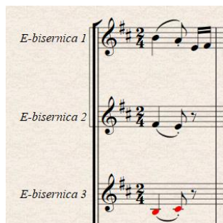
Slika 17. Takt 17 – note povezane punim lukom (označava frazu, no i sviranje tremolo tehnikom)

Slična situacija javlja se i na samom kraju skladbu. Početak i kraj skladbe zapravo su identični pa bi logično rješenje bilo napraviti isto rješenje, tj. napisati portato dinamiku i time dobiti isti zvuk. Međutim, upravo zbog razloga navedenoga u prethodnom paragrafu, ovaj put korišteno je drugačije rješenje. S obzirom na to da su akordi isti, artikulacijom je napravljena zvučna distinkcija. Ovaj postupak otvara i potencijalno interpretativno rješenje i poigravanje dinamikom. Zahvaljujući tremolo tehnici, ton može trajati duže pa pruža mogućnost dinamičkog rješenja crescenda pa decrescenda kako bi skladba imala intenzivniji završetak. Ova intervencija u odnosu na originalnu partituru daje dirigentu širok raspon interpretacije.