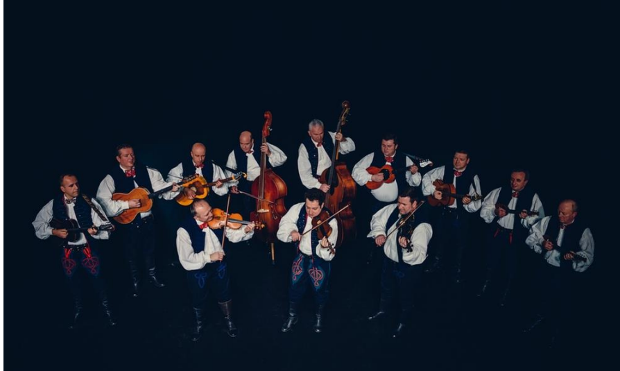
Slika 7. Tamburaški orkestar ansambla Lado

Uza sve do sada spomenuto valja napomenuti i posebno mjesto dati profesionalnom Tamburaškom orkestru Radiostanice Zagreb utemeljenom 1941. godine, koji kasnije prelazi na višu razinu te postaje Tamburaški orkestar Hrvatske radio televizije . Uz njega, profesionalni tamburaški orkestar ima i Ansambl Lado, nacionalni je folklorni ansambl osnovan 1949., sa zadaćom i ciljem da istražuje, prikuplja, umjetnički obrađuje i scenski prikazuje najljepše primjere bogate hrvatske glazbene i plesne djelatnosti. 11. studenoga 1949. ukazom Vlade NR Hrvatske, osnovan je Državni zbor narodnih plesova i pjesama (DZNPiP) . Od prvoga dana „LADO“ djeluje u istoj zgradi na Trgu maršala Tita (danas Trg Republike Hrvatske), poznatoj pod nazivom „Hrvatski dom“, zgradi čiji su vlasnici bila dva društva: „Hrvatski Sokol“ i Hrvatsko pjevačko društvo „Kolo“ koja su u njoj godinama djelovala. Danas je u njoj smještena i Akademija dramske umjetnosti te dvorana za pokuse baleta HNK. I upravo je ta zgrada za vrijeme agresije na Hrvatsku bila metom raketnih napada u svibnju 1995. kada su ranjeni članovi Baleta. Naziv ansambla "Državni zbor narodnih plesova i pjesma" promijenjen je 7. lipnja 1979. godine u „LADO profesionalni folklorni ansambl Hrvatske“, a dana 1. srpnja 1980. godine u današnji „Ansambl narodnih plesova i pjesama Hrvatske LADO“. 1