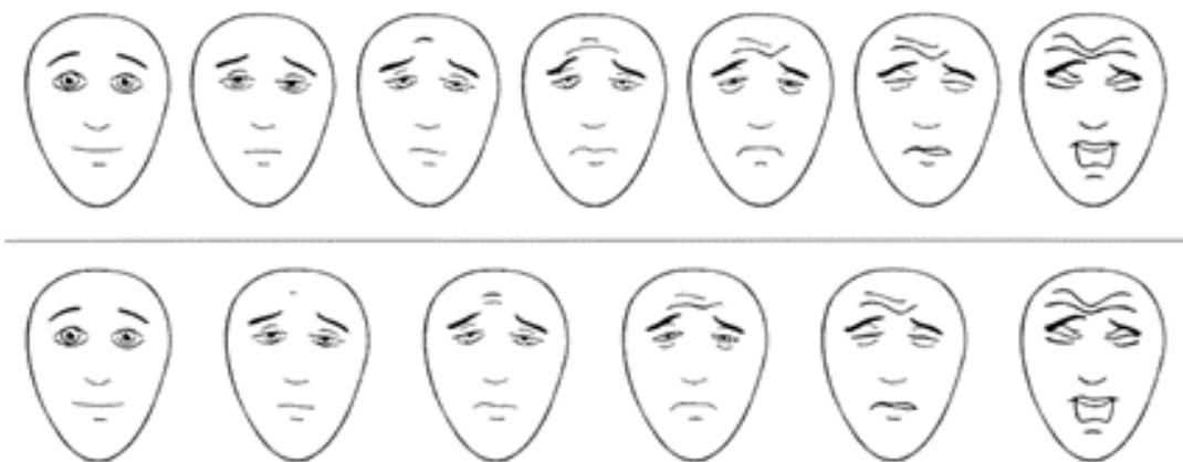
Slika br. 2: (FPS) The Faces Pain Scale (Bieri i sur., 1990) ili Ljestvici boli lica , [Online] Available from: https://images.app.goo.gl/hosvniJAemp79qN76