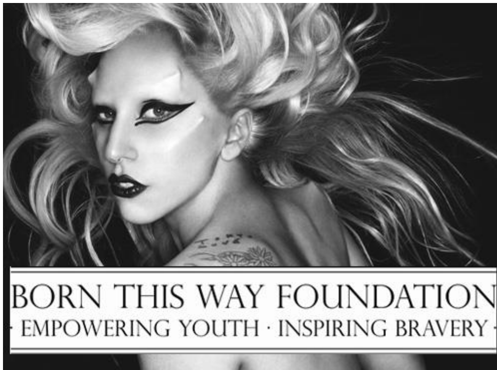
Slika 10. Selfi Lady Gage sa naglašenim elementima narcizma