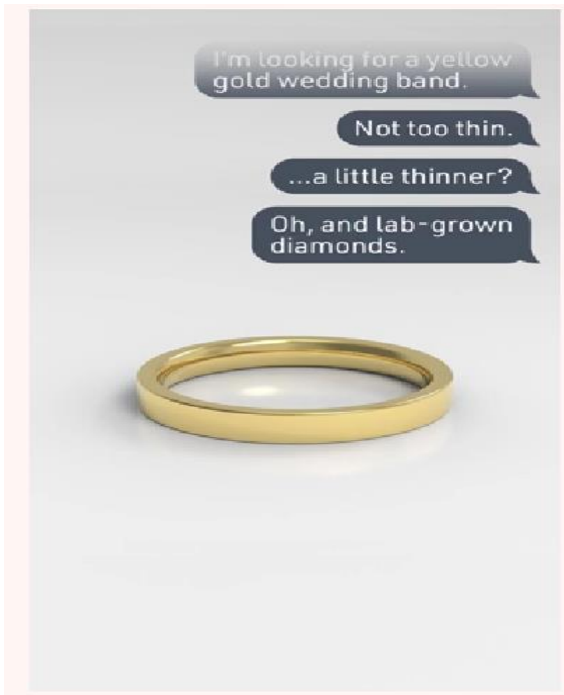
Slika 4. Narcisoidni zahtjevi kupaca poduzeća Holden rings u ponudi specijaliziranog prstenja