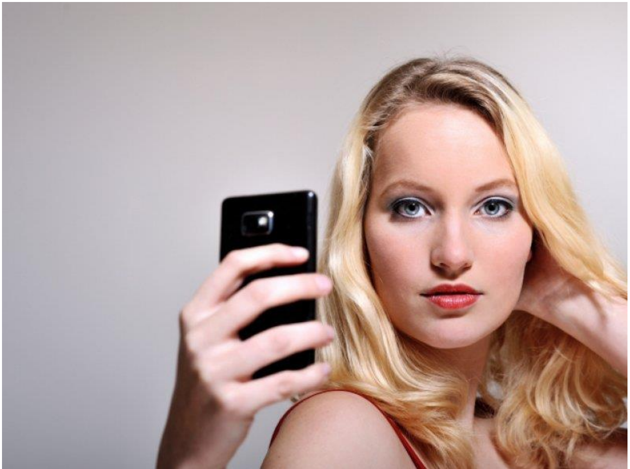
Slika 1. Kultura objava selfija na društvenim mrežama kao obilježje narcističke kulture

Izvor: Katana, E. (2015). Zašto je kultura selfieja zavladała svijetom?, dostupno na https://www.tportal.hr/lifestyle/clanak/zasto-je-kultura-selfieja-zavladała-svijetom-20150703 , pristupljeno 09.09.2024.