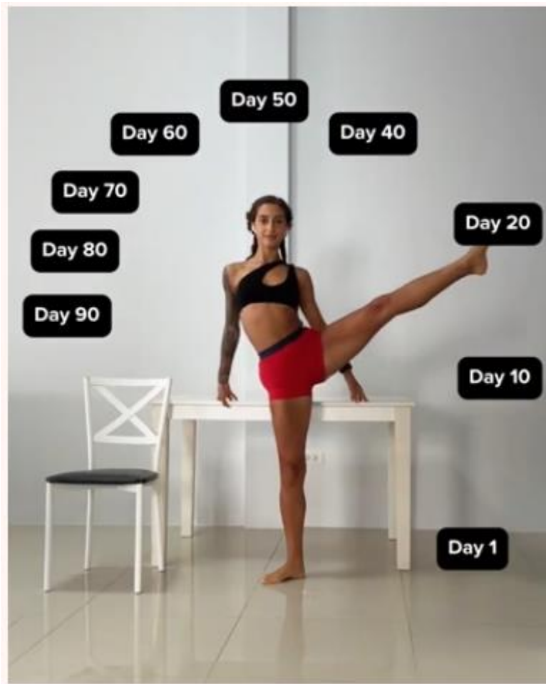
Slika 7. Reklama kompanije Stretchit sa elementima narcizma