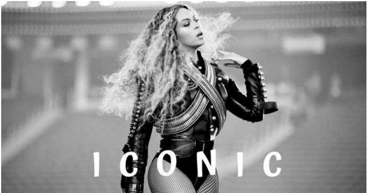
Slika 11. Selfi Beyonce gdje sama sebe proglašava ikonom