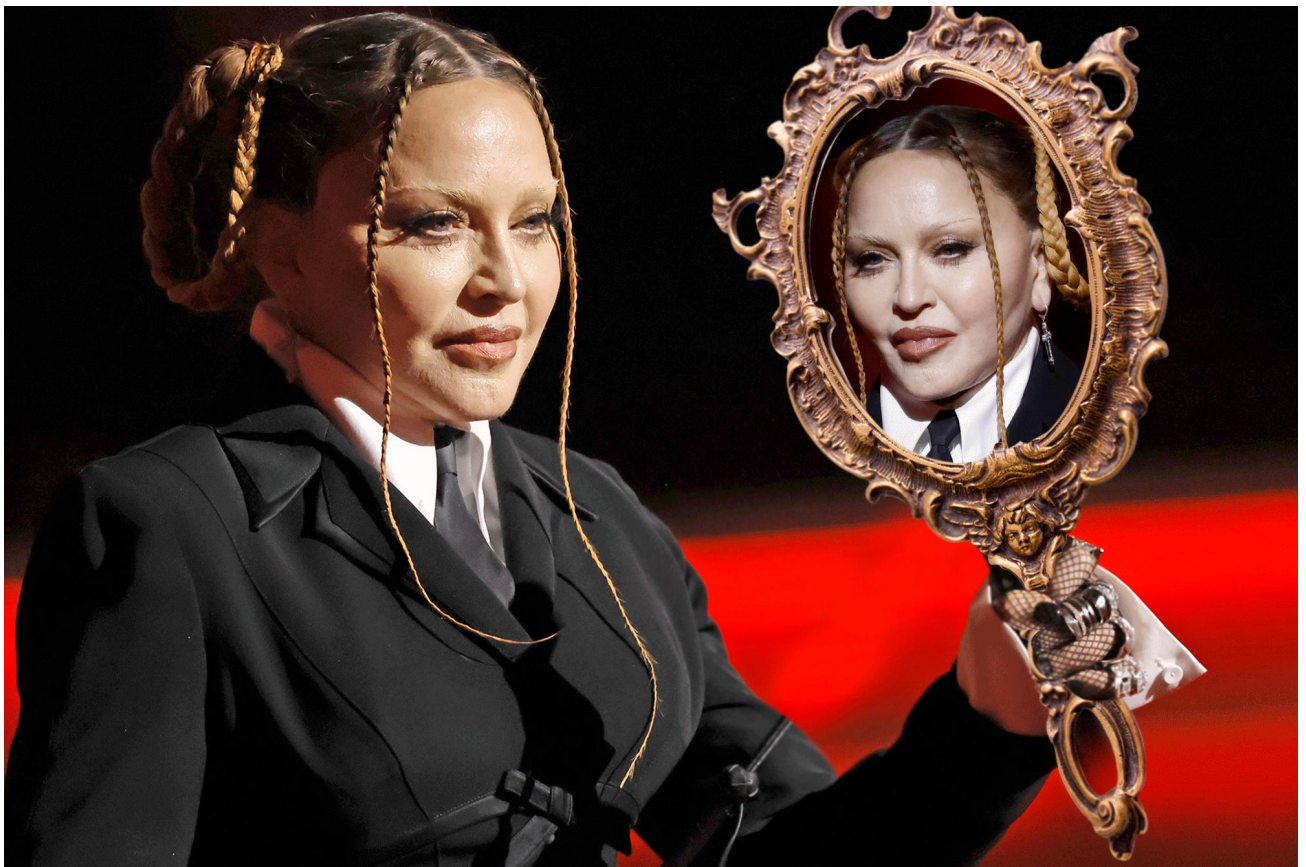
Slika 8. Slika Madonne sa elementima narcizma u interpretaciji lika kraljice iz bajke Snjeguljica