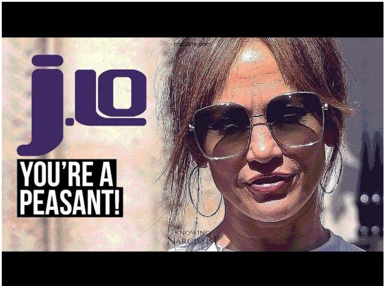
Slika 9. Fotografija Jennifer Lopez sa porukom „You are a peasant!“