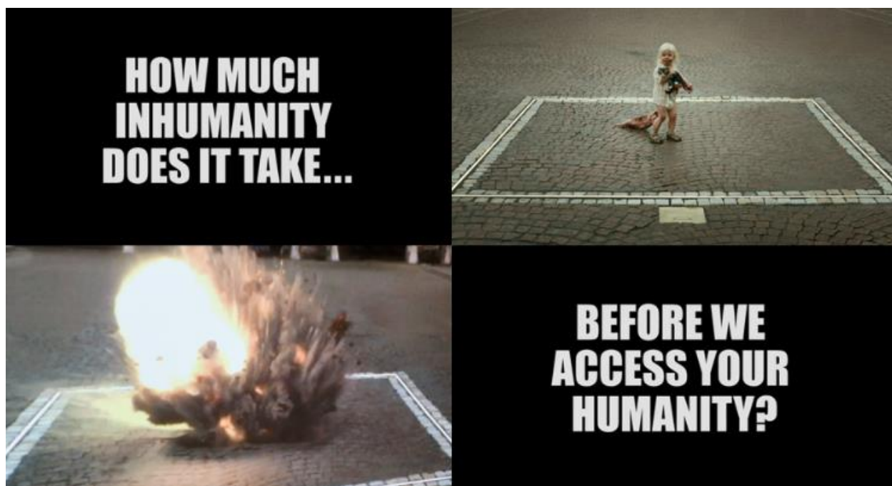
Slika 8. Eksplozija unutar pacifističke instalacije

U šestominutnoj sceni marketinški stručnjaci prezentiraju svoj kreativni koncept odboru muzeja uz uvertiru da drugi muzeji nisu primarni konkurenti u privlačenju medijske pažnje, već događaji poput katastrofa, terorizma i djelovanja ekstremističkih skupina. Analizom sadržaja na društvenim mrežama ustanovljeno je da su ugrožene skupine, poput žena, osoba s invaliditetom, rasnih manjina te LGBTQIA zajednice najčešće u središtu pozornosti. Međutim, najviše empatije izaziva sadržaj s prosjacima. Stoga je predloženo kreiranje videozapisa u kojem bi središnji motiv bilo dijete koje prosi, tipično švedskog izgleda, plavokoso, čime se namjerno evocira klišej. Djevojčica bi ušla u prostor umjetničke instalacije dršćući i plačući, stvarajući snažan vizualni efekt koji privlači pažnju gledatelja. Zatim bi se dogodilo nešto neočekivano što je u suprotnosti s vrijednostima kvadrata, a što uključuje stradavanje djeteta čime se ostvaruje željeni efekt šoka (vidi sliku 8).