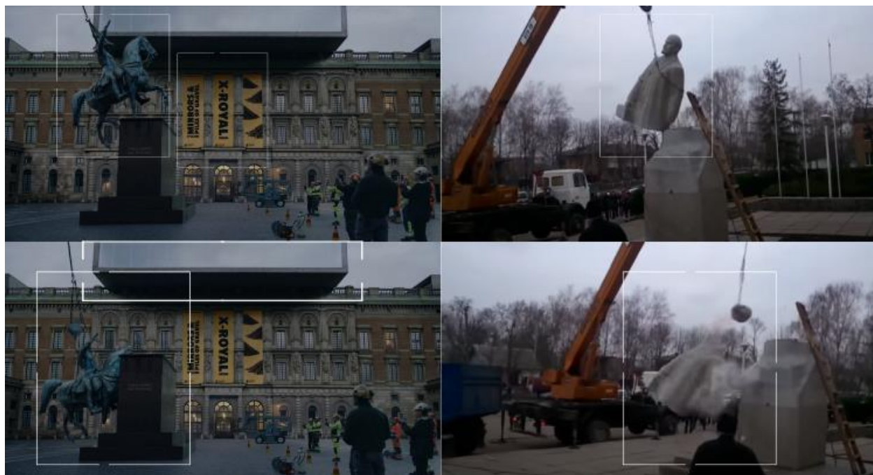
Slika 5. Uklanjanje skulpture

U prenaplašen scenski koncept Östlund amplificira još jedan satirični arhitektonski segment. Riječ je o kvadratnoj nadogradnji na vrhu muzeja koja svojom čistom geometrijskom formom kontrastira klasičnim elementima ispod. Svojom težinom i oblikom djeluje neskladno, gotovo kao da „nasilno” pritišće i narušava ravnotežu povijesne strukture ispod sebe, sugerirajući tako simbolički sukob između tradicionalnih i suvremenih umjetničkih vrijednosti.