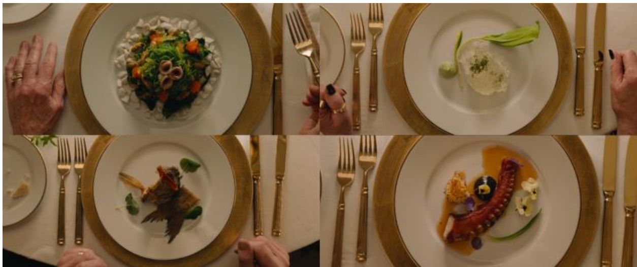
Slika 11. Otmjena jela Izvor: Fredrik Wenzel ©Plattform Produktion (obrada autora)

Sličan primjer uporabe objekata materijalnog bogatstva radi pojačavanja diskursa o ekstremnoj privilegiranosti bogatih pojavljuje se u scenama luksuzne kapetanove večere od sedam sljedova. Prikaz tanjura u krupnom planu popraćen je specifičnim leksičkim izborima. Gostima su poslužena otmjena jela: „Kamenica s daškom crnog ruskog kavijara”, „Morski jež u emulziji od morskih algi, posut crnim tartufom, kavijarom i čili uljem, preliven yuzu vinaigretteom”, „Pečena i dimljena hobotnica s karameliziranim limunom, posuta vrtnim cvijećem.” (vidi sliku 11).