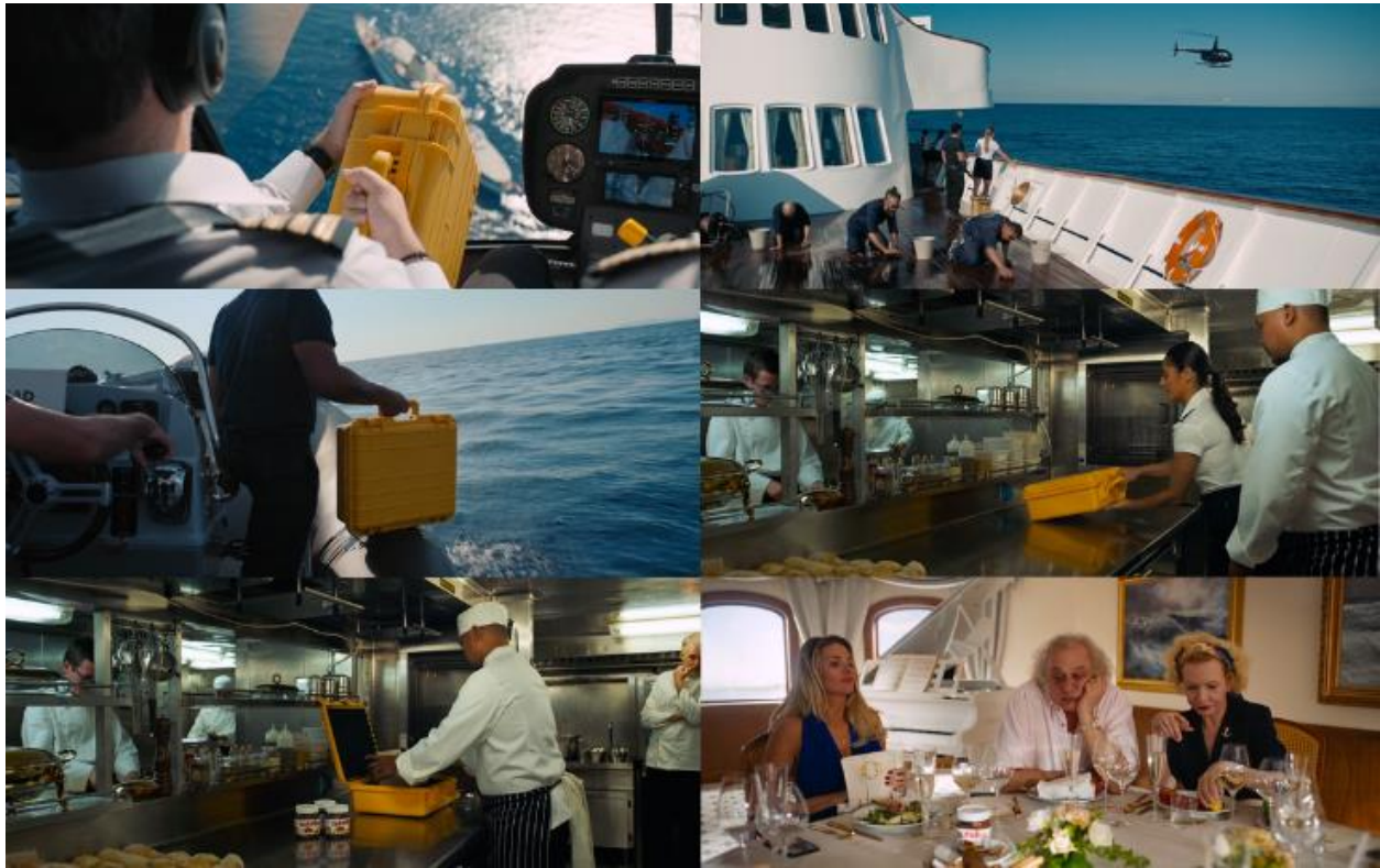
Slika 12. Staklenke Nutelle Izvor: Fredrik Wenzel ©Plattform Produktion (obrada autora)

ekscesivne potrošnje. Östlund implicira kako globalnim superbogatašima ništa nije izvan doseg a te su posve neopterećeni postojećim prostornim ili materijalnim uvjetima i ograničenjima (vidi sliku 12).