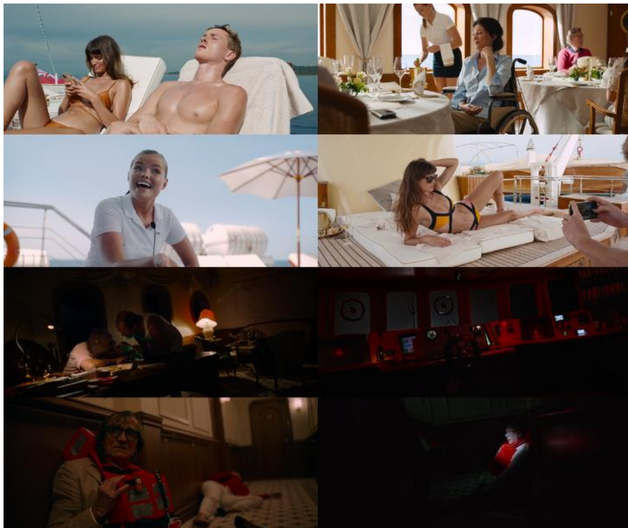
Slika 16. Dnevni i noćni imaginacijski sustav Izvor: Fredrik Wenzel ©Plattform Produktion (obrada autora)

sustav dominira prikazima. Prenaglašena scenografija i intenzivno osvjetljenje djeluju u sinergiji kako bi stvorili ultra realističan prostor u kojem se vizualna redundancija upotrebljava za stvaranje iluzije sigurnosti i kontrole te prikrivanje dubljih sukoba. Međutim, drugom polovicom sekvence počinje dominirati noćni imaginacijski sustav koji odražava poremećaj unutar narativne strukture i sugerira promjenu u dinamici odnosa među likovima, gubitak kontrole, prijetnju i približavanje katastrofe (vidi sliku 16).