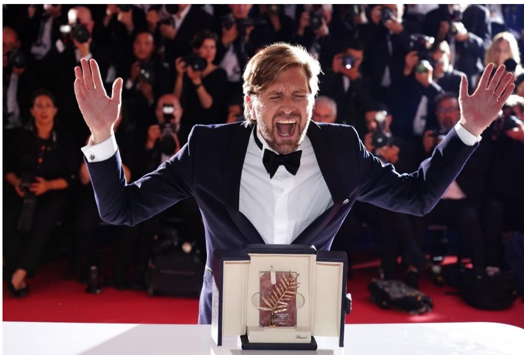
Slika 1. Ruben Östlund dobitnik Zlatne palme za film „Trokut tuge”, nazočan foto pozivu dobitnika nagrada na 75. Filmskom festivalu u Cannesu, 28. svibnja 2022.

Satirična drama o suvremenoj umjetnosti „Kvadrat” donijela je Östlundu 2017. godine prvu Zlatnu palmu, čime je postao prvi švedski redatelj dobitnik te nagrade nakon legendarnog Alfa Sjöberga, koji je istom nagradom ovjenčan 1951. godine za „Gospođicu Julie” (Rehlin, 2022). Drugi put Östlund je Zlatnom palmom nagrađen 2022. godine za satiričnu crnu komediju „Trokut tuge” (vidi sliku 1). Kao dvostruki laureat Zlatne palme, Ruben Östlund svečano je imenovan predsjednikom žirija 76. Filmskog festivala u Cannesu, 50 godina nakon što je tu ulogu obnašala njegova sunarodnjakinja, glumica Ingrid Bergman.