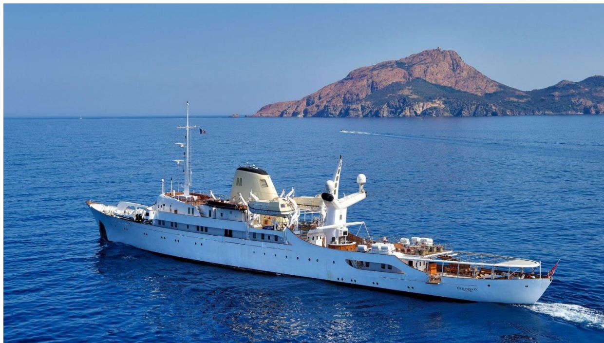
Slika 9. "Christina O"

svijeta, a može poslužiti i kao eksplicitan redateljev komentar u kojem je iskrivljena slika metafora za iskrivljenost cijelog društvenog poretka ili kao subjektivni prikaz stanja lika. U oba je slučaja primarni izraz nelagoda, što ovaj postupak čini posebno efektnim u filmskim žanrovima poput komedije, u kojima svijet ponekad doslovno „poludi“. Istovremeno, nizozemski kut može imati i konkretniju funkciju kao što su prikazi fizičkih poremećaja poput potonuća broda (Peterlić, 2018: 92).