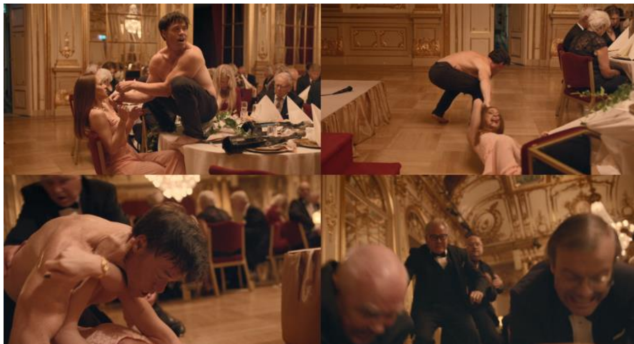
Slika 7. Eskalacija nasilja

Olegov performans funkcioniše i kao socijalni eksperiment koji razotkriva poteškoće u prevladavanju socijalne indiferentnosti u kontekstu kasnomodernih zapadnih društava, obilježenih snažnim individualizmom i moralnim relativizmom. Uspostavljanjem scenskog okvira koji zahtijeva kognitivnu konfrontaciju, Östlund suočava gledatelja s autorefleksijom i neugodnim promišljanjem o tome koliko dugo pojedinac, uključujući i samog gledatelja, može tolerirati opasnost koja prijete drugima prije nego što osjeti potrebu za intervencijom i napuštanjem vlastite suspendirane stvarnosti.