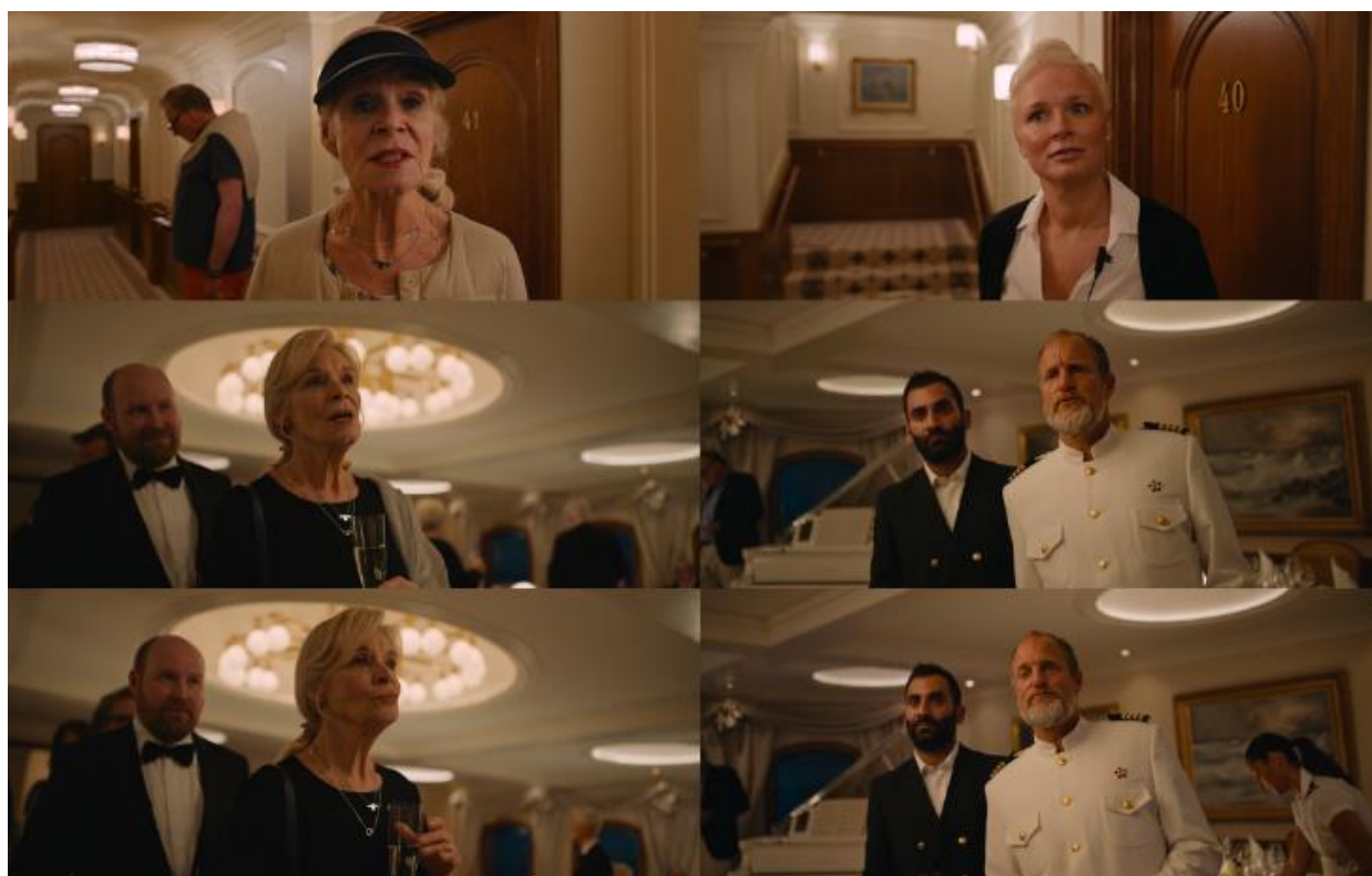
Slika 13. Razgovor o prljavim jedrima Izvor: Fredrik Wenzel ©Plattform Produktion (obrada autora)

U ovoj sceni gošća i kapetan snimljeni su iz donjeg rakursa čime Östlund naglašava paritet u odnosima moći među likovima (vidi sliku 13). Hiperbolični prikaz bogate gošće ne predstavlja nužno patologizaciju već signalizira distorziju stvarnosti unutar okvira ekstremnog bogatstva gdje čak i najapsurdniji zahtjevi postižu legitimitet. Moć se pripisuje bogatstvu, a ne racionalnosti, čime se ističe simbolički kapital bogatih koji im omogućava autoritativnost u svakom diskursu, neovisno o istinitosti njihovih tvrdnji.