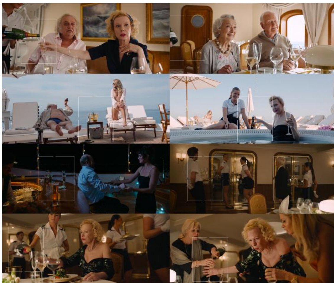
Slika 10. Posluživanje šampanjca u svako doba dana

U filmu „Trokut tuge” bogati su prikazani kroz satirični okvir s namjerom isticanja njihove moralne slabosti, površnosti i ovisnosti o materijalnom bogatstvu. Östlund ih kroz ekstremne situacije i apsurdne dijaloge prikazuje kao isprazne, dekadentne i dislocirane od objektivne stvarnosti i svakodnevnog iskustva većine populacije. Njihov životni stil prikazan je kroz ritualizirane aktivnosti. Oni prekomjerno uživaju u šampanjcu i raskošnim banketima dok ih uslužno osoblje diskretno prati i ispunjava sve njihove potrebe i želje. Sveprisutni motiv šampanjca nije slučajnost. Šampanjac je univerzalni simbol luksuza i ekonomskog prestiža. On je ključni atribut koji definira status gosta i dinamiku između osoblja i gostiju. Iako se tradicionalno pije u trenucima slavlja, u filmu se poslužuje neovisno o prigodi (vidi sliku 10).