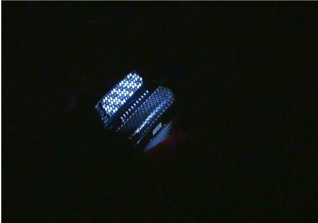
Slika 2: Scena inspirirana sevdahom „Negdje u daljine”

Scena koja slijedi inspirirana je sevdahom „Ne klepeći nanulama”. U ovoj sceni konce smo isključivo upotrijebili kao tehnička sredstva kojima smo animirali predmete. U radu na ovoj etidi istraživanje je bilo nešto drugačije, nego li u prijašnjim etidama. Ovdje smo morali sami osmisliti scenski zanimljiv događaj. Odlučili smo retrospektivom oživjeti duh starice na sceni. Odabrali smo predmete koje povezujemo sa staricom i radnjama koje bi ona izvodila. Zbog toga smo koristili cipele koje su simbol duha starice koji se kreće, potom stolicu na ljuljanje, maramu, kantu, uže, veliku bijelu tkaninu i pomoću njih oživjeli radnje starice. Cipelama povezanim na dvije strane koje animira dvoje animatora, i naravno posvećenom i koncentriranom animacijom postigli smo polagano koračanje duha starice. Potom smo animacijom scenografije poput ljuljanja stolice, padanjem marame, micanjem kante, podizanjem tkanine na uže ostvarili radnje starice. Budući da su cipele jedini objekt kojima smo oživljavali i otjelotvorili staricu, sve radnje morale su biti u tempu i ritmu precizne. Lagani iskorak, napinjanje prstiju pri vješanju rublja i njihanje na stolici dali su starici život i učinili ju da biva u vremenu i prostoru. Kada cipele odlaze iza bijele tkanine,