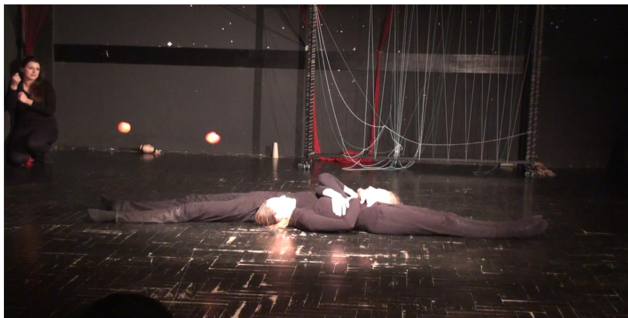
Slike 10, 11: Scena inspirirana sevdahom „Žute dunje”