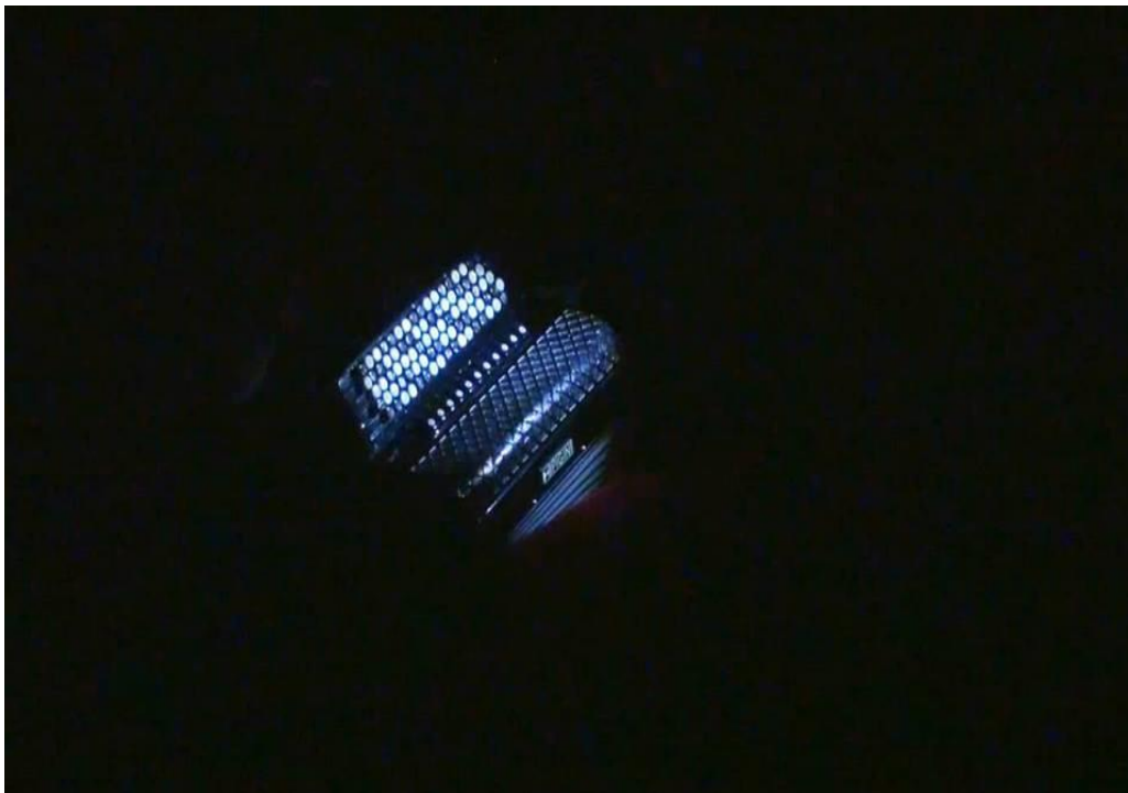
Slika 2: Scena inspirirana sevdahom „Negdje u daljine”

Scena koja slijedi inspirirana je sevdahom „Ne klepeći nanulama”. U ovoj sceni konce smo isključivo upotrijebili kao tehnička sredstva kojima smo animirali predmete. U radu na ovoj etidi istraživanje je bilo nešto drugačije, nego li u prijašnjim etidama. Ovdje smo morali sami osmisliti scenski zanimljiv događaj. Odlučili smo retrospektivom oživjeti duh starice na sceni. Odabrali smo predmete koje povezujemo sa staricom i radnjama koje bi ona izvodila. Zbog toga smo koristili cipele koje su simbol duha starice koji se kreće, potom stolicu na ljuljanje, maramu, kantu, uže, veliku bijelu tkaninu i pomoću njih oživjeli radnje starice. Cipelama povezanim na dvije strane koje animira dvoje animatora, i naravno posvećenom i koncentriranom animacijom postigli smo polagano koračanje duha starice. Potom smo animacijom scenografije poput ljuljanja stolice, padanjem marame, micanjem kante, podizanjem tkanine na uže ostvarili radnje starice. Budući da su cipele jedini objekt kojima smo oživljavali i otjelotvorili staricu, sve radnje morale su biti u tempu i ritmu precizne. Lagani iskorak, napinjanje prstiju pri vješanju rublja i njihanje na stolici dali su starici život i učinili ju da biva u vremenu i prostoru. Kada cipele odlaze iza bijele tkanine,