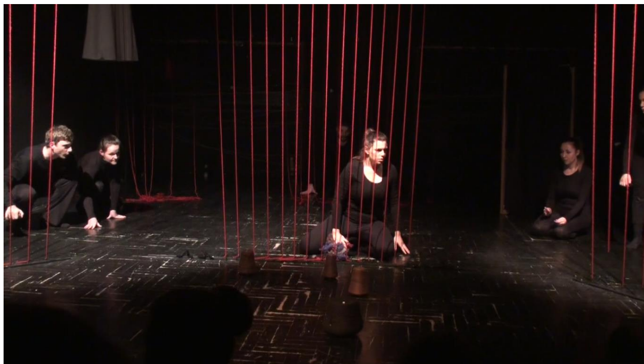
Slika 4: Scena inspirirana sevdahom „Na mezaru majka plače”

Simboli koje nudi ova etida ispričani su na vizualno najdominantniji način, ispunjavaju prostor i stvaraju gigantsku marionetu koja zbog indirektna animacije predmeta u potpunosti postaje dijelom ove predstave i priča priču koju je, gledajući tekst sevdaha teško ispričati riječima.