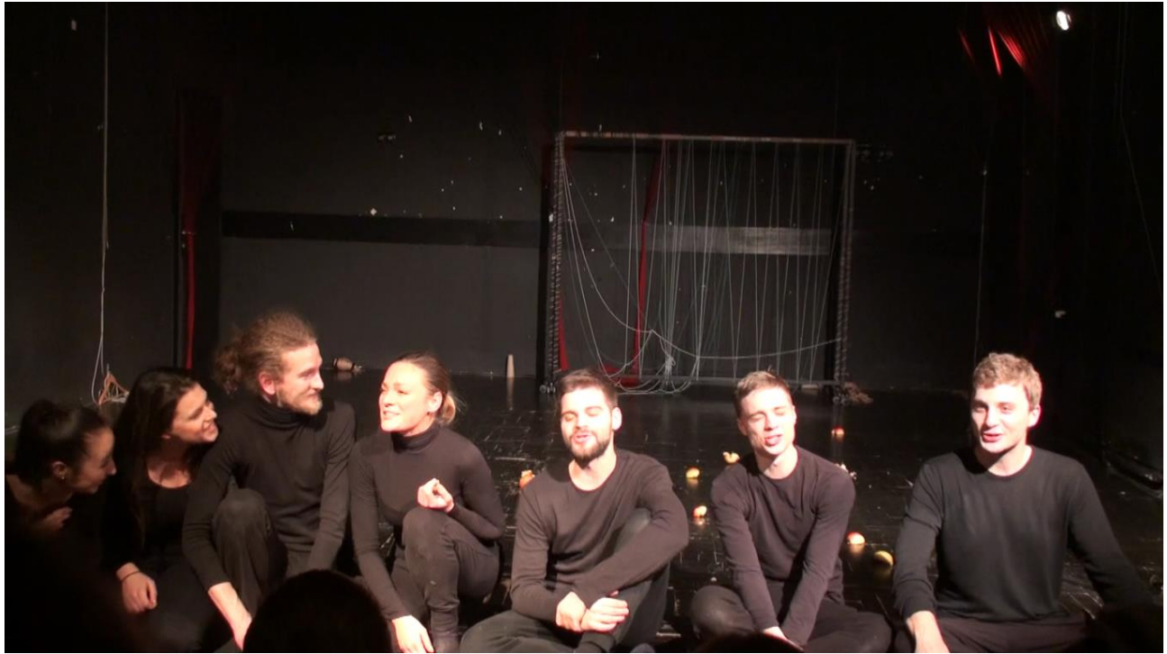
Slika 12: Završnica predstave sevdahom „Pjevat ćemo što nam srce zna”