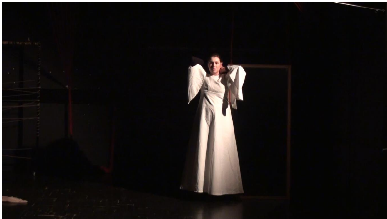
Slika 7: Scena inspirirana sevdahom „Lijepa Zejna”

Potom slijedi scena inspirirana sevdahom „Elma”. U njoj čitamo borbu s budućnosti. Simboliku ovog sevdaha postigli smo stavivši kao glavnu temu priču o dvoje zaljubljenih mladih ljudi koje odvaja smrt. Kako se u svim scenama radi o sudbinama ljudi, dopustili smo si upravo i u ovoj poigrati se i otjelotvoriti sudbinu. Imali smo dvoje glumaca koji igraju svoju ljubavnu priču i ostatak klase koji je igrao sudbinu. Oni su doslovno držali sve konce u rukama i odlučivali o tragičnoj sudbini. Na samome početku postavljena su dva okvira omotana vunom te se zakretanjem okvira niti polako raspetljavaju i rađaju se dva nova bića. Sudbina im potom u ruke daje zavezani konac (glumici – tirkizni, glumcu – bijeli) za okvir kao simbol njihovih života. Oni namotavanjem okvira kreiraju svoj život, upravljaju njime, odlučuju o tempo – ritmu kojim će teći njihov život do trenutka u kojem se sudbina u obliku ljudi na sceni i melodije koju pjevaju ne umiješa u njihove živote i osvijesti ih na čekanje nečeg neotkrivenog. U tom se trenutku glumci na tren zalede, no ponovnim udahom nastavljaju oblikovati svoj život. Zbog prikaza protoka vremena u kojem ovo dvoje mladih odrastaju svatko u svome okviru života, sudbina njihove okvire cirkulira prostorom u različitom tempu. U jednom točno određenom trenutku nanovo se umiješa sudbina koja spaja