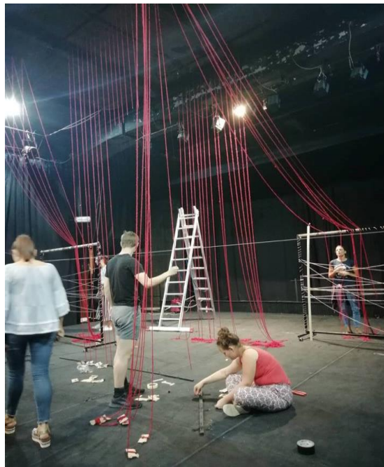
Slika 5,6: Postavljanje scene inspirirane sevdahom „Na mezaru majka plače”

Scena inspirirana sevdahom „Lijepa Zejno” posjeduje kao i scena „Ne klepeći nanulama” potrebu za prikazivanjem duha odnosno nečeg nadrealnog na sceni. Tako smo se odlučili za animaciju predmeta koji će time otjelotvoriti lik duha pokojnoga muža. Samim time otvaramo prostor za glumačku igru i prirodnost reakcija glumice. U ovoj sceni vidimo mladu ženu koja se bori sa svojom prošlošću, sadašnjošću i budućnošću, točnije bori se sama sa sobom. Zarobljena u svojoj prošlosti ne prepušta se onome što ju očekuje u sadašnjosti. Njezinu borbu odlučili smo provesti uvođenjem duha njezinog preminulog muža. Ovakva je tematika bila podobna za lutkarski način razmišljanja i jaku simboliku predmeta. Ostvariti lik duha pokojnoga, a istodobno ne vidjeti animatore na sceni bio je za nas veliki izazov u tehničkom smislu, ali i u promišljanju. Ono što nam je naša mašta dopustila jest da se poigramo s predmetima, istražimo kvalitetu predmeta i pokušamo u samoj kvaliteti predmeta pronaći simboliku kojom bi povezali odnos glumice i duha preko predmeta. Ponovo smo željeli postići toplu atmosferu i ogoliti osjećaje glumice koje bi