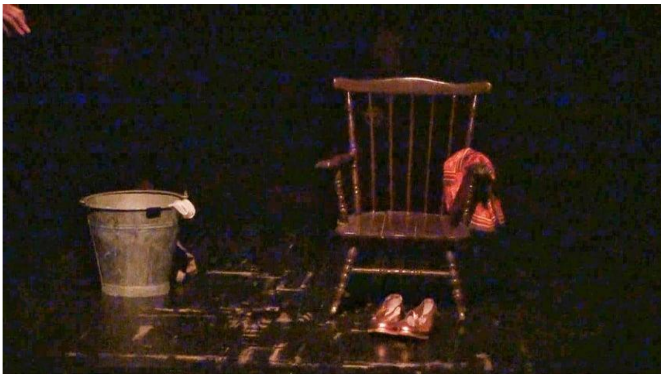
Slika 3: Scena inspirirana sevdahom „Ne klepeći nanulama”

Kako nas u životu određeni predmet podsjeti na osobu koja nam nedostaje i u glavi nam se pojavi događaj vezan za tu osobu tako i ovdje simbolika predmeta koji podsjećaju na staru majku itekako čine ovu predstavu živom, istinitom i mogućom.