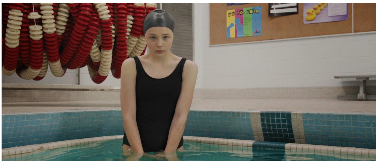
Slika 2 - Carrie u bazenu (2013.)

Ta promjena je za neke predstavljala problem, no činjenica je da se Peirce u skladu s poželjnim društvenim promjenama, ali i činjenici da je riječ o redateljici, odmiče od objektivizacije ženskog tijela, pogotovo ako znamo da se priča odvija u srednjoj školi, među mladim tinejdžericama koje se po prvi puta susreću s menstruacijom.