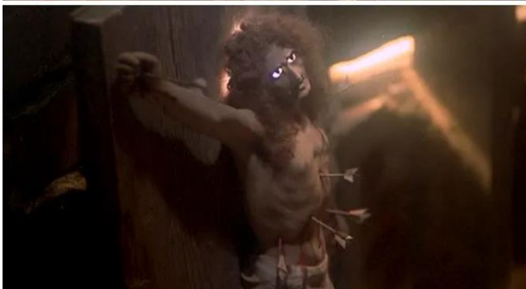
Slika 4 - Carrie (1976.) Margaret i ikona iz „ormara za molitvu“

Umjesto posljednjeg „pokajanja“, Carrie daje još jednu „pljusku“ majci i njenom religijskom fanatizmu koji je od Carrie White napravio izopćenicu, mučenicu, i na kraju ubojicu.