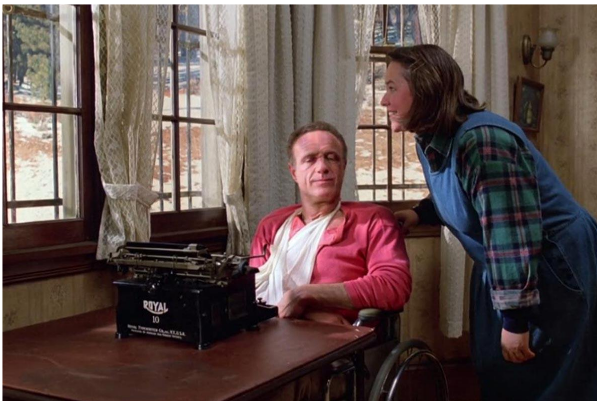
Slika 10 - Sheldon za pisaćim strojem, pored prozora s rešetkama u Misery (1990)

Time King želi prenijeti poruku kako je, kroz sav očaj i nezadovoljstvo svojim radom, ipak shvatio da je upravo pisaći stroj ono što mu daje snagu. Pisaći stroj ga ne dovodi u kolotečinu – on ga iz iste vadi. Na simboliku lika Annie Wilkes vratit ćemo se ubrzo, no važno je ovdje naglasiti da je Annie u Misery nositeljica mentalne bolesti, a s kojom je King u stvarnom životu bio dobro upoznat (njegova je majka dugo radila u kuhinji ustanove za mentalno oboljele), ali i čitateljskog fanatizma – ili, u najblažem obliku, one grupe čitatelja koju svaki autor pokušava zadovoljiti, ali nikako ne uspijeva. Čin udaranja Annie pisaćim strojem u glavu je završni čin kojim Paul Sheldon (ali i Stephen King) shvaća da ne može zadovoljiti svakog kritičara, ili svakog čitatelja, ali da to ne umanjuje vrijednost ili snagu njegovih tekstova i subtekstualnih poruka koje pokušava prenijeti.