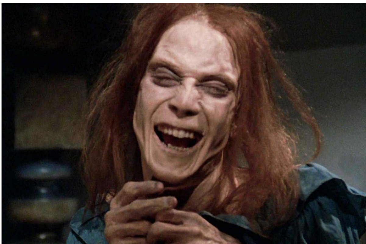
Slika 7 - 'Zelda' u Groblju kućnih ljubimaca (1989)

Zanimljivo je da se u adaptaciji iz 1989. Zelda više pojavljuje kao noćna mora, ili kao duh koji proganja gospođu Creed – ona služi kako bi razbila distinkciju između sna i jave, između realnosti i ludila. U adaptaciji iz 2019., lik Zelde odveden je korak dalje i postaje važan nositelj horora – pogotovo nakon scene gdje pada i lomi se u dizalu za hranu.