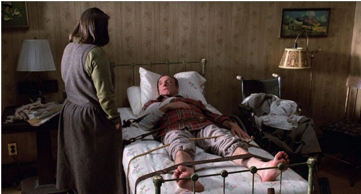
Slika 9 - Annie Wilkes (Kathy Bates) i Paul Sheldon (James Caan) u Misery (1990)

Radnja romana Misery prati Paula Sheldona, pisca svjetski popularnih povijesnih romantičnih romana o Misery Chastain i njenim ljubavnim zavrzlamama. Sheldon prezire Misery i način na koji ga se marginalizira kao isključivo žanrovskog autora, te ju u svojem posljednjem romanu ubija, u želji da se okrene pisanju ozbiljnije literature.