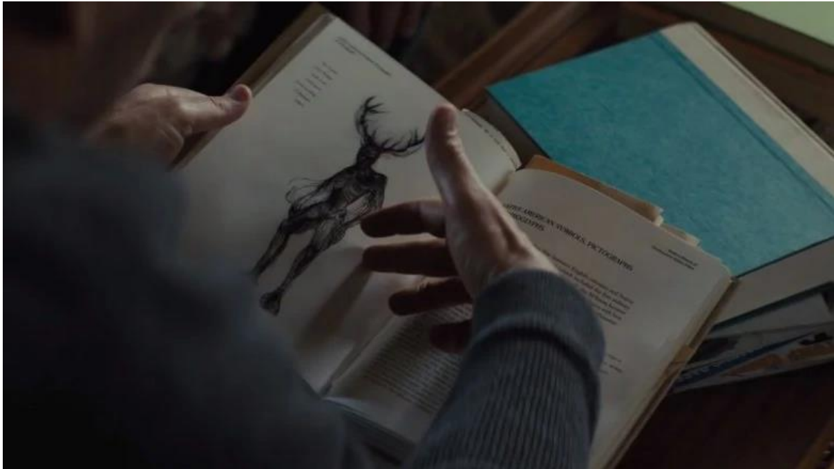
Slika 6 - 'Wendigo' u Groblju kućnih ljubimaca (2019)

a većinom u blizini i okolici Velikih jezera. Biće su opisivala razna domorodačka, indijanska plemena, svako na sebi svojstven način. U osnovi je ipak riječ o istom biću – Wendigo je kanibalistički nastrojeno, nadnaravno biće, koje ima nezasitnu proždrljivost i ubilački nagon prema ljudima. Kažu da Wendigo nastaje kada se ljudsko biće okrene kanibalizmu da bi preživjelo – biva prokleta nezasitnom željom za ljudskim mesom.