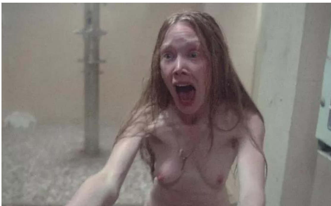
Slika 1 - Golotinja u Carrie (1976.)

Još jedan aspekt djela koji se mijenja kroz roman i filmske adaptacije, a usko je vezan uz fizički izgled jest prikaz golog ženskog tijela. King inače nema problem s opisivanjem golotinje, scena seksa, ali i seksualne izopačenosti u svojim djelima. Ipak, u romanu Carrie ta golotinja nije toliko naglašena, prvenstveno stoga što Carrie nije niti zamišljena kao atraktivan i seksualno poželjan ženski lik. Međutim, već u De Palminoj adaptaciji iz 1976., golotinja je gotovo sveprisutna, možda i do granice nepotrebnosti.