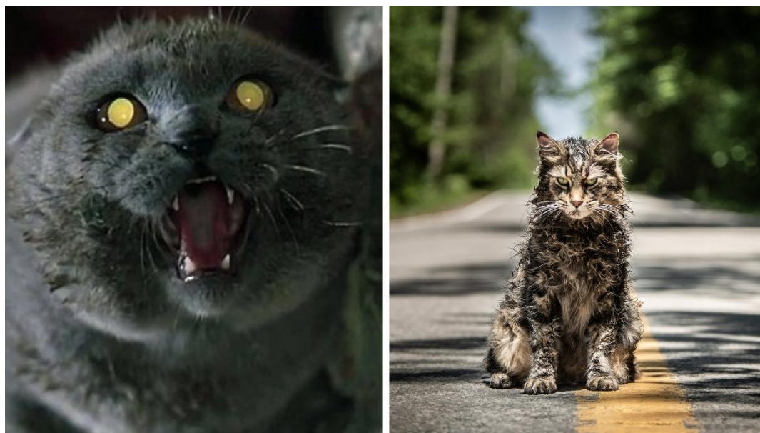
Slika 8 - Mačak 'Church' - usporedba adaptacija iz 1989. i 2019.

Groblje u romanu samo po sebi ima svojevrstan „psihodelični“ utjecaj na ljude. Oni zapravo nisu odgovorni za svoje postupke, iako misle da su odluke koje donose uistinu njihove. To se ponajbolje očituje na primjeru djece koja, gotovo hipnotizirano, stvaraju Groblje kućnih ljubimaca, a grobove nesvjesno formiraju u spirali – istoj arhaičnoj spirali koja je vidljiva i na glavnom, ukletom groblju. Također, u romanu je jasno kako je Louis gotovo hipnotiziran dok on i Jud odnose Churcha na Groblje da ga Creed zakopa.