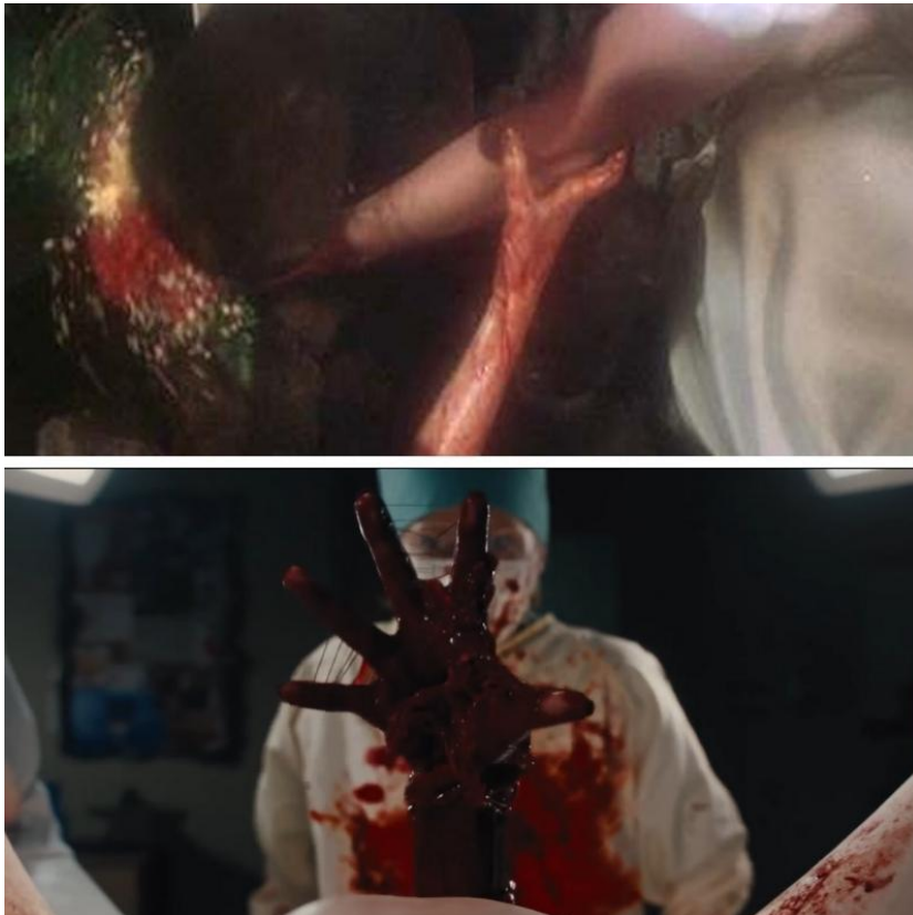
Slika 5 - Usporedba scene s rukom iz Carrie (1976) i Carrie (2013)

U adaptaciji iz 2013., Peirce se na neki način vraća izvornom tekstu, ali i dijalogizira s De Palmom – Sue također ima noćnu moru, ali Peirce vraća narativ o njenoj trudnoći, gdje Snell sanja da Carriena ruka izvire direktno iz njene utrobe.