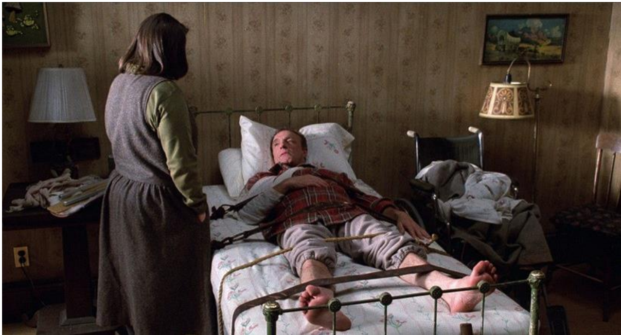
Slika 9 - Annie Wilkes (Kathy Bates) i Paul Sheldon (James Caan) u Misery (1990)

Radnja romana Misery prati Paula Sheldona, pisca svjetski popularnih povijesnih romantičnih romana o Misery Chastain i njenim ljubavnim zavrzlamama. Sheldon prezire Misery i način na koji ga se marginalizira kao isključivo žanrovskog autora, te ju u svojem posljednjem romanu ubija, u želji da se okrene pisanju ozbiljnije literature.