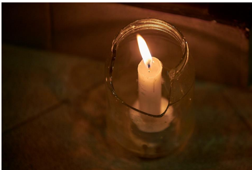
Slika 1. Život u teglici

Rad na predstavi Smrt ili o životu otvorio je svoje poglavlje u prvom semestru druge godine diplomskog studija glume i lutkarstva na kolegijima Osnove lutkarske režije i Majstorska radionica lutkarstvo: Od teksta do inscenacije na kojima smo radili s izv. prof. ArtD. Majom Lučić Vuković i doc. art Tamarom Kučinović. Prije samog početka semestra, dobili smo zadatak da najprije svatko za sebe promisli što bi htio raditi i s čime bi volio okruniti svoje petogodišnje studiranje; je li to dječja predstava s lutkama, lutkarski mjuzikl, predstava na temu fantazije ili na temu poezije i tako dalje. S obzirom da je svatko od nas posebna individua, tako su i želje bile različite. Nakon što smo izložili svoje ideje, odlučili smo da nam se sviđaju dvije teme. Tema o Smrti i tema o Vješticama (u smislu sudbina Ivane Orleanske). Ušli smo dublje u sadržaj tih tema i dobro ih proučili. Nakon toga, uslijedilo je demokratsko glasanje. Smrt je pobijedila 7:1.