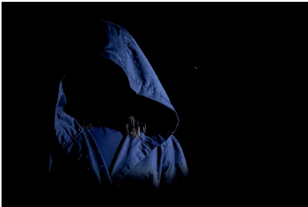
Slika 2. Smrt

Nakon nekog vremena koje smo proveli istražujući i igrajući se, moj odabir pao je na temu – Smrt dolazi po djevojčicu . To je tema s kojom svaki čovjek može suosjećati. Sama pomisao da pokažem ljudima da postoji ljepša strana kad dijete umre, da je njemu sada lakše, da je ono sretnije, tješila je prvo mene, a nadam se i ostale. Upravo je to razlog zbog kojeg sam htjela prikazati tu etidu. A i dijete u meni vjeruje da kad stvarno umreš, dočeka te ono što najviše voliš, ono u što vjeruješ, što te veseli. Što bi drugo moglo dočekati dijete u rajnu nego najveći lunapark kojeg je ikad vidjelo? Veći i od Disneylanda! Barem u mojoj glavi. Ali trebalo je to pokazati na sceni.