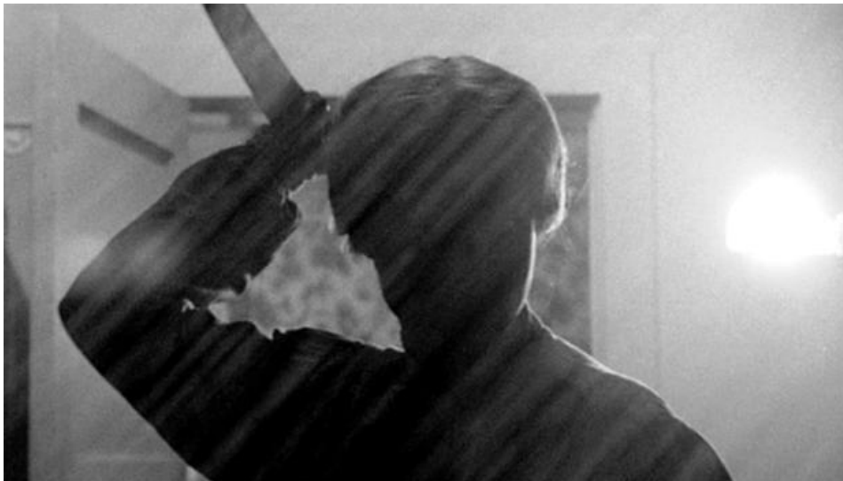
Slika 3. isječak iz filma Psycho

Iz semiotičke perspektive, Hitchcockov Psycho pruža bogat teren za analizu upotrebe simbola i motiva, koji doprinose stvaranju slojevitih značenja unutar filma. Semiotika se bavi time kako znakovi i simboli funkcioniraju unutar sustava značenja, a u spomenutom filmu Hitchcock vješto koristi različite simbole kako bi prenio dublje psihološke i tematske poruke. Jedan od najistaknutijih simbola u tom smislu je nož, koji se pojavljuje kao ključni alat u sceni pod tušem. Nož ne funkcionira samo kao oruđe za ubojstvo, već nosi i dublje značenje povezano s agresijom, seksualnom represijom i kontrolom. U semiotičkom smislu, nož može biti interpretiran kao znak potisnutih emocija, koje dolaze na površinu kroz nasilje.