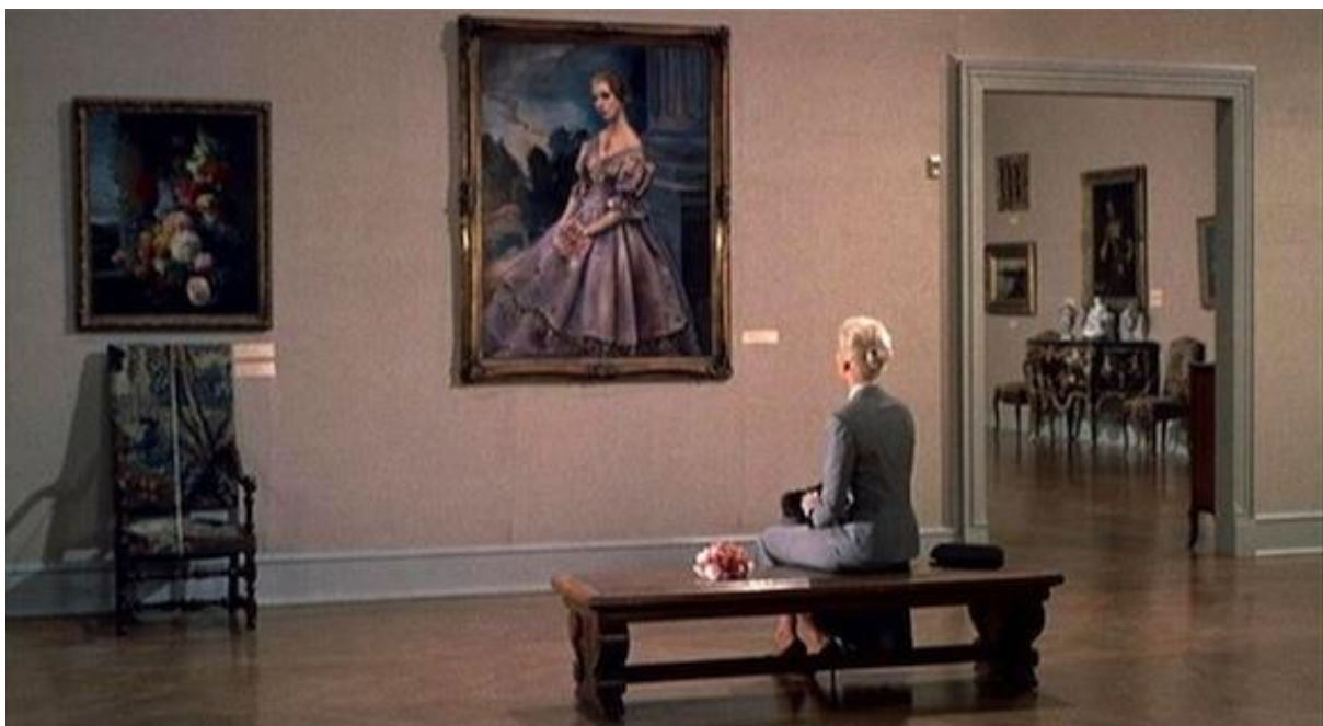
Slika 7 : lik Madeline u filmu Vertigo

Inspiracija iz slikarstva u Hitchcockovim filmovima posebno je vidljiva u načinu na koji on koristi vizualne elemente kako bi stvorio atmosferu i naglasio unutarnje psihološke konflikte likova. Jedan od najpoznatijih primjera dolazi iz filma Vertigo , gdje lik Madeline opsesivno promatra sliku Portret Carlotta u muzeju. Ova slika postaje simbolom njezinog identiteta, povezujući je s prošlošću i misterijem koji okružuje njen lik. Hitchcock ovdje koristi umjetničke motive kako bi stvorio slojevito značenje i simboliku.