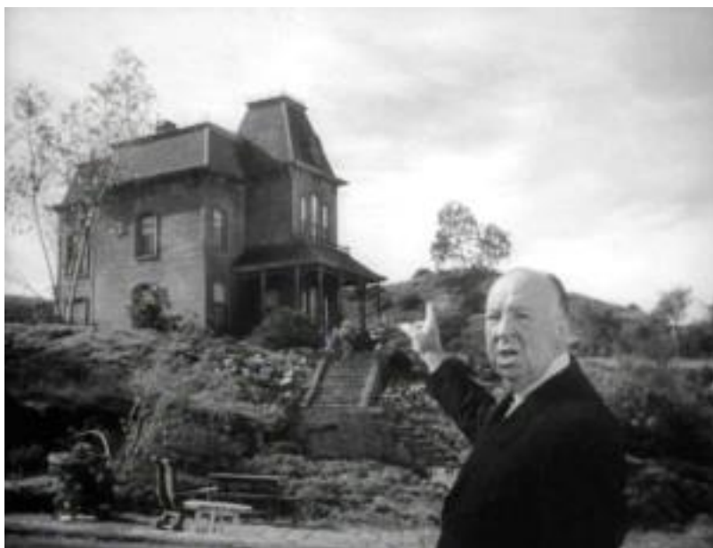
Slika 4. Alfred Hitchcock ispred kuće Normana Batesa

Još jedan važan motiv u filmu Psycho je kuća Normana Batesa, koja je smještena na brdu iznad motela. Ova kuća postaje simbol psihološke dubine likova, s potkrovljem koje predstavlja svjesne misli, a podrum podsjetnik na potisnute tajne i nesvjesne impulse. Struktura kuće i njena izolacija od ostatka svijeta također doprinosi osjećaju klaustrofobije i zatvorenosti, čime Hitchcock vizualno prenosi mentalno stanje likova.