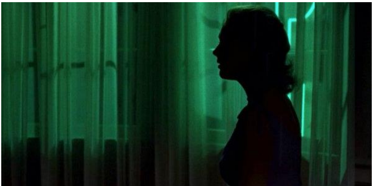
Slika 5 i 6 : lik Madeline u filmu Vertigo