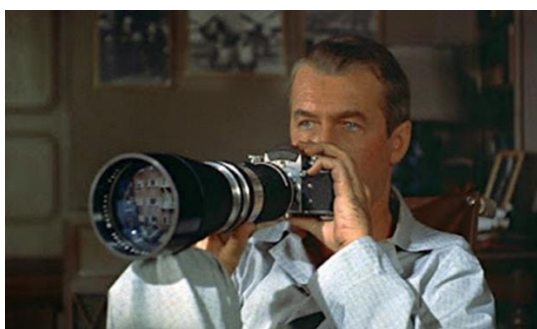
Slika 2. isječak iz filma Rear Window

Pitanje 3: Kako su različiti scenaristi, osobito John Michael Hayes, surađivali s Hitchcockom u stvaranju filmova poput To Catch a Thief i Rear Window , te u kojoj mjeri je Hitchcockova kreativna kontrola oblikovala konačni ishod tih filmova?