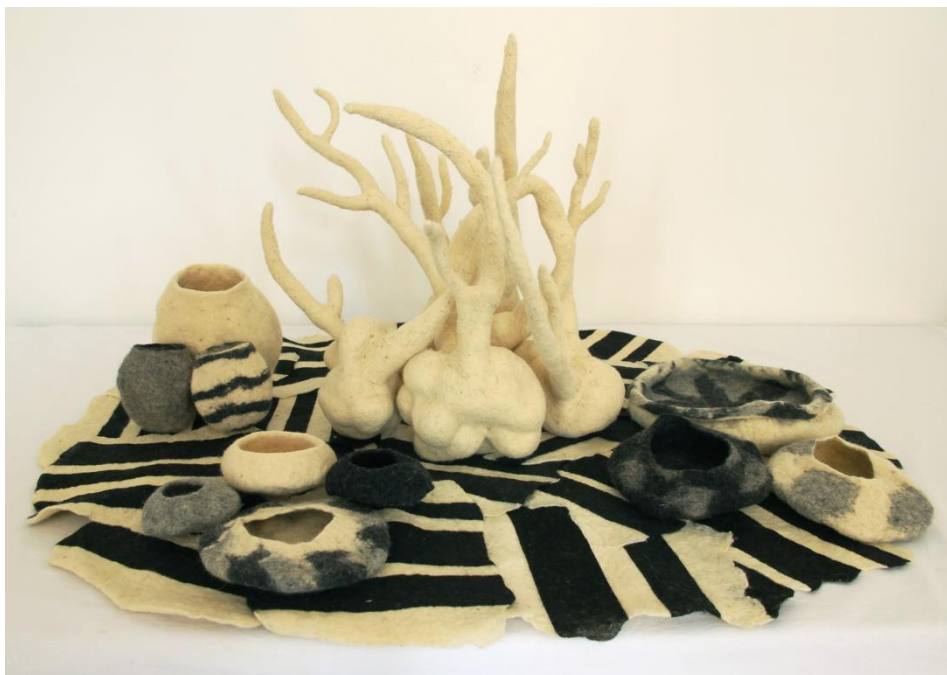
Slika 24. Središnji, podni postav - svi dijelovi zajedno