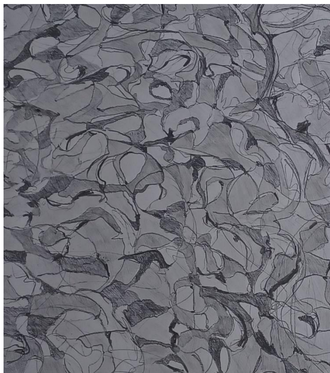
Prilog 6., detalj rada