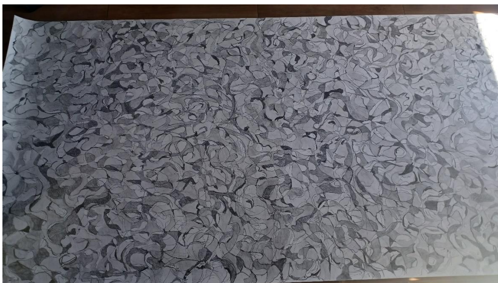
Prilog 7., završni izgled rada