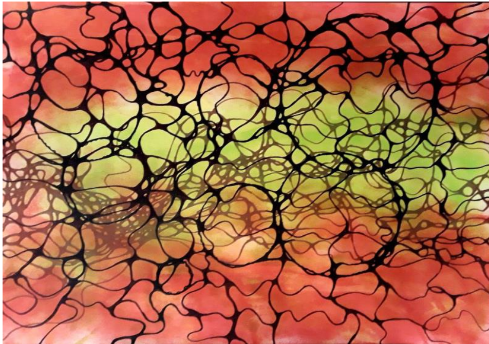
Prilog 3., primjer neurografike