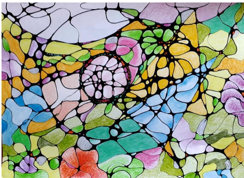
Prilog 4., primjer neurografike