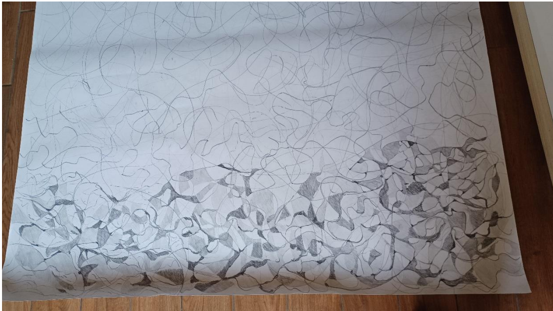
Prilog 5., prikaz procesa rada

Upravo kombinacija vijugavih linija i nepravilnih oblika pojačava osjećaj spontanosti i kreativnosti, ali donosi i kompleksne emocionalne reakcije gdje se energija i kreativna sloboda sudaraju s nepredvidljivošću te stvaraju jak emocionalni osjećaj tijekom cjelokupnog procesa stvaranja rada. Stoga, možemo zaključiti da vijugave linije i nepravilni oblici imaju ključnu ulogu u smjeru djelovanja na emocionalne i psihološke reakcije te omogućavaju prenošenje ideja i osjećaja kroz rad.