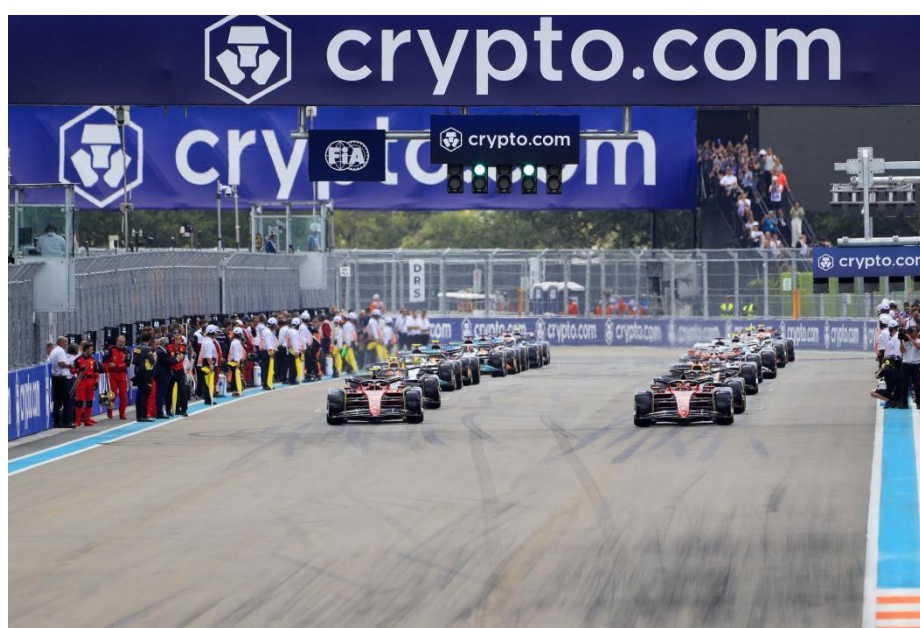
Slika 9. Oglasi naslovnog sponzora VN Miamijske Velike Nagrade, Crypto.com

Sponzorstvo u Formuli 1 složen je proces koji zahtijeva više koraka, pravne ugovore i stručne pravne savjete. Može obuhvaćati različite oblike podrške, uključujući novčane uplate, bonuse i opskrbu. Rezultati timova iz prethodnih sezona često su pozitivno povezani s komercijalnim sponzorstvom, nagradama, prodajom sportske opreme i pravima za televizijske prijenose. Slabiji timovi obično veći dio svojih prihoda ostvaruju putem nagrada i vlasničkih ulaganja. U šezdesetim godinama prošlog stoljeća pioniri poput Brucea McLarena i Colina Chapmana razvili su moderne strategije sponzorstva u Formuli 1, surađujući s američkim stručnjacima koji su znali kako komunicirati sa sponzorima na način koji u Europi tada nije bio uobičajen. U Formuli 1 razlikuju se dva glavna tipa sponzorstva: manje vidljivo sponzorstvo, koje često uključuje opskrbu, i više vidljivo sponzorstvo, koje obuhvaća reklamiranje na bolidima i stazi. S obzirom na rast broja gledatelja i obožavatelja koji posjećuju utrke, pretplaćuju se na televizijske kanale ili koriste digitalne usluge, vrijednost sponzorstava u Formuli 1 značajno je porasla. (Cobbs et al., 2017.)