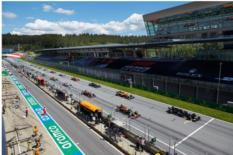
Slika 13. Prazne tribine na prvoj utrci sezone u Austriji tijekom pandemije Covid-19.

Red Bull Racingu i Red Bull Teamu porastao je s 866 na 934, čime su se gotovo izjednačili s brojem zaposlenih u Mercedesu. McLaren Racing ostvario je izniman financijski uspjeh u odnosu na prethodno razdoblje, s prihodom od 333 milijuna funti i dobiti od 136 milijuna funti, što predstavlja impresivan rast od čak 400%. Međutim, značajan dio tih brojki rezultat je prodaje naslijeđene imovine sestrinskoj tvrtki. Kada se ti podaci isključe, ukupan prihod tima smanjuje se na 160 milijuna funti, što predstavlja pad od 12% u odnosu na prethodnu godinu, kada je iznosio 178 milijuna funti. Gubitak, isključujući prihode od naslijeđene imovine, iznosio je 36 milijuna funti, jednako kao i u 2019. godini. Broj zaposlenih u timu porastao je na 841 u 2021. godini, što je u skladu s proračunskim ograničenjem od 145 milijuna dolara. (Službena stranica Race fans, pristupljeno 24.8.2023.)