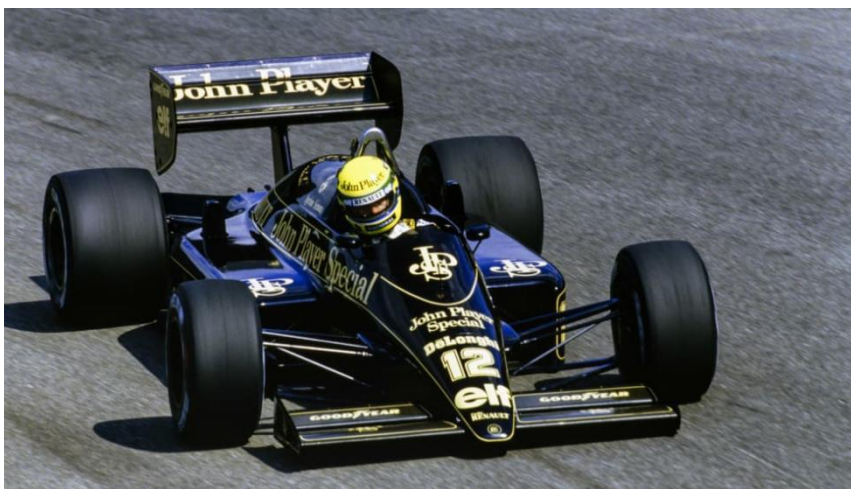
Slika 10. Ayrton Senna u bolidu momčadi Lotus, stiliziranom u bojama JPS cigareta

Sponzorstva duhanskih proizvoda u Formuli 1, unatoč početnim zabranama, odigrala su ključnu ulogu u marketinškoj strategiji sporta. Godine 1968. Imperial Tobacco prekršio je te zabrane postavši prvi komercijalni sponzor u povijesti F1, s ugovorom vrijednim 85.000 funti godišnje. Taj događaj otvorio je vrata sve većem angažmanu duhanskih tvrtki u sportu, a vrhunac njihova utjecaja bio je vidljiv u ikoničnom crno-zlatnom izdanju Lotus ekipe u razdoblju od 1972. do 1978. godine, kada su JPS logotipi tvrtke Imperial krasili bolid. Ekipe je osvojila tri svjetska prvenstva, što je jasno pokazalo koliko veliki sponzori, sa svojim financijskim potporama, mogu utjecati na uspjeh pojedinih timova. (Službena stranica Medium, pristupljeno 18.8.2023.)