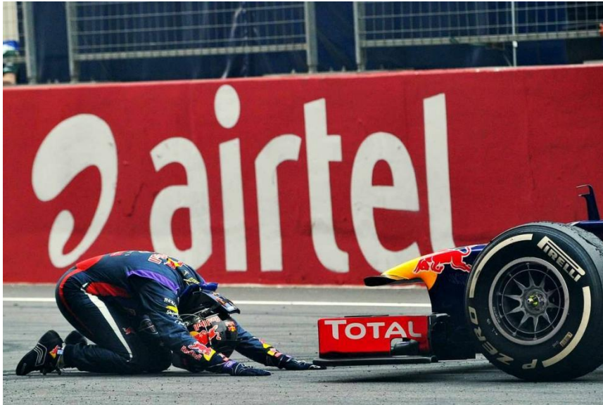
Slika 5. Sebastian Vettel se klanja svojem pobjedničkom RB9 bolidu 2013. godine.