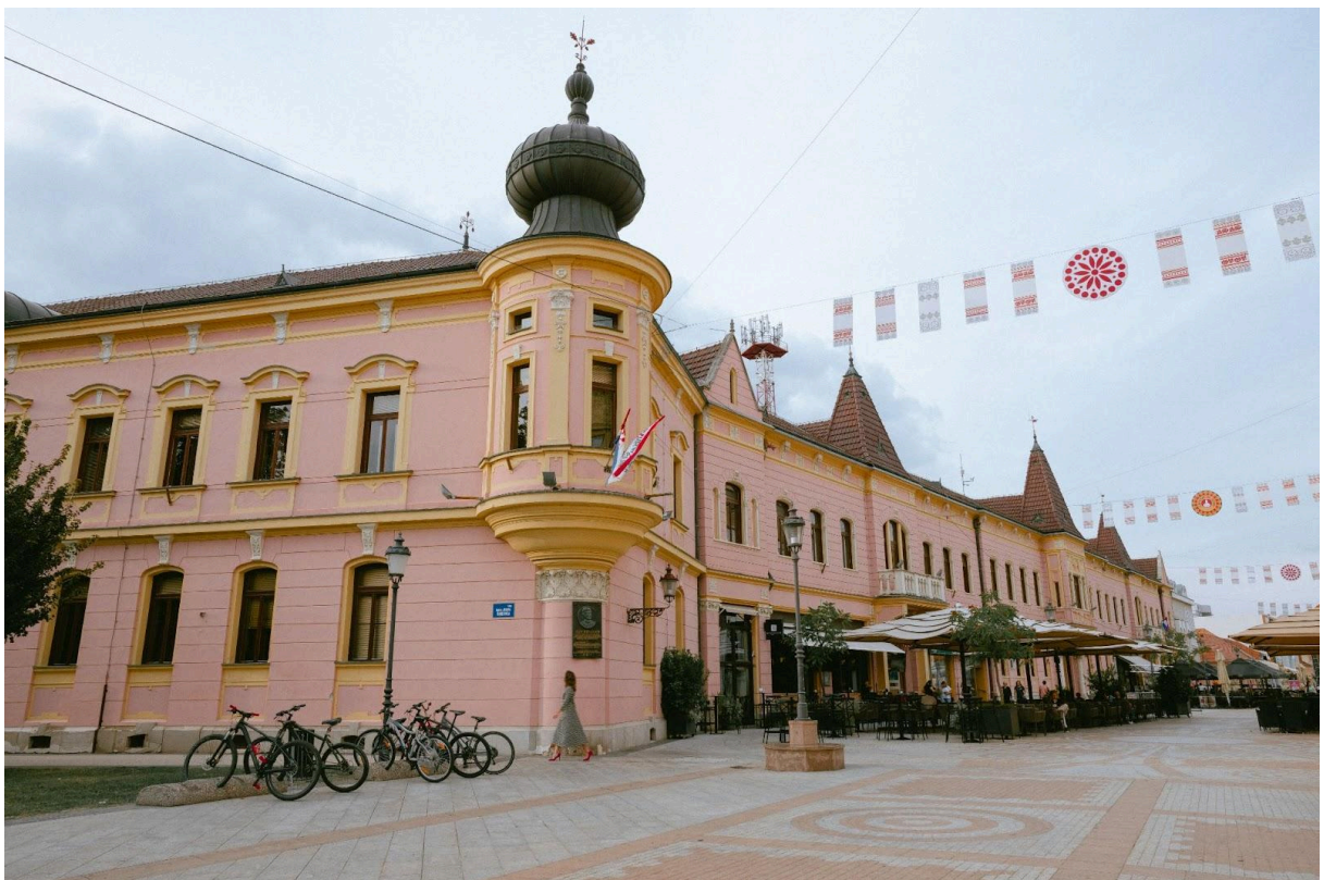
Slika 11. Brodska pukovnja, danas Hrvatske šume