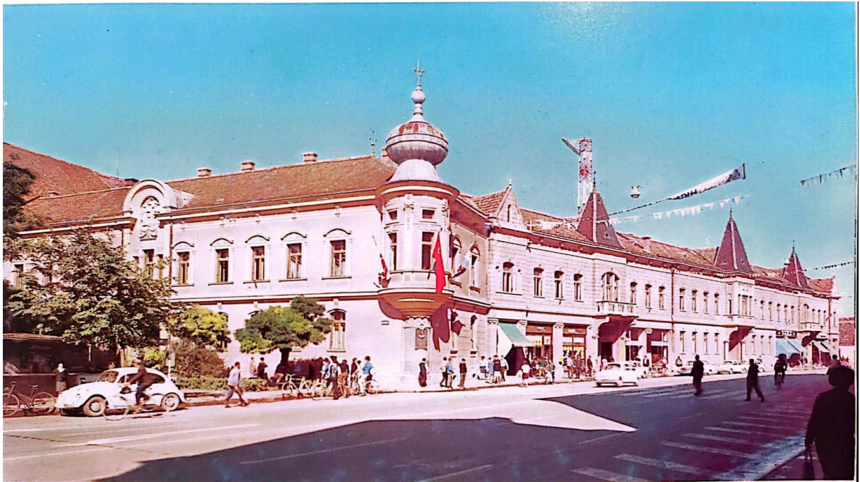
Slika 10. Brodska pukovnja