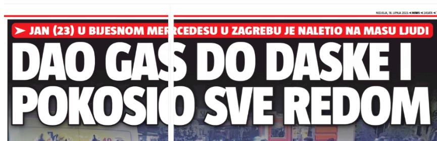
Slika 17. Naslov iz novina 24sata

„Dao gas do daske i pokosio sve redom“ naslov je objavljen 18. lipnja 2023. godine u tiskanom izdanju 24sata .