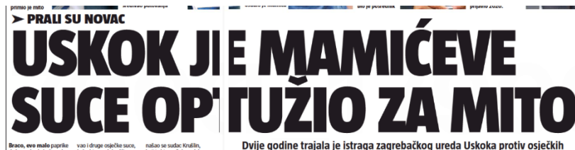
Slika 6. Naslov iz novina 24sata

Ovaj primjer pokazuje kako naslov na portalu je detaljniji s više informacija te, prema Siliću, pripada informativnoj kategoriji naslova.