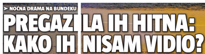
Slika 22. Naslov iz novina 24sata

Naslov u novinama 24sata zauzeo je gotovo pola stranice, dok je na internetu proširen te samim time otkiva više informacija. Različiti naslovi nalaze se na portalu i novinama Jutarnji list . „Svjedokinja: Vikala sam 'U rikverc! Idete na djecu!“, naslov je u novinama.