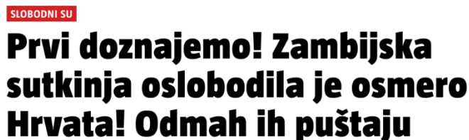
Slika 2. Naslov s portala 24sata

Glava tema 2. lipnja 2023. godine bila je o posvojiteljima iz Zambije u tiskanom izdanju 24sata , a članak je objavljen uz nominativni naslov „Oslobodeni“, kao što je vidljivo na slici 1.; dok na internetskom portalu naslov za isti sadržaj je nešto detaljniji i glasi „Prvi doznajemo! Zambijska sutkinja oslobodila je osmero Hrvata! Odmah ih puštaju“, kao što je vidljivo na slici 2.