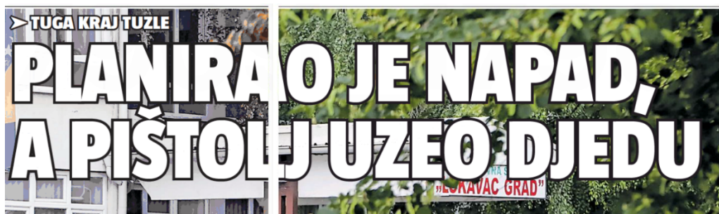
Slika 13. Naslov iz novina 24sata

Oba tiskana izdanja objavila su sadržaj uz fotografije s mjesta nesreće, dok se na ovim primjerima vidi sasvim različit pristup sadržaju, točnije objavi naslova.