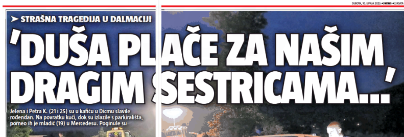
Slika 9. Naslov iz novina 24sata

Tragedija u kojoj su dvije sestre poginule tijekom rođendanskog slavlja u tiskanom izdanju 24sata dana 10. lipnja 2023. godine ima naslov „Duša plače za našim dragim sestricama...“. Za naslov je korištena izjava, no sam po sebi, naslov je nejasan bez ostale opreme.