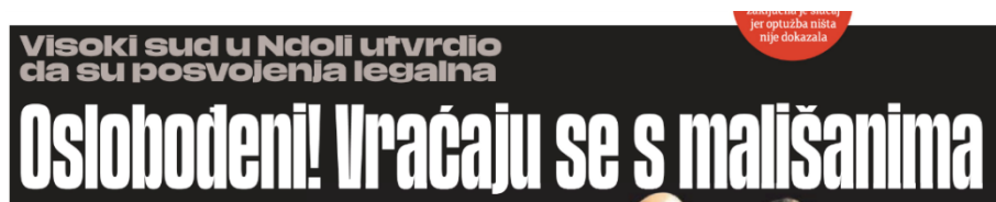
Slika 4. Naslov iz novina Jutarnji list

Naslovi u tiskanim izdanjima 24sata i Jutarnji list kratki su i bez puno informacija, a na portalima su detaljniji i jasniji. Zaključno, na primjeru ovih naslova oba portala i dnevna lista imaju sličan pristup sadržaju i kreiranju naslova.