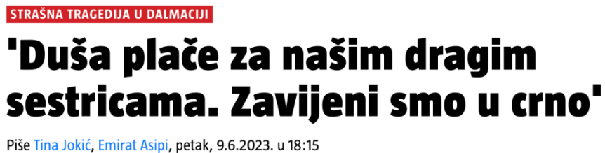
Slika 10. Naslov s portala 24sata

Tragedija u kojoj su dvije sestre poginule tijekom rođendanskog slavlja u tiskanom izdanju 24sata dana 10. lipnja 2023. godine ima naslov „Duša plače za našim dragim sestricama...“. Za naslov je korištena izjava, no sam po sebi, naslov je nejasan bez ostale opreme.