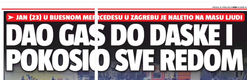
Slika 17. Naslov iz novina 24sata

„Dao gas do daske i pokosio sve redom“ naslov je objavljen 18. lipnja 2023. godine u tiskanom izdanju 24sata .