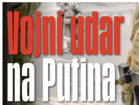
Slika 27. Naslov iz novina Jutarnji list

Na primjeru tiskanih izdanja naslovi su kratki te je fotografija zauzela najveći dio stranice. Naslovi na konkurentskim portalima su clickbait .