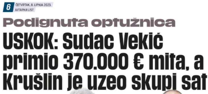
Slika 7. Naslov iz novina Jutarnji list

Naslov toga dana u Jutarnjem listu za sadržaj iste tematike glasi „USKOK: Sudac Vekić primio 370.000€ mita, a Krušlin uzeo skupi sat“, a na portalu naslov „USKOK podigao optužnicu protiv Mamića i osječkih sudaca: ‘Podmićivao ih je satovima, novcem, putovanjima‘“.