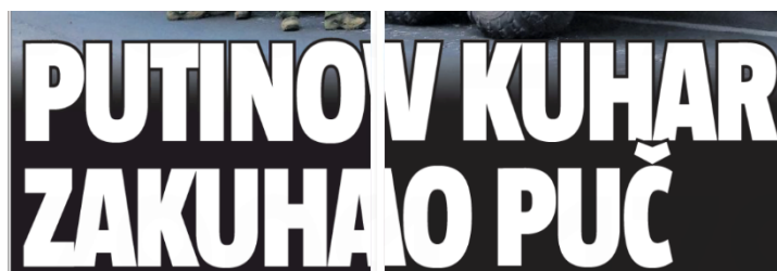
Slika 25. Naslov iz novina 24sata

Nominativan naslov „Putinov kuhar zakuhao puč“ stoji u novinama 24sata 25. lipnja 2023. godine.