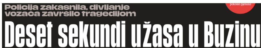
Slika 19. Naslov iz novina Jutarnji list

Naslovom na internetu nakladnik želi postići ekskluzivnost naslova kako bi imao veću „klikanost“. Uspoređujući naslove konkurentskih medijskih kuća, u tiskanom izdanju i internetskom izdanju, zaključuje se kako kod ovakvog sadržaja imaju sličan pristup kreiranju naslova, kratak, bombastičan i clickbait .