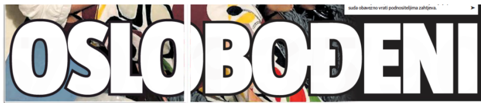
Slika 1. Naslov iz novina 24sata

Nekoliko novinskih članaka u 30-dnevnom razdoblju bilo je istoga dana na naslovnoj stranici tiskanog izdanja 24sata i Jutarnji list te na internetskim portalima. Neke teme ponavljale su se i više puta. Radi se o nacionalnim temama koje su imale velik javni interes te su dominirale u medijskom prostoru. Teme koje su se ponavljale i usporedive su: slučaj posvajanja u Zambiji, prometna nesreća u kojoj su poginule dvije sestre, srušen vojni helikopter, vojni udar na ruskog predsjednika Vladimira Putina, veliki nosač aviona u Splitu te vozač hitne pomoći koji je pregazio ljude u Zagrebu.