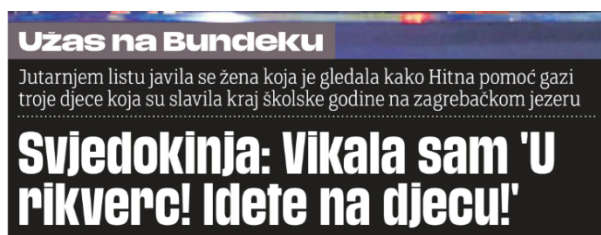
Slika 23. Naslov iz novina Jutarnji list

Naslov u novinama 24sata zauzeo je gotovo pola stranice, dok je na internetu proširen te samim time otkiva više informacija. Različiti naslovi nalaze se na portalu i novinama Jutarnji list . „Svjedokinja: Vikala sam 'U rikverc! Idete na djecu!“, naslov je u novinama.