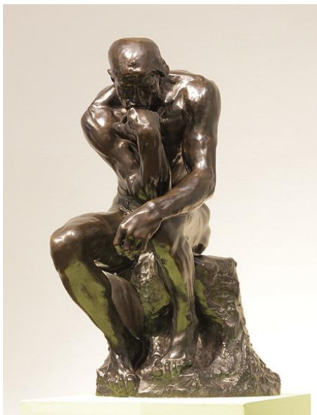
Slika 10. – Auguste Rodin, Mislilac , 1881.-1882., bronca

Pritom primjećuje da simbolika procesa razmišljanja koji želi prikazati, te sjedeća poza u kojoj se često nalazi, podsjećaju na poznatu skulpturu A. Rodina, Mislilac što nije bilo planirano, ali je na kraju stvorilo dodatnu simboliku s temom rada (Slika 10).