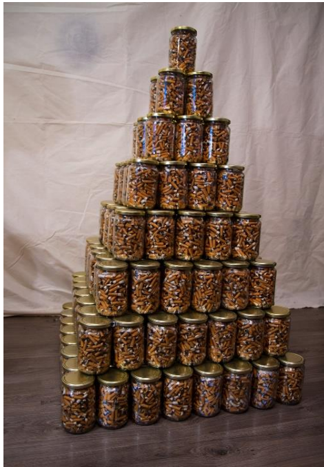
Slika 18. – Detalj završenog rada – staklenke s čikovima, 2024.

njima se lako manipulira, a osim toga su i modularne, tj. mogu se slagati u različite oblike (Slika 18).