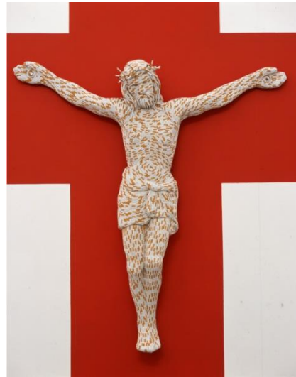
Slika 12. – Sarah Lucas, Christ You Know It Ain't Easy , 2003., stakloplastika i cigarete

Uz cigarete se najčešće vežu one ozbiljnije konotacije poput njihovog utjecaja na zdravlje i okoliš. U tom smislu čikovi predstavljaju smrt, smeće, smrad i prljavštinu, nešto što je izrazito nepoželjno u ljudskom umu. Proces pušenja također možemo metaforički usporediti sa životom i kroz njegovu kvalitetu i kvantitetu. Dok neki aktivno uživaju u svakom dimu, drugima većina cigarete izgori u pepeljari. Neki ih puše bez prestanka, a drugi tek nekoliko u prigodama. Autor ostale metaforičke interpretacije čikova i pušenja prepušta promatračima koji su u životu na razne načine dolazili u interakciju s njima.