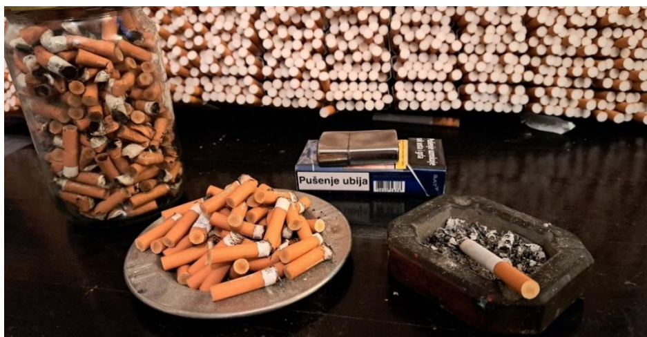
Slika 9. – Ideja za rad – sakupljanje čikova, 2024., autorska fotografija

Nastankom ideje trebalo je odabrati i osmisliti formu tj. izgled djela. Nakon dugog razmišljanja i razmatranja raznih opcija, rješenje se zapravo pojavilo samo od sebe, poput trenutka spoznaje! Radi se o sjedećoj pozi u kojoj autor inače provodi većinu dana, dok je za računalom, slika, pije kavu ili radi druge stvari, pri čemu cijelo vrijeme puši. Pokraj sebe uvijek ima malu drvenu pepeljaru koju je autorov djed stolar izradio prije više od 70 godina. Zbog veličine pepeljare, pokraj nje se uvijek nalazi i jedna veća u koju premješta čikove kada se mala napuni. Autor ih ne baca u smeće zbog mogućnosti požara, a s vremenom se i veća pepeljara napuni do vrha. Zbog neugodnog mirisa autor ih je s vremenom počeo stavljati u staklenku sa zatvaračem (Slika 9).