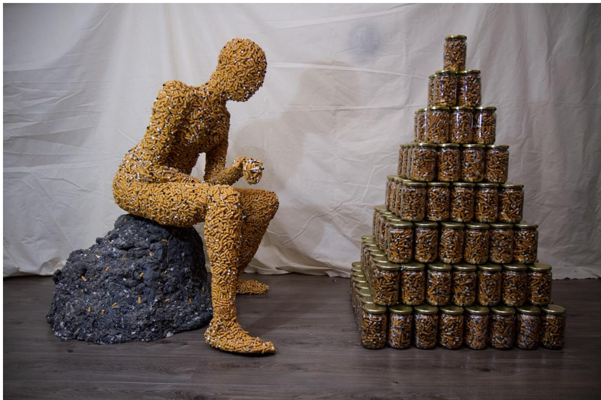
Slika 21. – Završeni rad, 2024.