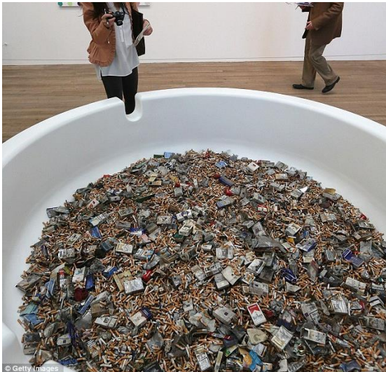
Slika 11. – Damien Hirst, Crematorium , 1996., različiti materijali

Cigarete se sastoje od duhana i filtera čvrsto omotanih papirom, pri čemu su papir i filter izrađeni od prerađene celuloze. Celuloza se u suvremenoj umjetnosti u raznim oblicima često koristi kao materijal za izradu umjetničkih djela, a cigarete i čikovi su privukle pažnju i nekim poznatim umjetnicima poput Damiena Hirsta i Sarah Lucas, (Slike 11, 12)