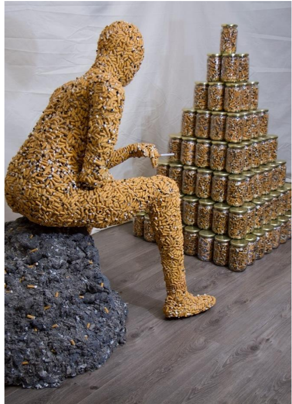
Slika 20. – Završeni rad, 2024.