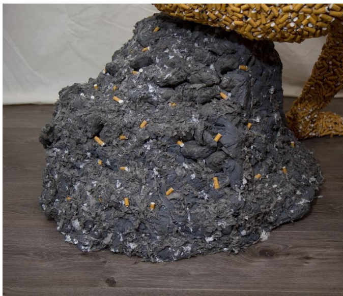
Slika 17. - Postupak izrade rada – Izrada postolja, 2024.

Izrada postolja bila je nužna jer ono služi kao potpora statui. Iako je autor za tu svrhu razmišljao o upotrebi neke druge forme, u obliku stolice, taburea i sl., za izbor prikazane forme odlučuje se zbog ranije opisane simbolike. Ona se, iz istih razloga kao i statua, nije mogla izraditi od pravog pepela, te ju autor također izrađuje zamjenskim netradicionalnim materijalom, tj. kartonom i papirom koji su kao i konstrukcija oblikovani i lijepljeni navedenim Drvofixsom . Radi postizanja što veće autentičnosti s pravim pepelom, autor cijelu formu boja sivom akrilnom bojom, te na svježe obojanu površinu dodaje sivi papir usitnjen kuhinjskom električnom sjeckalicom (Slika 17).