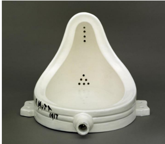
Slika 2. – Primjer ready-made rada, Marcel Duchamp, Fountain , 1917., ready-made

Među poznatijim umjetnicima koji su slijedili njegov primjer možemo navesti: Pabla Picassa (Slika 3), Mana Raya, Piera Manzonia, Andya Warhola (Slika 4), pripadnike raznih umjetničkih skupina poput The Young British Artists, ruske konstruktiviste, kao i brojne druge.