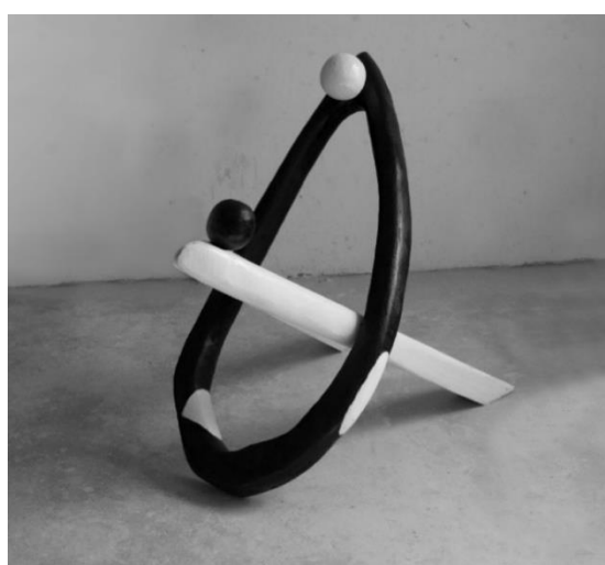
Slika 6. – Primjer stilizacije ljudskog lika, Šime Zupčić, Ples , 2023., drvo

Njegov prikaz manifestira se i kroz različite uloge koje je on u određenim periodima imao, pri čemu se one generalno mogu podijeliti na razne dokumentarističke prikaze i na one pomoću kojih se iznose i naglašavaju određene ideje i koncepti. U oba slučaja autor smatra da je umjetnost većim dijelom svoje povijesti bila ograničena, kako u duhovnom smislu (kroz univerzalne tematike i sl.), tako i kroz navedeno pomanjkanje tehnoloških znanja, sirovina i materijala. Čovjek je time dugo vremena prikazivan unutar zadanih normi koje možemo pratiti kroz prihvaćanje nekih općih ideja (pretila žena kao znak plodnosti, bog kao bradati starac, atletski građani heroji i sl.), ili kroz poštivanje zadanih pravila i načela (proporcije i perspektiva