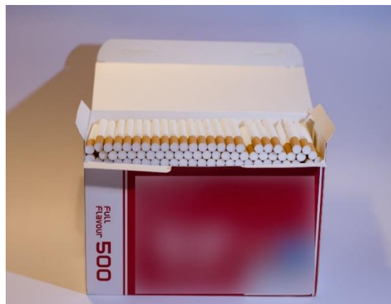
Slika 14. – Postupak izrade rada – kupovni filteri, 2024.

S obzirom da pravi čikovi i cigarete zbog svog intenzivnog i neugodnog mirisa, kao i prisutnosti organskog dijela u obliku duhana, nisu bili pogodni za njezinu izradu, autor se koristio zamjenom u obliku gotovih filtera koji su dostupni kao gotov proizvod (Slika 14). Zbog njihove pogodnosti za modeliranje koja seže samo do određene mjere, statua je stilizirana bez naglašenih detalja.