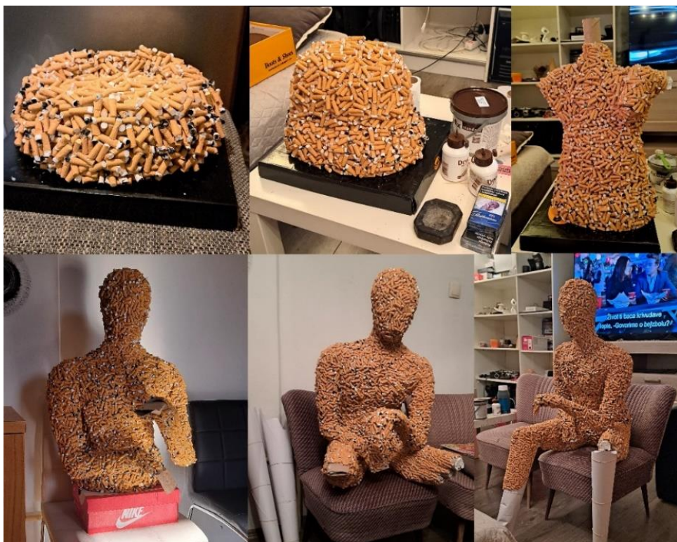
Slika 16. - Postupak izrade rada – izrada konstrukcije, 2024.

Radi dodatne uštede vremena izrade i potrebne količine filtera, autor se odlučuje da unutrašnjost skulpture ispuni papirom, tj. prerađenom celulozom u obliku konstrukcije. Na to utječu njezina mala težina, podatnost modeliranja, te mogućnost spajanja u veću cjelinu pomoću ljepila. Konstrukcijom se popunjava i ugrubo oblikuje volumen te postiže željena i stabilna forma na koju autor zatim lijepi slojeve filtera (Slika 16).