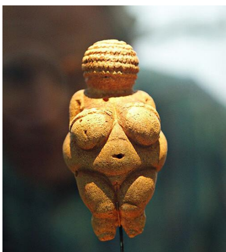
Slika 5. – Primjer stilizacije ljudskog lika, Willendorfska Venera , 25 000 pr.Kr., kamen

Ljudski lik, odnosno figura se još od prapovijesti pojavljuje kao dominantna tema preokupacije ljudskog uma te ga kao motiv nalazimo već na prvim spiljskim crtežima i pronađenim figurinama. Ljudi konstantno promišljaju i percipiraju sami sebe i druge oko sebe, pozicionirajući se u svijet koji ih okružuje. Ta percepcija se najeksplicitnije izražava kroz umjetnost i filozofiju, čija se uska povezanost može definirati kroz reprezentaciju određenih ideja putem konkretnog umjetničkog izričaja. Zbog toga se prikaz ljudskog lika kroz povijest mijenjao sukladno promjenama kroz koje je čovjek prolazio, a očitovao se na brojne i različite načine. 10 Pri tome pratimo njegov put od stilizacije, realizma, idealizma, naturalizma pa sve do ponovne stilizacije, apstrahiranja i potpune apstrakcije (Slike 5, 6).