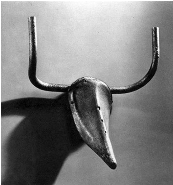
Slika 3. – Pablo Picasso, Bulls head , 1942., bronca

Među poznatijim umjetnicima koji su slijedili njegov primjer možemo navesti: Pabla Picassa (Slika 3), Mana Raya, Piera Manzonia, Andya Warhola (Slika 4), pripadnike raznih umjetničkih skupina poput The Young British Artists, ruske konstruktiviste, kao i brojne druge.