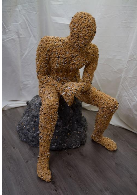
Slika 13. – Detalj završenog rada – statua, 2024.

gleda. Riječ je o sjedećoj ljudskoj figuri u prirodnoj veličini, blago nagnutoj prema naprijed. Noge su joj raširene pri čemu se desna nalazi u blagom kontrapostu. Navedena poza, cigareta u ruci i zamišljeni pogled sugeriraju da je u tijeku proces intenzivnog razmišljanja koji čini jedan od osnovnih motiva cijelog djela (Slika13).