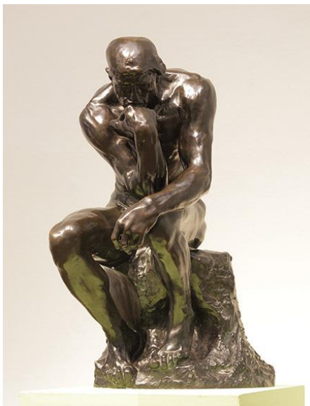
Slika 10. – Auguste Rodin, Mislilac , 1881.-1882., bronca

Pritom primjećuje da simbolika procesa razmišljanja koji želi prikazati, te sjedeća poza u kojoj se često nalazi, podsjećaju na poznatu skulpturu A. Rodina, Mislilac što nije bilo planirano, ali je na kraju stvorilo dodatnu simboliku s temom rada (Slika 10).