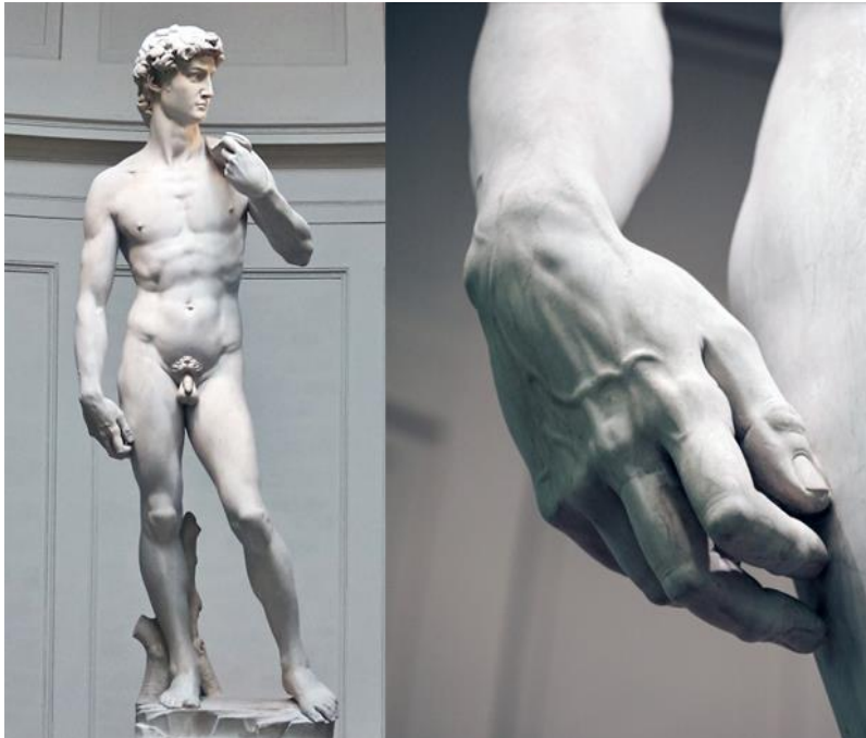
Slika 1. – Primjer skulpture izrađene u mramoru, Michelangelo, David , 1501.-1504., mramor

Kamen je prirodni materijal koji se sastoji od jednog ili više različitih minerala. Njegov sastav i podrijetlo određuju svojstva poput: tvrdoće, lomljivosti, poroznosti, otpornosti na razne utjecaje i sl.. Prema podrijetlu nastanka razlikujemo kamenje: vulkanskog, sedimentnoga i metamorfnoga podrijetla, a među najpoznatije vrste spadaju: mramor, vapnenac, granit, kvarc, bazalt, pješčenjak, škriljevac i dr. 2 U kiparstvu se kroz povijest najviše koristio i cijenio plemeniti mramor, vrsta vapnenca s određenim primjesama, od kojega su izrađena brojna remek djela svjetske umjetnosti (Slika 1).