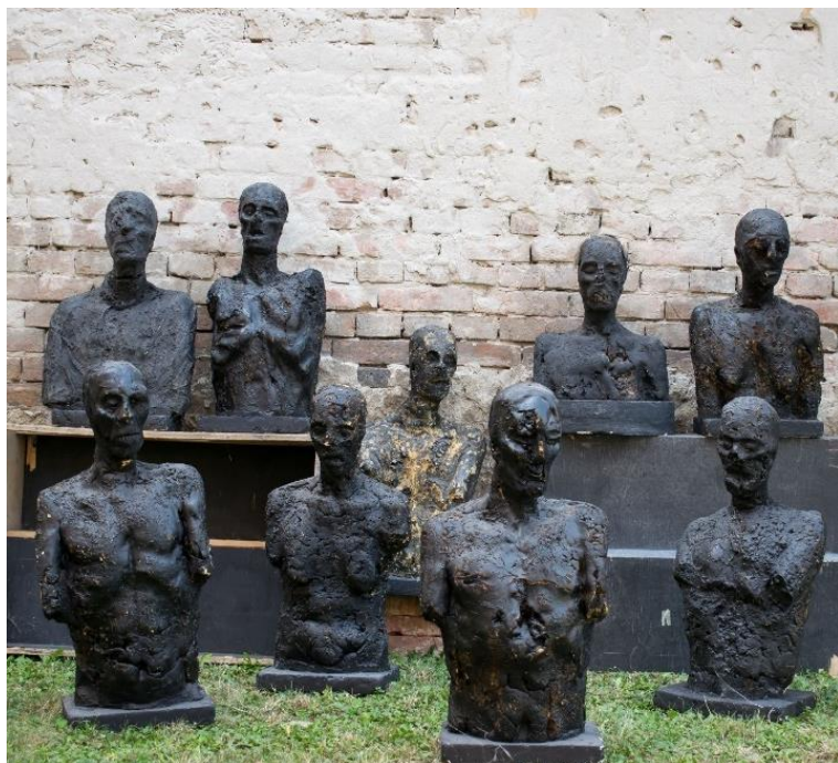
Slika 7. – Stjepan Gračan, Biste , 2002., poliuretan, boja

Od raznih djela koje ovdje nalazimo, za primjer možemo izdvojiti radove osječkog kipara Stjepana Gračana, koji je za izradu svojih klasičnih javnih skulptura (August Cesarec – Šetač, Marija Jurić Zagorka, Kumica Barica i dr.) koristio broncu kao tradicionalni materijal, dok je za svoja ostala puno intimnija i ekspresivnija djela često koristio nove materijale kao što su poliester i poliuretansku pjenu pomoću kojih je zorno dočarao sva izobličenja, izmrcvarenost, tjeskobu i traumu modernog čovjeka i njegove zbilje 12 (Slike 7, 8).