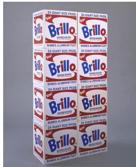
Slika 4. – Andy Warhol, Brillo boxes , 1964., polivinilni acetat i sitotisak na drvu

Ono što primjećujemo kod korištenja takvih medija jest da za to više nije nužno potrebna posebna zanatska vještina obrade kao kod tradicionalnih materijala, a koja se kroz povijest sustavno razvijala i cijenila. Umjetnost se na osnovu toga približava širem broju ljudi te dolazi i do znatnog povećanja broja umjetnika koji se žele izraziti na različite načine.