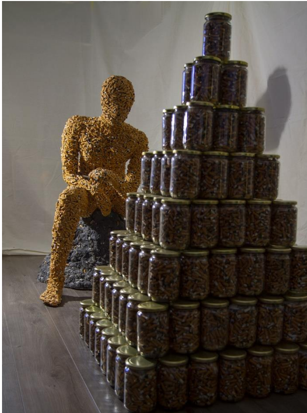
Slika 19. – Završeni rad, 2024.