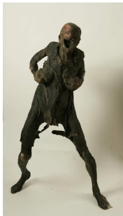
Slika 8. – Stjepan Gračan, Bez naziva XXV , 1976., poliester, boja,