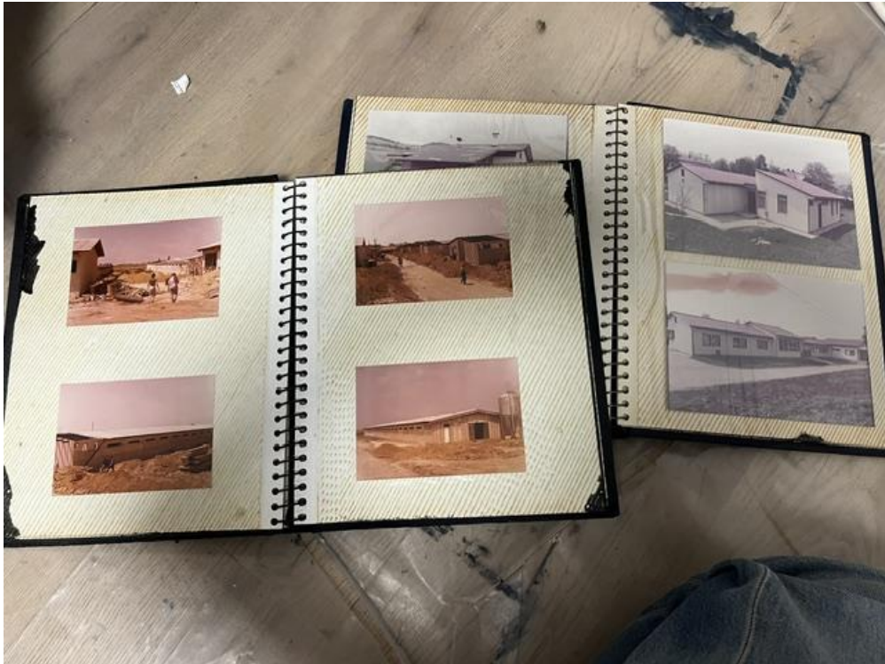
Fotografija fotografskih albuma korištenih za završni rad, Novi Sad, 2023.