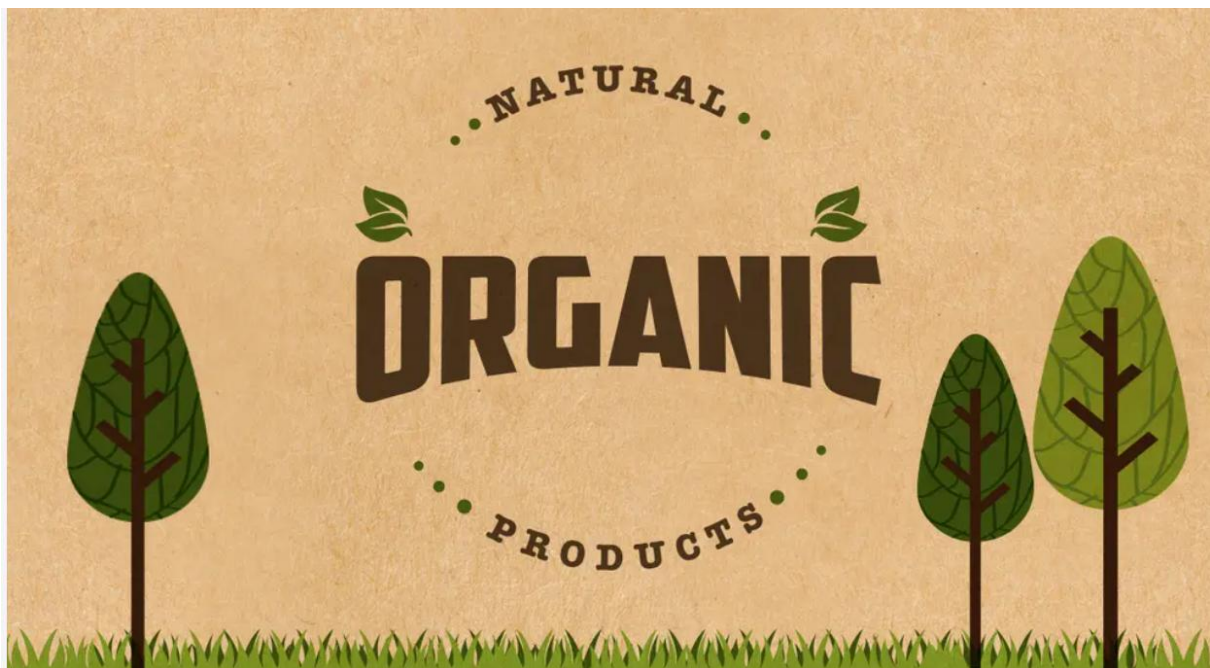
Slika 2: Organski proizvod - Što jamči da su stvarno takvi?

usmjeravaju na društveno odgovorno poslovanje ili na primjenu etike u marketingu. Poduzeće za analizu društvene odgovornosti mora skupiti popis svih područja koja se mogu aktivno uključiti i doprinijeti poboljšanju kvalitete društvene okoline. Odgovorno ponašanje predstavlja brigu za ekonomsku dobrobit najugroženijih u koje se ubraja i nezaposleno stanovništvo. Kvaliteta života ljudi poboljšat će se ostvarivanjem većeg zapošljavanja i otvaranjem novih radnih mjesta. Prilikom zapošljavanja prednost treba biti usmjerena na iskusnim radnicima dok nezaposlenim radnicima treba osigurati lakša radna mjesta. Bio ili eko proizvodi smiju imati oznaku na sebi da su takvi sako ako imaju najmanje 94% sastojaka koji su poljoprivrednog podrijetla uzgojeni prema pravilima ekološke proizvodnje bez pesticida te takav proizvod ima certifikat dodijeljen od ovlaštenog tijela na temelju inspekcijskog nadzora (Cvitanović, 2018:209)