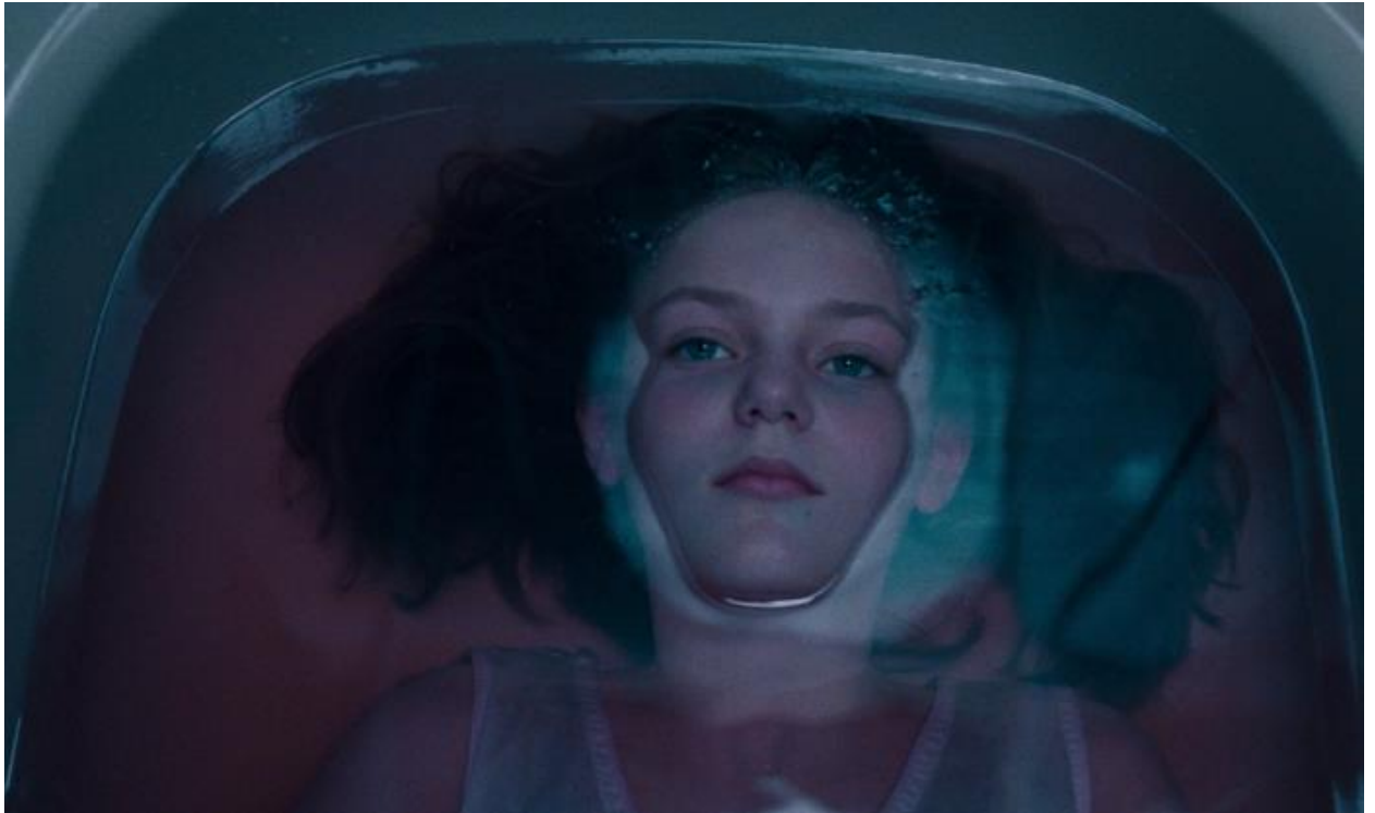
Slika 9 „Cecilia was the first to go.“ Nevina Samoubojstva , Sofia Coppola, 1999.

Kao što je već spomenuto, religija je velik pokretač radnje romana i filma stoga su oba djela puna raznih religioznih simbola koji istovremeno predstavljaju konzervativne ideale, ali i ideale mladenačkog otpora. Priču je obilježio križ o koji je obješen grudnjak. On se spominje i u romanu (Eugenides, 1993: 7) i u promidžbenim fotografijama za film.