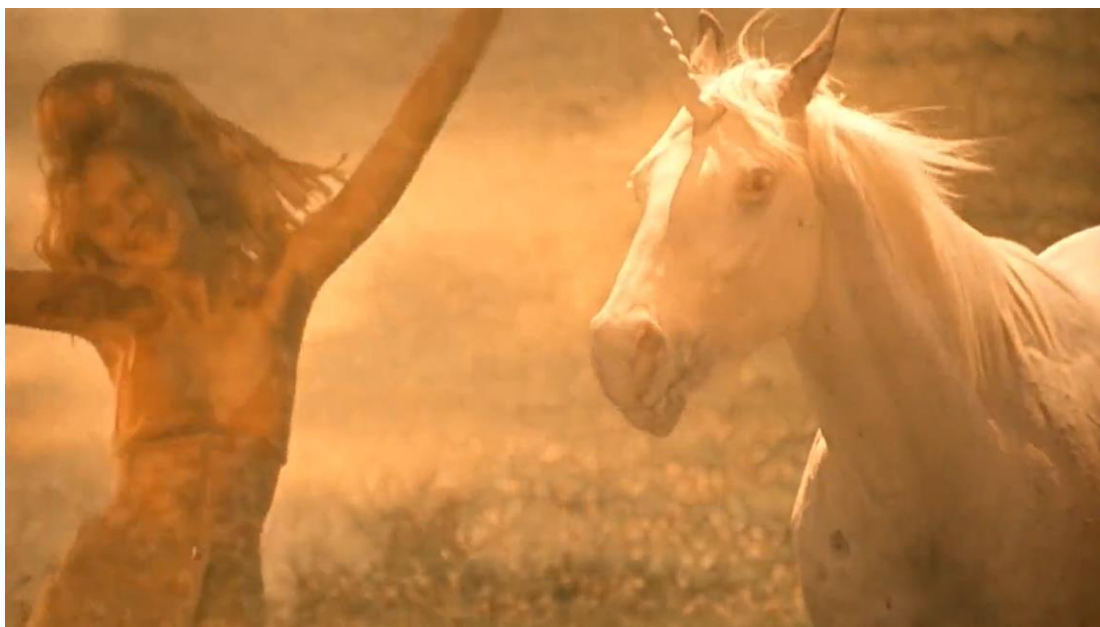
Slika 1 „We felt the imprisonment of being a girl.“ Nevina samoubojstva , Sofia Coppola, 1999.

Na primjer muškog pogleda nailazimo već na samom početku romana: "...lica su im izgledala kao da su nepristojno otkrivena, kao da smo navikli gledati žene s velom preko lica." (Eugenides, 1993: 5) Djevojke su postavljene na tron nedodirljivosti i s tog istog su protjerane. One nisu uistinu „nepristojno otkrivene“, već su mistificirane i predstavljene kao objekt žudnje, a sve se to temelji samo na njihovom izgledu i kasnije tragediji koja ih prati. Kroz roman ne saznajemo ništa što bi nam otkrilo nešto dublje o njima kao osobama, a informacije koje su nam predstavljene niti su pouzdane niti su dovoljno detaljne da bismo upoznali djevojke. Ono što mi kao čitatelji saznajemo o njima saznajemo od nepouzdanog naratora koji je to što nam govori saznao iz nekog trećeg izvora ili su to pak njegove pretpostavke. Ipak, djevojke su predstavljene kroz empatiju i tugu što u čitateljima stvara dojam jače povezanosti s njima. Film djevojke mistificira kroz usporene montaže popraćene ambijentalnom elektroničnom glazbom. Djevojke su prikazane anđeoski, scenama obojenima jakim filterom, bosonoge, duge lepršave plave kose. (Coppola, 1999: 00:26:00)