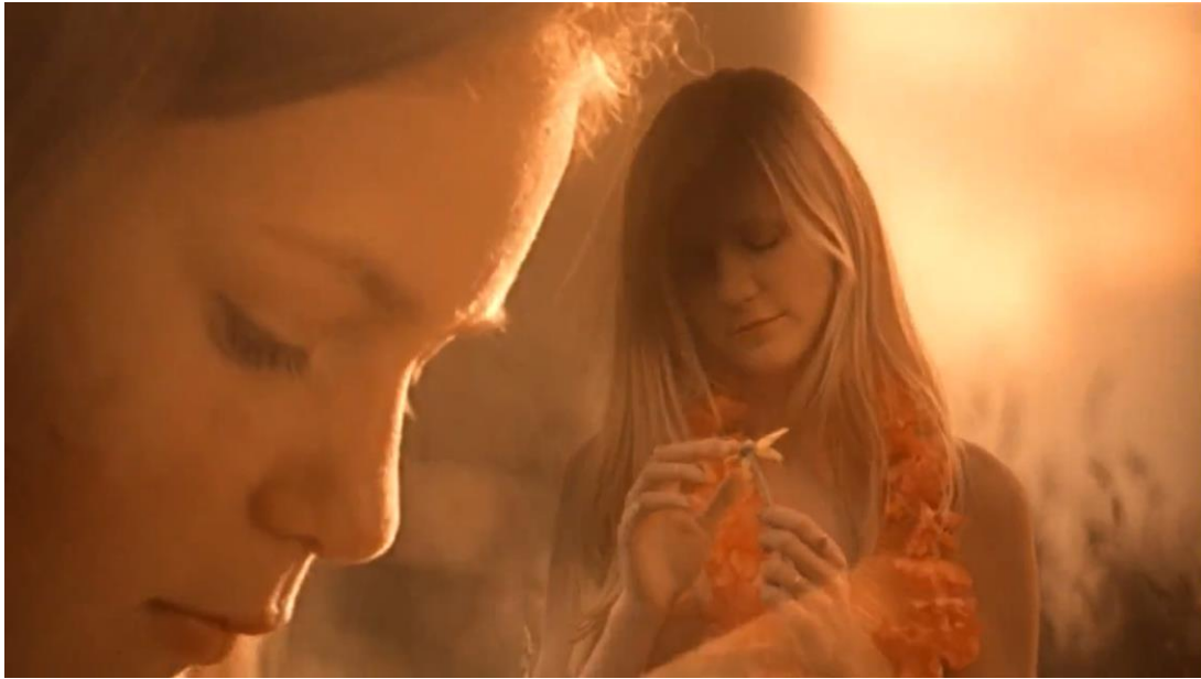
Slika 2 „We felt the imprisonment of being a girl.“ Nevina samoubojstva , Sofia Coppola, 1999.

Muški pogled fokusiran na predivne djevojke s tragičnom sudbinom glavni je pokretač radnje romana. Ipak, Eugenides se ne prepušta „muškom pogledu“ kao automatskom položaju stvaranja umjetnosti već preuzima kontrolu nad pogledom i otvara vrata brojnim diskusijama o odnosu naratora i djevojaka, ali ponajprije o odnosu naratora i čitatelja, a potom i čitatelja i djevojaka. Profesorica engleske književnosti Debra Shostak (2009: 808) navodi da su ju komentari kolega da je roman jednostavno i mizogino djelo naveli da analizira kako čitatelji reagiraju na naratorovu kontrolu nad perspektivom. Roman ne objektivizira djevojke u svrhu pukog užitka i dominacije nad bespomoćnim ženskim likovima već taj zadatak svjesno daje kolektivnom naratoru, a predajom te uloge grupi dječaka/muškaraca koji pripovijedaju kao jedan glas „muški pogled“ kroz koji narator predstavlja djevojke otvara vrata analizi odnosa čitatelja i njegovog slijepog vjerovanja naratoru. (Shostak, 2009: 808-809)