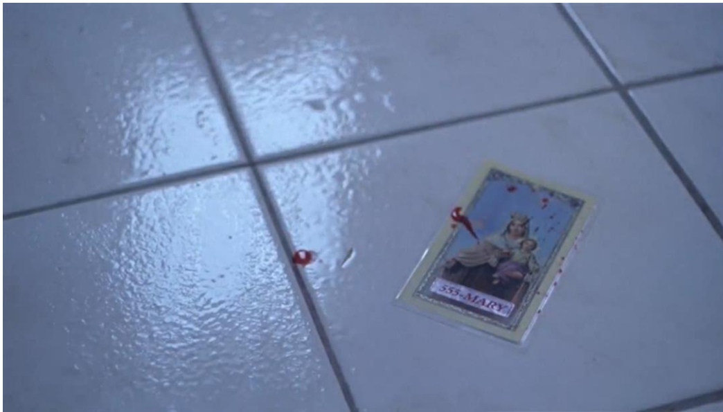
Slika 11 „Cecilia was the first to go“ Nevina samoubojstva , Sofia Coppola, 1999.

Kasnije te iste sličice Djevice Marije postaju sredstvo komunikacije djevojaka s dječacima. (Eugenides, 1993: 194) Radnja je stoga ciklična te laminirana fotografija postaje simbolom poziva u pomoć, ali i signalizira da sve sestre prati ista sudbina kao i najmlađu sestru. U filmu sličica Marije pada na pod kada po Ceciliju dolazi hitna pomoć i prekrivena je kapljicama krvi. (Coppola, 1993: 00:01:24) Na slici Marija drži Isusa kao bebu, a krv mlade djevojčice simbolizira žrtvu koja će kasnije sestrama predstavljati jedini izlaz, odnosno spasenje.