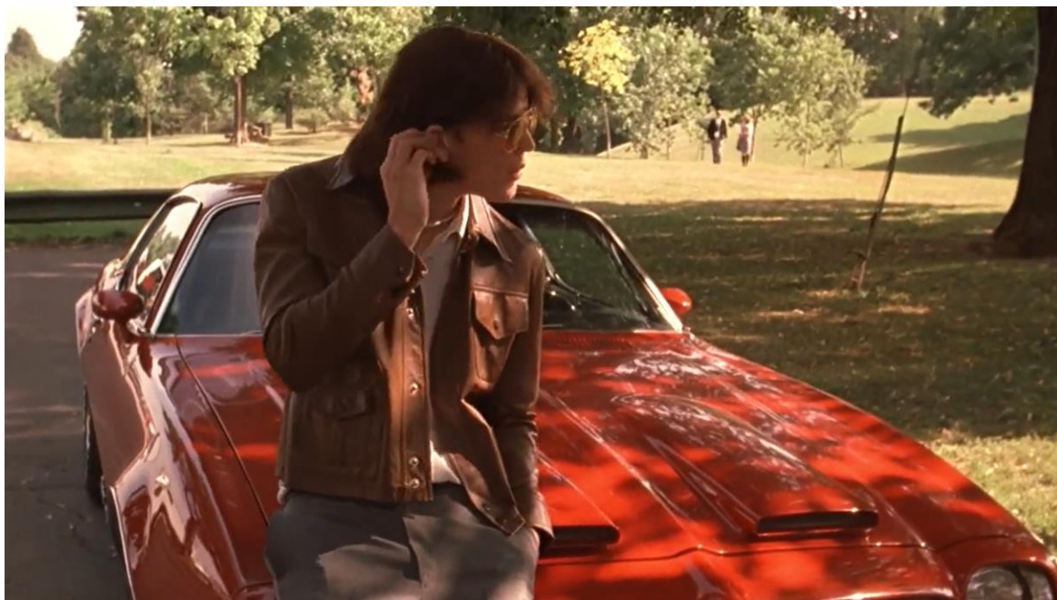
Slika 3 „Introducing Trip.“ Nevina samoubojstva , Sofia Coppola, 1999.

homoseksualna privlačnost, postaje alatom daljnje objektivizacije djevojaka, a ne njega. Trip predstavlja ostvarene želje pripovjedača čija žudnja ostaje neostvarena. (Shostak, 2013: 188-189)