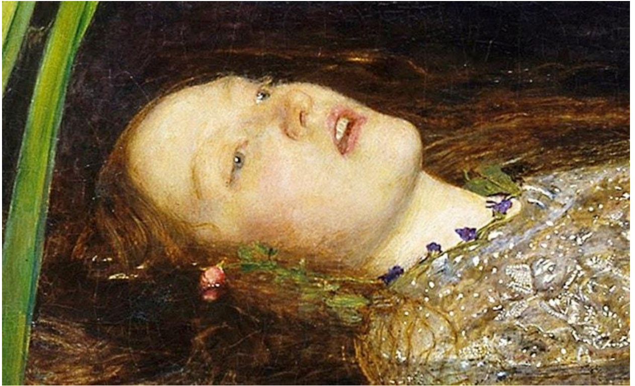
Slika 7 Ofelija detalj, John Everett Millais, 1853.