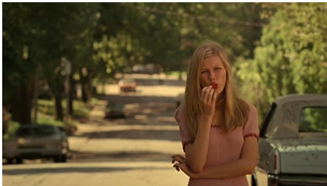
Slika 5 „Opening scene.“ Nevina samoubojstva , Sofia Coppola, 1999.

opsjednut Lolitom i koji ju naposljetku otima i siluje. Roman je postao klasikom i izuzetno je zanimljiv primjer nepouzdanog pripovjedača koji aktivno pokušava šarmirati čitatelja i obraniti svoje nehumane postupke.