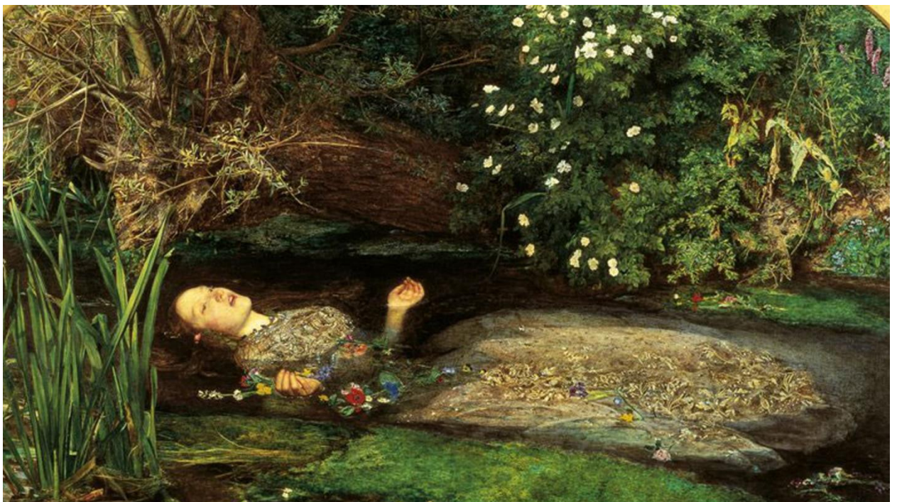
Slika 8 Ofelija , John Everett Millais, 1853.