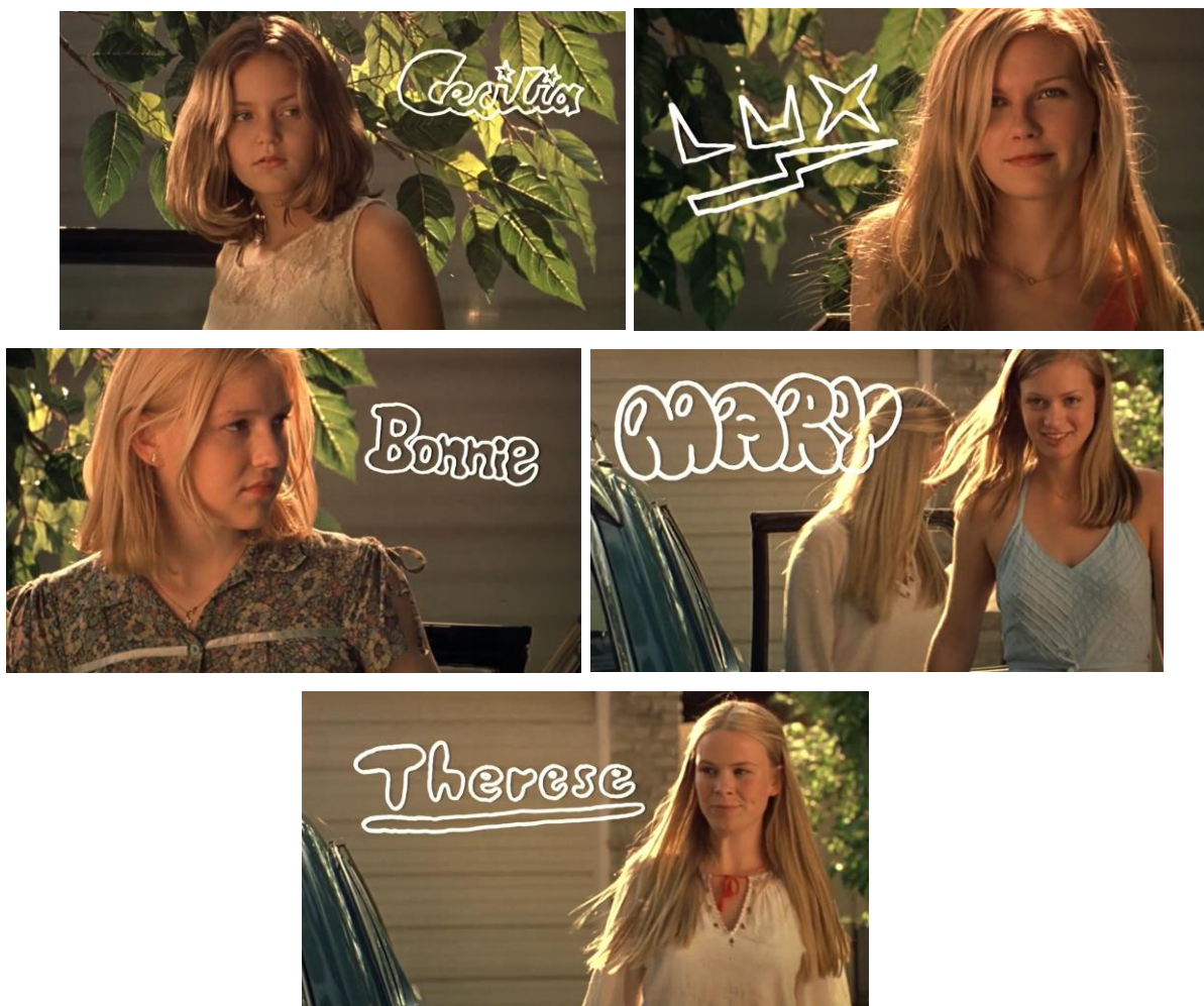
Slika 4 „Meeting the girls.“ Nevina samoubojstva , Sofia Coppola, 1999.

Coppola je mogla na zahtjeve romana odgovoriti eksperimentalnim metodama poput naracije više glasova odjednom ili da sestre u početku glumi ista glumica, ali to nije bio Coppolin cilj jer je njena fascinacija u romanu bila priča djevojaka koja je opčarala dječake, kao što sama navodi u svojoj knjizi. (Coppola, 2023: 11) Potpuna dosljednost romanu gotovo je nemoguća ili bi pak završni proizvod bio avangardni eksperimentalni film koji isključivo dočarava atmosferu, a ne priča priču.