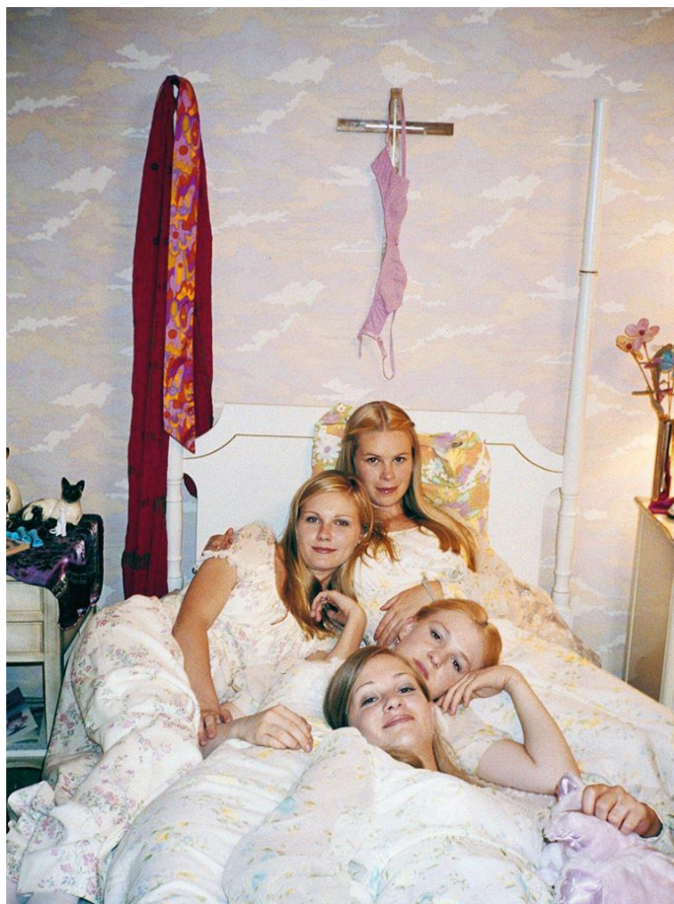
Slika 10 „Sestre Lisbon“ Sofia Coppola, 1998.

U sceni Cecilijina prvog pokušaja oduzimanja života i u romanu i u filmu Cecilija u ruci drži laminiranu fotografiju Djevice Marije za koju kasnije saznajemo da njeni roditelji ne podržavaju jer se na poleđini sličice propagira kult ukazanja Djevice Marije. Frustracija g. Lisbona s Cecilijinim vjerovanjem u ukazanja postaje ironična kada mu se jednu večer upravo ona ukaže. Vjerovanje u propagandni materijal nije jedini primjer Cecilijina bogohuljenja, među njezinim stvarima dječaci nalaze tarot karte, igračku s horoskopskim znakovima, a u dnevniku Cecilija spominje astrologiju. (Eugenides, 1993:37) Ovi interesi nisu neobični za djevojčice, ali su neobični za domaćinstvo strogih kršćanskih ideala. Nikada nije otkriveno je li Cecilija ikada bila kažnjavana zbog njenih interesa, a iz konteksta možemo iznijeti samo pretpostavke. Simbol Marije ponavlja se kroz cijelu priču, jedna se od sestri zove Mary, a i samo ime romana aludira na svetost nevinosti.