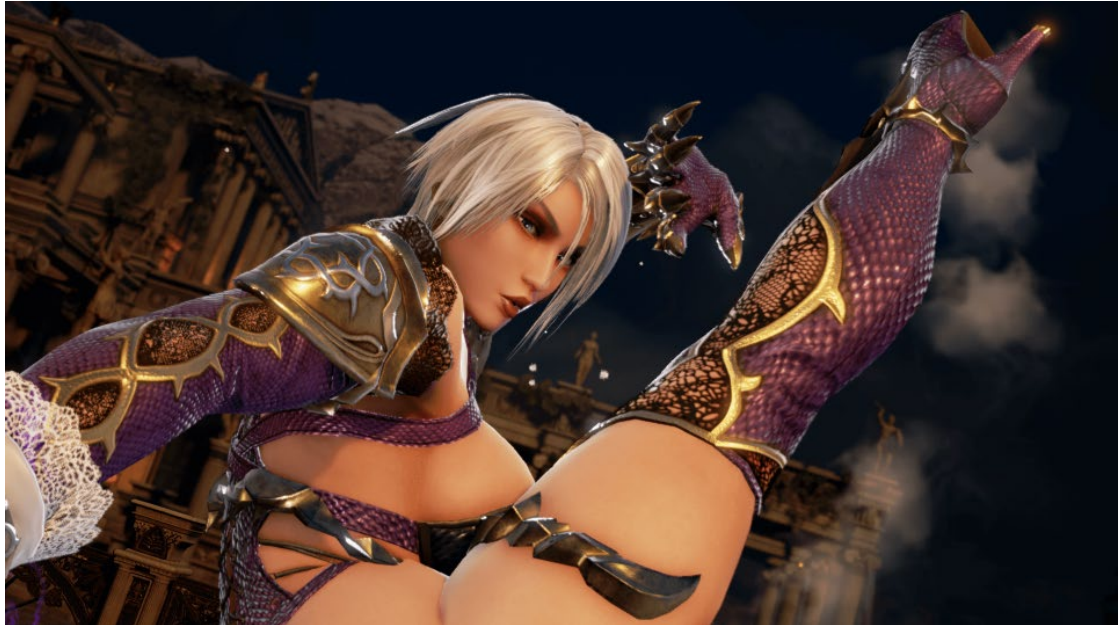
Slika 3 Ivy Valentine na snimci zaslona iz igre Soul Calibur 6, 2018., kotakuinternational, https://www.kotaku.com.au/2018/06/at-e3-soulcaliburs-objectified-women-felt-like-a-relic-of-the-past/