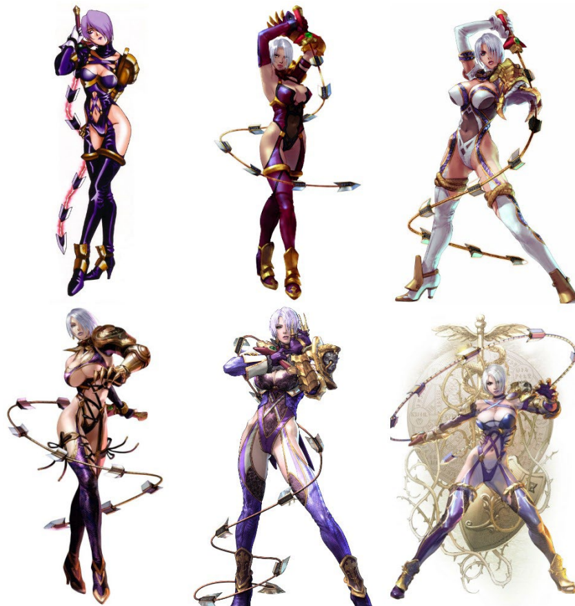
Slika 2 Kostimi Ivy Valentine kroz serijal Soul Calibur (1998. - 2018.)

Uz odjeću, ženski likovi u ovom serijalu često su stavljeni i animirani na takav način ne bi li se istaknula i naglasila njihova seksualnost. Ostali ženski likovi, kao što su Taki i Sophitia, također su prikazani s prenaplašenim atributima i proporcijama tijela, te su uz Ivy prikazane u sugestivnim pozama za vrijeme igranja i u unaprijed animiranim filmovima u igri kojima se potpomaže prenošenje priče. (vidi slike 3 i 4)