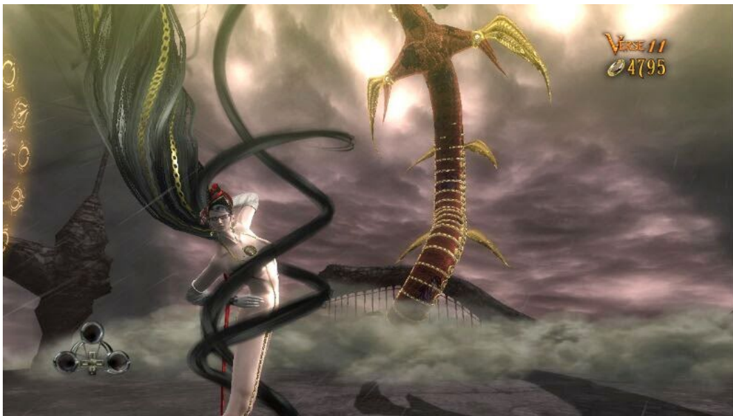
Slika 5 Bayonetta usred jednog od svojih napada, 2014., Lienhard S.

Iz ovakvih razloga perspektiva tima nije u potpunosti prihvaćena od strane kritičara i učenjaka. Oni i dalje ukazuju na to kako prikaz Bayonettina lika podupire štetne stereotipe i doprinosi širenju problema seksualizacije ženskih likova u videoigrama. Neki igrači i komentatori vjeruju da iako su Bayonettino samopouzdanje i snaga za pohvalu, način na koji je prikazana njezina seksualnost često potkopava te kvalitete dajući prednost vizualnoj privlačnosti nad dubinom lika i koherentnošću pripovijedanja.