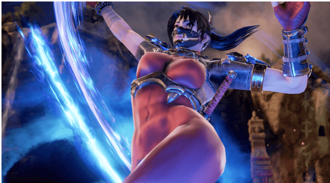
Slika 4 Taki na snimci zaslona iz igre Soul Calibur 6, 2018., kotakuinternational, https://www.kotaku.com.au/2018/06/at-e3-soulcaliburs-objectified-women-felt-like-a-relic-of-the-past/