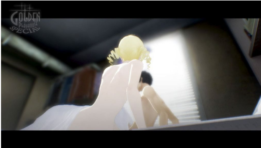
Slika 7 Primjer kuta snimanja koji koriste kreatori, 2020., ROG, https://realotakugamer.com/morality-infidelity-and-a-love-triangle-catherine-full-body-review/59478/

Nakon tog saznanja jasnije je zašto prikazuju njen lik na takav način. U igri postoje scene gdje njih dvoje razgovaraju u njegovoj sobi, obučeni ponekad samo u donje rublje ili čak ni to. U takvim scenama kreatori koriste okolinu i kutove snimanja kako bi prekrili pretjeranu ekspoziciju likova, kao što to rade redatelji u filmovima. (primjer na slici 7)