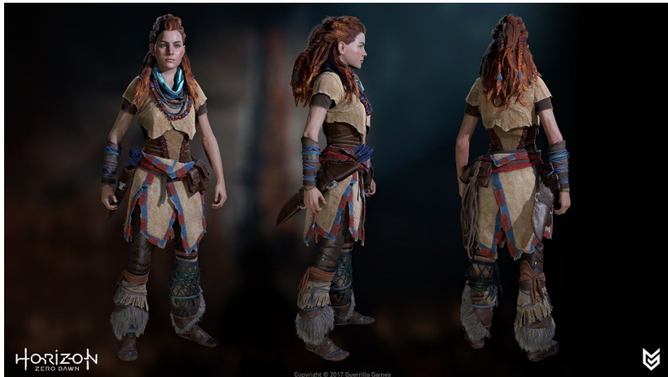
Slika 9 Aloy ingame model za igru Horizon Zero Dawn, Arno, 2017, ZBrushCentral, https://www.zbrushcentral.com/t/horizon-zero-dawn-art-dump/206487

Aloyin fizički izgled je ugodan oku, ona odgovara idealima ljepote koji se nalaze u drugim zapadnim masovnim medijima, ali ona nije objektivizirana i seksualizirana. Na primjer, njezina odjeća i oklop prilično su realistični i rijetko pokazuju njezino tijelo (Forni, 2020: 91). Beasley i Collins Standley tvrde kako je odjeća jedan od glavnih pokazatelja spolnih uloga u određenom društvu, što također vrijedi i u video igrama (2002: 283). Štoviše, Aloyin narativni luk usredotočen je na njezino djelovanje i autonomiju. Za razliku od mnogih ženskih likova koji su često definirani svojim odnosima s muškim likovima, njena priča vođena je njezinim vlastitim motivima, posebno njezinom potragom za identitetom i razumijevanjem svijeta. To je priča o prevladavanju nepovoljnih okolnosti, ne samo u smislu fizičkih izazova, već i onih društvenih. Prognana iz svog plemena, mora se kretati svijetom koji je često odbacuje ili podcjenjuje. Ipak, svojom ustrajnošću i vještinom, ona stječe poštovanje i priznanje, naposljetku postajući vođa i heroj. Ovaj narativ osnaživanja odjekuje i feminističkim idealima prevladavanja patrijarhalnih ograničenja i postizanja samospoznaje, čineći Aloy moćnim simbolom ženskog osnaživanja u videoigrama.