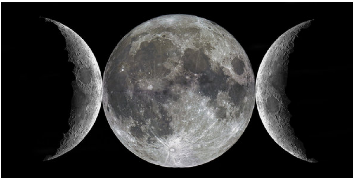
Slika 3. Simbol trostruke božice

Tri aspekta (djevojke, majke i žene) božice prikazuju se mjesecom u tri faze ciklusa.