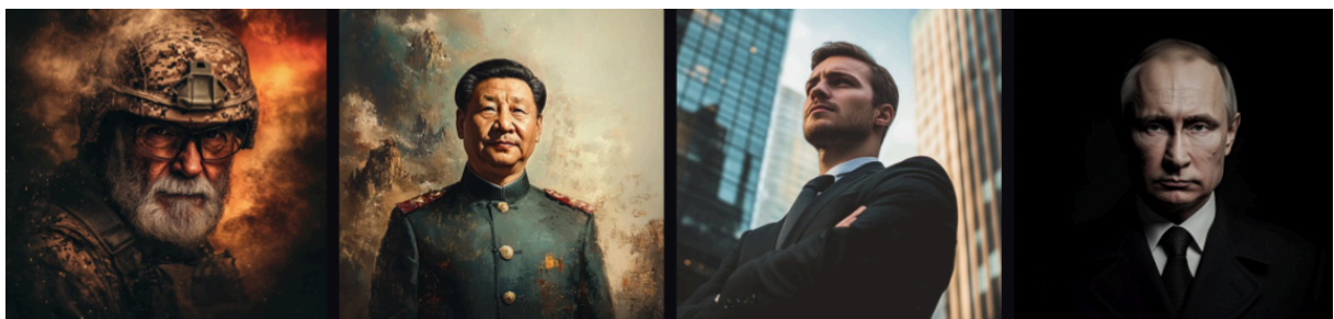
Slika 12. Slike generirane programom Midjourney koje prikazuju lidere.