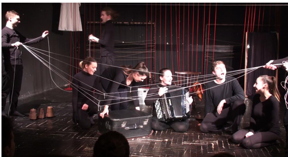
Slika 1: Slika iz predstave Pleti mi dušo, sevdah , promjena scene, pjesma Što je život