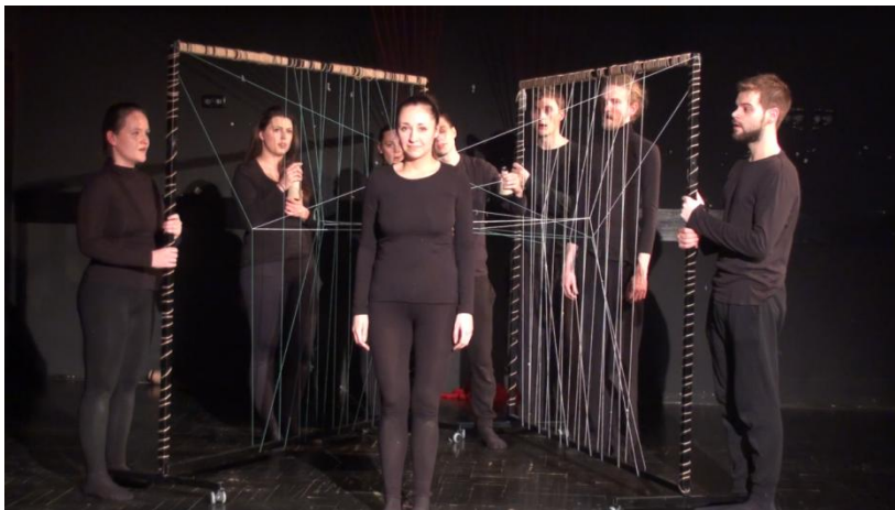
Slika 2: Slika iz predstave, scena Elma

Nakon toga, uz paljenje rasvjete, svi dolazimo do proscenija i stajemo pred publiku, kao posljednji kontakt zaokružujemo cjelinu pjevajući pjesmu s početka, Pjevat ćemo što nam srce zna . Pjevamo direktno publici, kao konačnu izjavu onoga što nas je inspiriralo da se bavimo ovim materijalom i poruku publici da smo to mi i da ćemo pjevati ono što nam srce zna. Bez kontakta i interakcije s publikom naša izvedba sigurno ne bi bila tako intimna i emotivna, tako da je zadnja pjesma i zahvala publici na dijalogu i sudjelovanju u pričanju ovih bolnih i prelijepih priča.