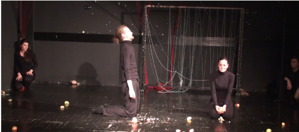
Slika 4: Slika iz predstave, scena Žute dunje