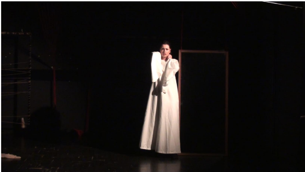
Slika 5: Slika iz predstave, scena Lijepa Zejno