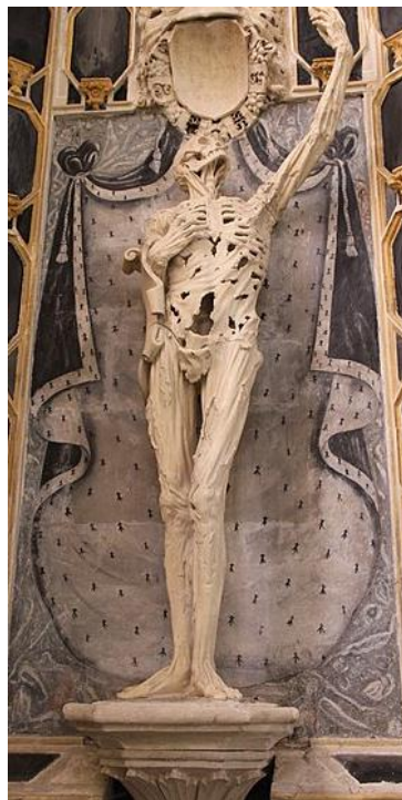
Slika 9. Ligier Richier Transi skulptura Renéa de Chalona, 1544.-1557., mramor i vapnenac, visina 170 cm

osušeno tijelo kako drži vlastito srce u zraku. Obično su skulpture heroja koji poginu u bitci isklesane pompozno, prikazujući hrabrog borca s žestokim stavom, zastrašujućim mišićima i odlučnim izrazom lica, ali u slučaju Renéa de Chalona nije tako. Kad je došlo vrijeme za obilježavanje princa u kamenu, renesansni francuski kipar Ligier Richier isklesao je truli leš s isjeckanim mišićima koji su padali s kostiju i kožom koja je visjela u preklopima preko šupljeg kostura. Lubanja kostura gleda prema podignutoj lijevoj ruci - izvorno je ova ruka držala prinčevo stvarno osušeno srce 13 . Time je ispunjena njegova navodna samrtnička želja, da njegova grobnica prikazuje njegovo tijelo kakvo će biti tri godine nakon njegove smrti. Skulptura je izložena u crkvi Saint-Étienne u francuskom gradu Bar-le-Duc, a smještena je iznad oltarne pale od isklesanog mramora i vapnenca. Iako se skulptura pripisuje Ligieru Richieru, ostali dijelovi, poput grba i poderane draperije, dodani su u 16. i 18. stoljeću. 18. lipnja 1898., proglašena je povijesnom skulpturom, a grobnica je premještena na čuvanje u Panteon u Parizu tijekom Prvog svjetskog rata, prije nego što je vraćena u Bar-le-Duc 1920. godine. Skulptura i oltarna pala restaurirani su između 1998. i 2003., a replike se nalaze u Musée Barrois u Bar-le-Ducu i Palais de Chaillot u Parizu. 14