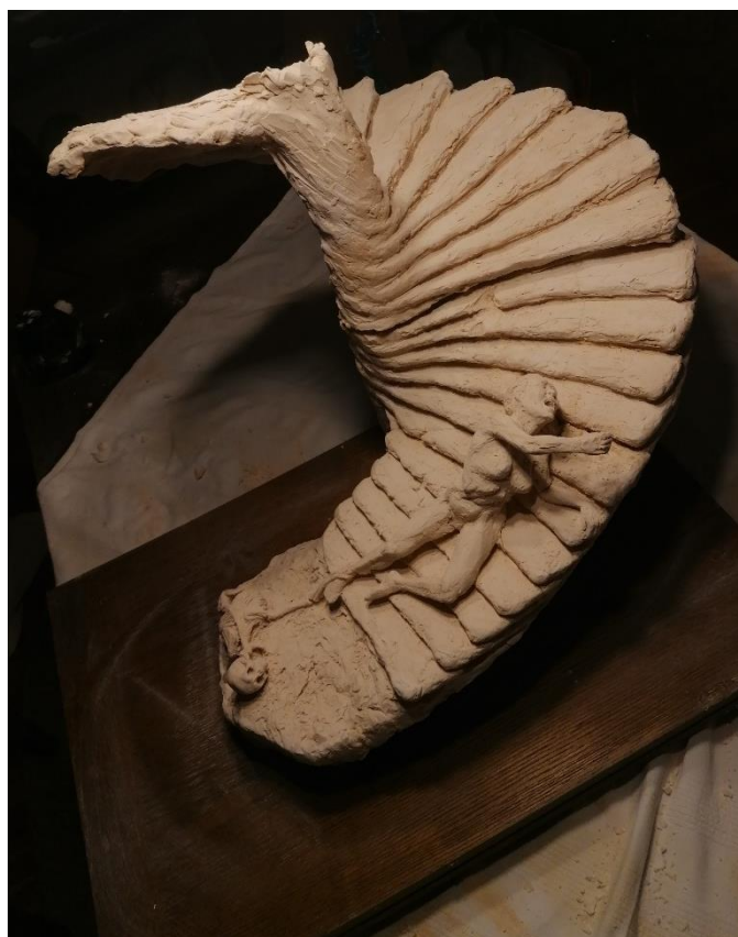
Slika 22 , 23. Memento mori skulptura, terakota, 57x56x55 cm