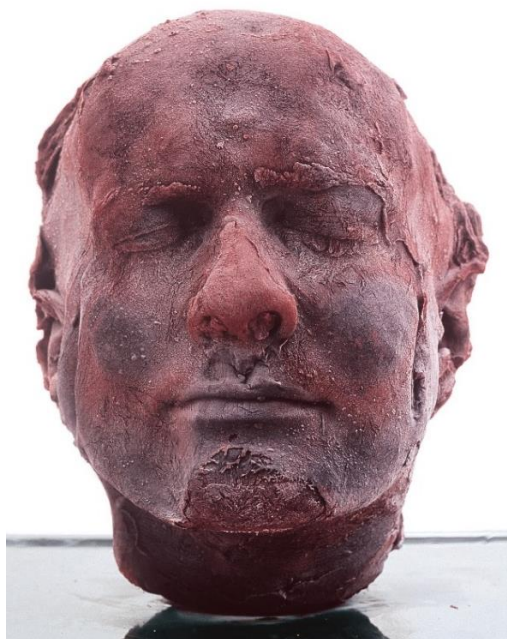
Slika 4. Marc Quinn, Self , 1991., krv, 208x63x63 cm

ljudskog postojanja. Prikazujući ljudsko tijelo u različitim fazama života i raspadanja, Quinn predstavlja nefiltrirani pogled na životno putovanje, od rođenja do neizbježne smrti 8 .