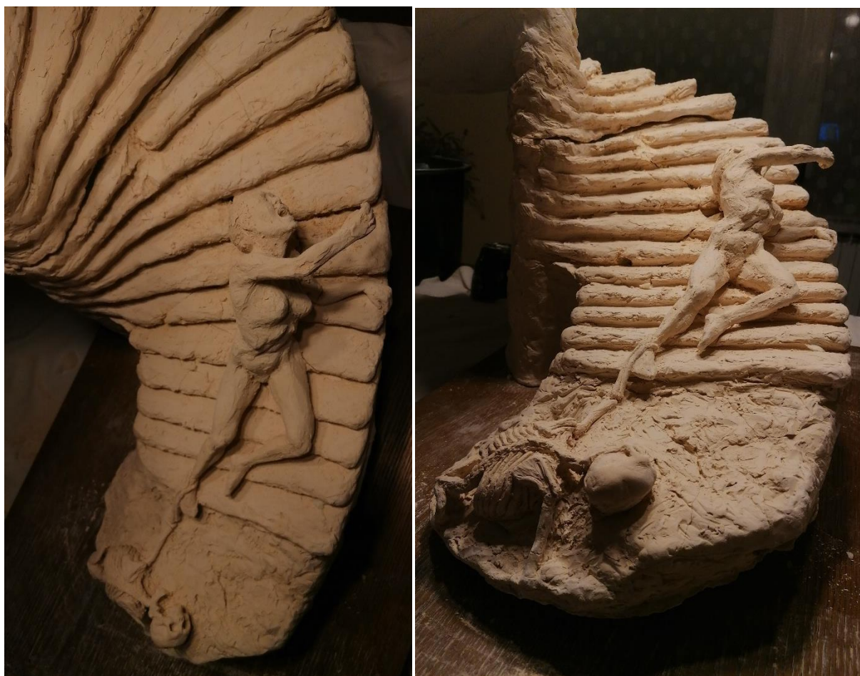
Slika 18, 19. Memento mori skulptura, terakota, 57x56x55 cm

metaforički prikaz kako ljudi koji možda više nisu u našem životu i dalje imaju utjecaj i moć nad nama. Skulptura prikazom ženskog akta u ranjivom stanju u borbi protiv propadanja sažima bit memento mori i zadire u duboke teme otpora, nemoći, patnje, straha, smrti i iskorištavanja. Kroz ovaj prikaz, gledatelje se potiče na razmišljanje o prolaznoj prirodi i surovoj borbi života. Skulptura predstavlja važnost otpornosti pred stalnim propadanjem i trajnom borbom protiv sila koje nas žele iskoristiti i slomiti. Ovaj rad za mene predstavlja moj osobni put promjene, ali i motivaciju za daljnji rast unatoč problemima koje nam život svima donosi.