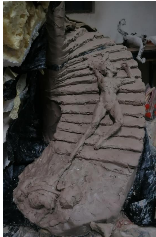
Slika 29. Proces izrade figure prije mijenjanja poze