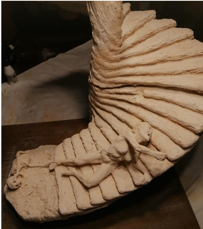
Slika 20 , 21. Memento mori skulptura, terakota, 57x56x55 cm