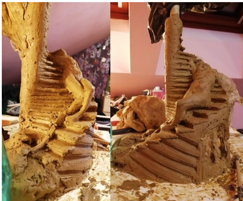
Slika 24, 25. Skica u glini manjeg formata

Kada se na glinu grade manji elementi, mora ih se čvrsto utisnuti tako da pri pečenju ne bih došlo do pucanja. Karakter površine dobivamo pomoću teksture, na ovom radu tekstura je namjerno ostavljena nezaglađeno, tj. vidljiv je rukopis umjetnika, simbolizirajući nesavršenost ljudske prirode. Ovakva brada površine u radu simbolizira metaforu propadanja i prenosi poruku da kao i svako tijelo, tako je i rad nesavršen i prolazan, što je neizostavan dio života. Stepenice su podijeljene na dva dijela, te se rad nakon sušenja palio u keramičkoj peći. Dijelovi rada odvojeno su stavljani u keramičku peć na temperaturu od 980°C, nakon čega glina poprima veliku tvrdoću.