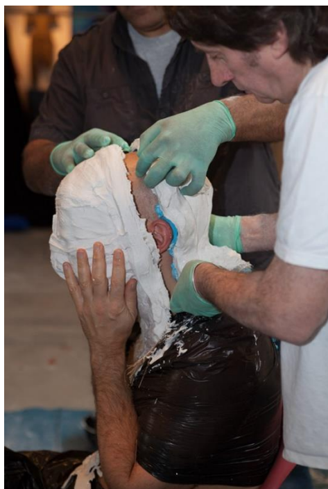
Slika 5. Marc Quinn, Self , proces izrade kalupa