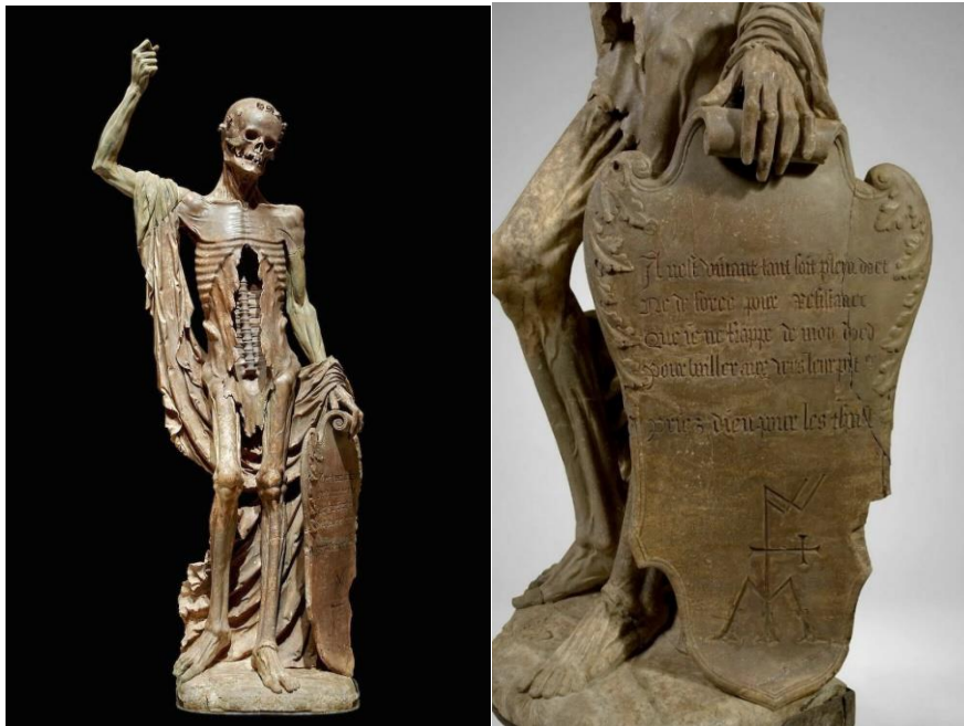
Slika 8. Smrt svetog Inocenta , 1520. – 1530., gips, visina 120 cm

Na slici 8. vidimo skulpturu koja prikazuje alegoriju smrti svetog Inocenta a pripada razdoblju gotičke umjetnosti. Skulptura je visoka 1,2 metra i izvorno je smještena u središtu "Groblja nevinih" u Parizu, koje je zatvoreno 1786. Ne postoji puno informacija o autoru i vremenu nastanka skulpture. Procjenjuje se da je nastala oko 1530. godine. Skulptura je kostur koji drži štit na kojemu je napisan stih: „Živim samo u umjetnosti bez snage i otpora. Koga sam pogodio svojom strijelom da ih pošalje u siromaštvo moli se Bogu za pokojne". Nakon zatvaranja groblja na kojemu se skulptura nalazila, 1780., skulptura je odnesena u Saint-Gervais, zatim u Notre-Dame, gdje su restaurirane ruke, a zatim ide u Muzej francuskih spomenika. Od 1866. godine u vlasništvu je Muzeja Louvre. 11