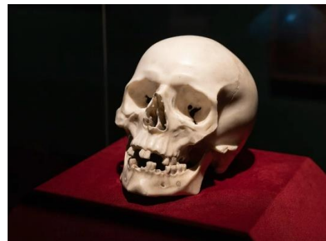
Slika 11. Gian Lorenzo Bernini, Mramorna lubanja, 1655.