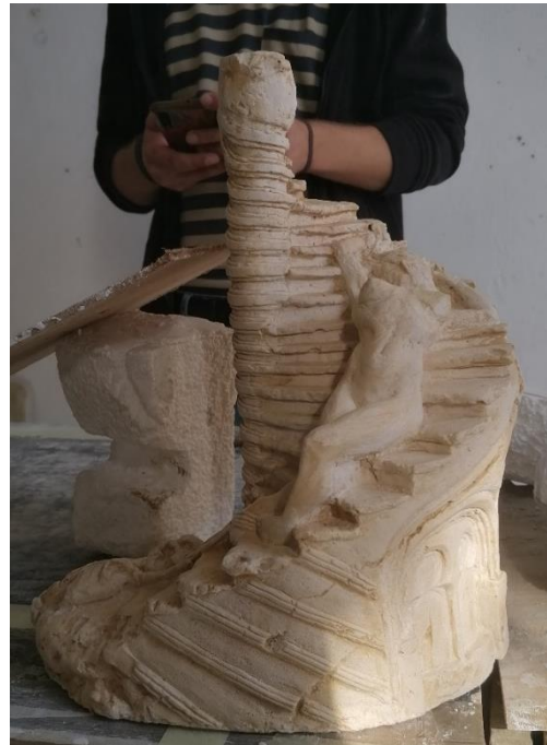
Slika 26, 27. Skica odlivena u gipsu, 32x23x27 cm