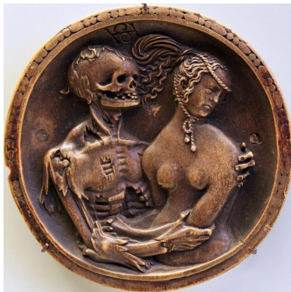
Slika 14. Hans Schwarz, Smrt i djevojka , 1520., drvo, promjer 10.5 cm

Skulptura 'I Uvijek! I nikad! prikazana na slici 15. pokazuje još jedan primjer odnosa između smrti i djevojke . U ovom djelu Smrt je prikazana kao tradicionalni kostur, ali umjesto da samo odvede mladu ženu u ples smrti, on je prikazan kako je zavodi. Razni su umjetnici različito tumačili motiv, ali inače se Smrt prikazuje kao ljubavnik ili udvarač koji ljubi i vara ženu. Unatoč prividnoj senzualnosti motiva Smrt i djevojka , on nosi snažnu moralnu poruku podsjećajući na prolaznost života i kratkotrajnost ljepote. Sve što se danas čini savršeno sutra može nestati. 20