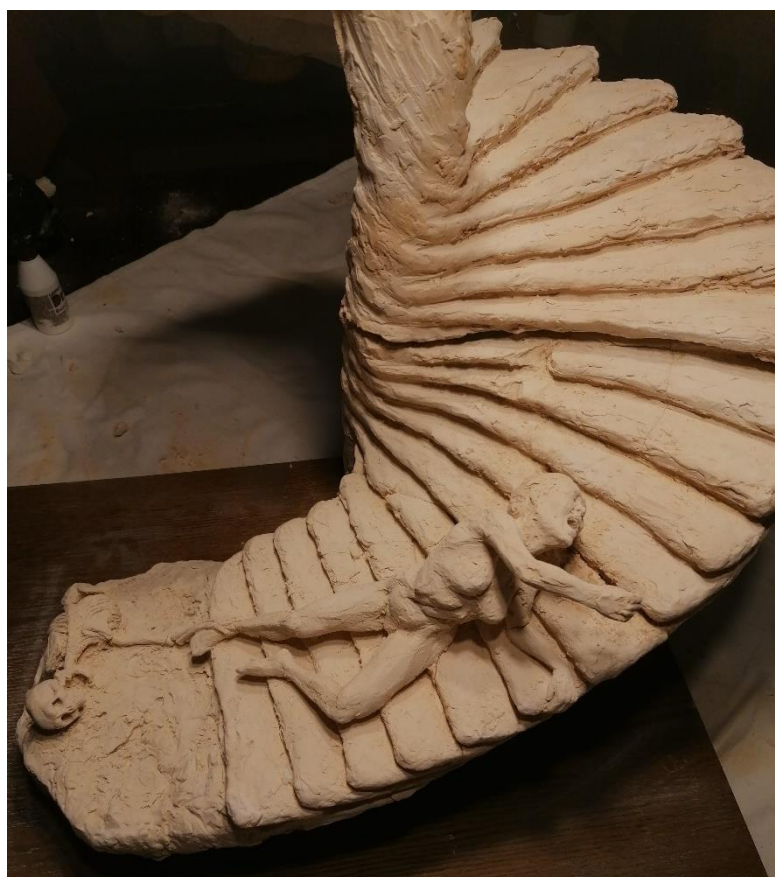
Slika 20 , 21. Memento mori skulptura, terakota, 57x56x55 cm