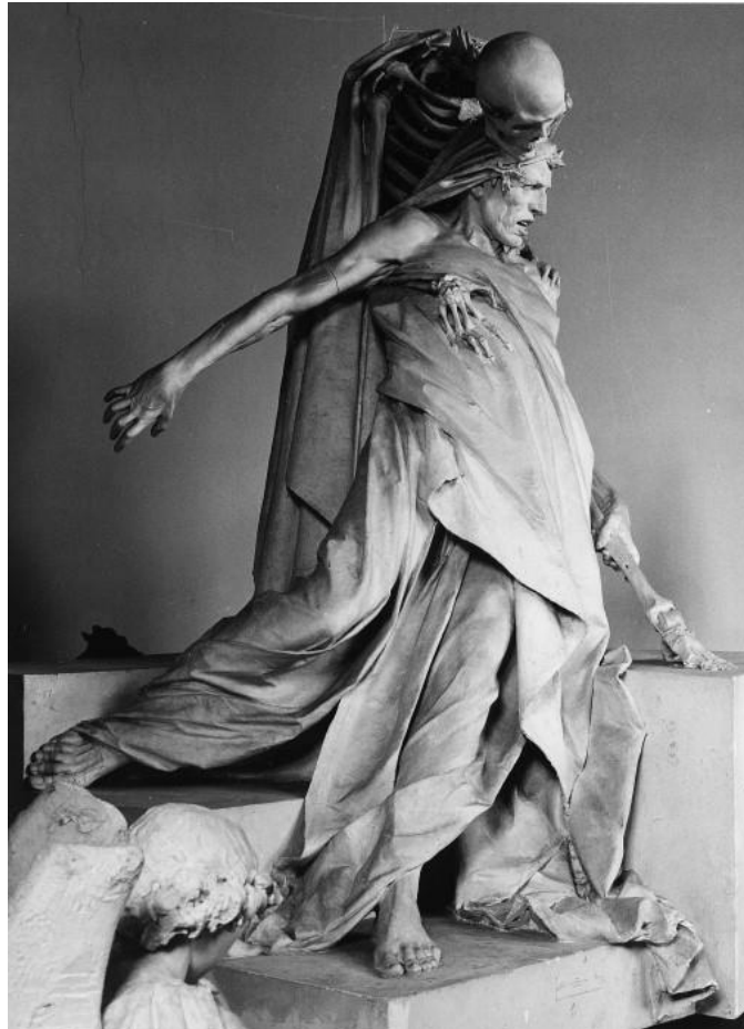
Slika 13. Rinaldo Carnielo, Životna upornost , 1893., mramor

sve svoje radove temeljilo na smrti. Zato se svrstava u Memento mori umjetnike, ne samo zbog tematike, već i zbog njegove velike individualnosti u usporedbi s drugim umjetnicima tog vremena, kako talijanskim tako i s ostatkom europskog kontinenta, koji su već tada slijedili put secesije. Skulptura je jedna od nepoznatih blaga europske umjetnosti 19. stoljeća, jer je uništena tijekom drugog svjetskog rata. 17