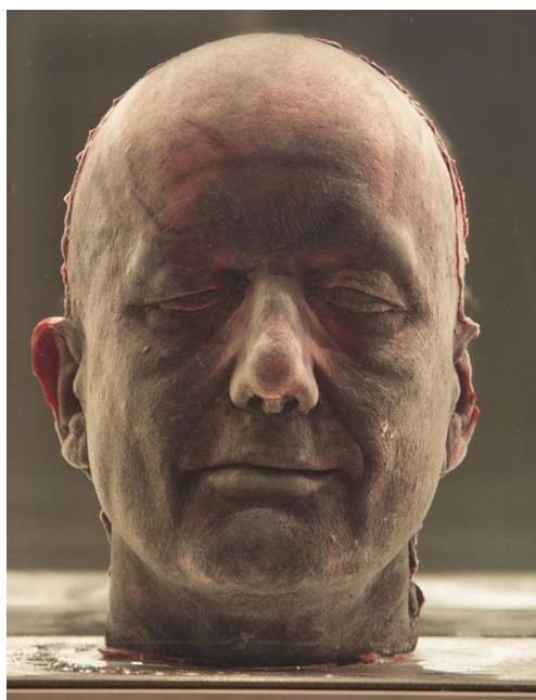
Slika 6. Marc Quinn, Self , 2011., krv, 208x63x63 cm