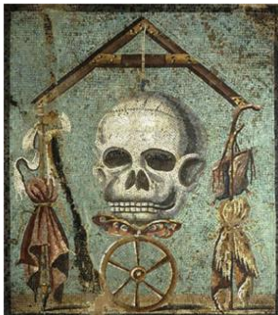
Slika 1. Memento Mori , nepoznati umjetnik, 1. stoljeće, 42x47 cm, mozaik

vulkanskog pepela. 1 Slični Memento mori mozaici pronađeni su i u drugim triklinijama u Pompejima, poput onog u Kući Fauna koji prikazuje kostura koji nosi vrčeve vina (Slika 2). Ikonografija smrti u scenarijima objedovanja izgleda više razigrano nego morbidno, oni potiču na piće i veselje. Prijeteća mogućnost smrti u svakom trenutku nameće pitanje: „Zašto se večeras ne zabaviti?“ 2