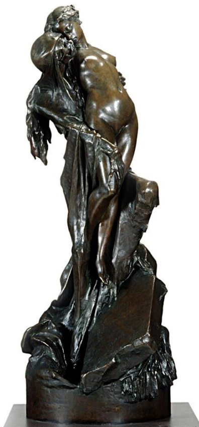
Slika 15. Pierre Eugène Emile Hébert, I Uvijek! I nikad! , 1863., bronca, 49.9x63.5x 68.6 cm