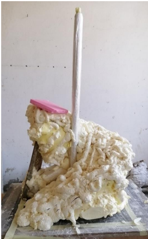
Slika 28. konstrukcija prije oblikovanja