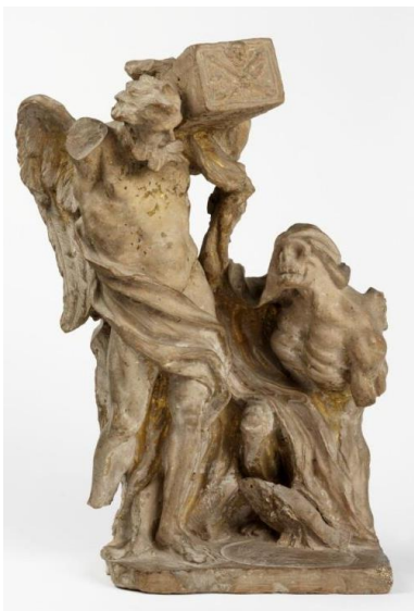
Slika 10. Gian Lorenzo Bernini, Vrijeme i smrt , 1670., terakota, visina 36 cm

Rad Vrijeme i smrt je terakota s tragovima pozlate koju je izradio talijanski kipar Gian Lorenzo Bernini. Vjeruje se da je rad zapravo model skice za zidnu grobnicu ili za privremeni pogrebni ukras (Slika 10). Skulptura prikazuje Vrijeme u obliku figure koja na svojim ramenima nosi lijes, podižući tijelo pokojnika iznad dosega Smrti. Smrt, predstavljena u obliku kostura, ostaje uskraćena svoje "nagrade", pokušavajući dohvatiti lijes. Skulptura je prvi put prepoznata 1900. godine kao Berninievo djelo jer pokazuje karakteristične značajke njegovog stila, uključujući detaljnu izradu na prednjem dijelu, te grublju obradu stražnje strane, gdje su vidljivi umjetnikovi otisci prsta. Tema smrti bila je jedna od Berninijevih trajnih opsesija i često se pojavljivala u njegovim djelima. Smatra se da je ta tema potaknuta od njegovog papinskog pokrovitelja, pape Aleksandra VIII, koji je prethodno od Berninija naručio lubanju (Slika 11) i lijes za svoju spavaću sobu da ga podsjećaju na njegovu smrtnost 15 .