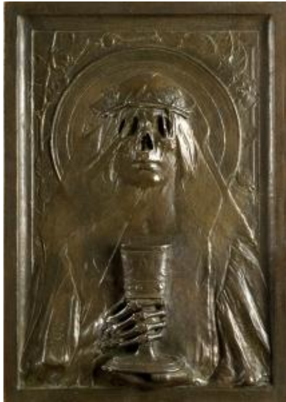
Slika 16. Rudolf Valdec, Ljubav sestra smrti , 1897., bronca

mladosti te sigurnu smrt. Iako je riječ o plitkom reljefu, dinamika se postiže kontrastom volumena pojedinih dijelova tijela figure. Valdec je povezoao stilove rane secesije u oblikovanju stiliziranih grana lišća i cvjetova ruža, te simbolizmom (aureola kao simbol svetosti, kalež kao simbol krvi Kristove i sreće u ljubavi i braku, lubanja kao simbol smrti... 21