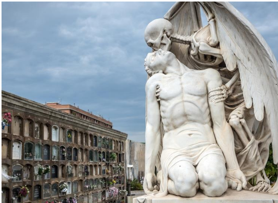
Slika 12. Jaume Barba, Poljubac smrti , 1930., mramor

Poljubac smrti je skulptura za koju se vjeruje se da ju je izradio Jaume Barba, čije je ime uklesano u bazi. Skulptura prikazuje smrt u liku krilatog kostura koji nježno drži umirućeg čovjeka i ljubi ga u obraz (Slika 12). Skulptura je izrađena 1930. za grobnicu proizvođača tekstila Josepa Llaudeta Solera, a na njoj je ispisan stihom proslavljenog katalonskog pjesnika Jacinta Verdaguera. Nadgrobni natpis glasi: "Tako se ugasilo njegovo mlado srce. Hladi mu se krv u žilama. I sva je snaga nestala. Vjera je uzvišena njegovim padom u ruke smrti. Amen." Čvrste kosti kostura stoje pored mladićevog opuštenog tijela. Kip nije samo impresivan zbog rezbarske vještine i sposobnosti umjetnika da vjerno prikaže različite teksture, već i zbog suptilnosti s kojom prikazuje odnos prema smrti. Mramorna skulptura predstavlja primjer moderne interpretacije Memento mori , te nastavlja privlačiti posjetitelje zbog dubokih emocija koje izaziva. 16