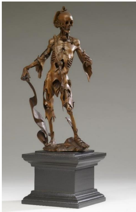
Slika 7. Hans Leinberge, Figura smrti , 1520-ih, drvo, visina 24,7 cm

Na slici 7. možemo vidjeti primjer takve skulpture, tj. drvenu rezbariju koju je izradio njemački umjetnik Hans Leinberger 1520-ih godina. Skulptura ovog tipa najčešće je prikazivala mrtvacu uspravnog tijela, truplo s razderanim odijelom od mesa i otkrivenih rebara. Složenost rezbarenja ove statue pokazuje kvalitetu drveta i vještinu umjetnika, da se utroba može izdubiti i koža oguliti, a da se oblik ne uruši. Figura je ponekad znala držati nekakav simbolički predmet. Leš u Leinbergerovoj skulpturi drži svitak s latinskim natpisom koji u prijevodu znači “Ja sam ono što ćeš ti biti. Bio sam ono što si ti. Za svakog čovjeka je tako.” 10