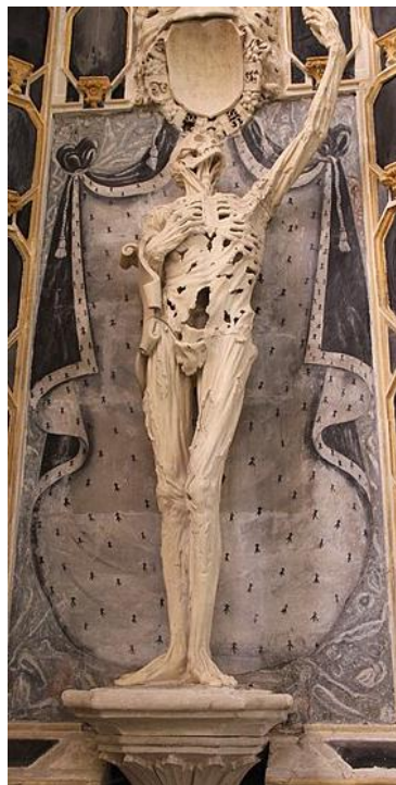
Slika 9. Ligier Richier Transi skulptura Renéa de Chalona, 1544.-1557., mramor i vapnenac, visina 170 cm

osušeno tijelo kako drži vlastito srce u zraku. Obično su skulpture heroja koji poginu u bitci isklesane pompozno, prikazujući hrabrog borca s žestokim stavom, zastrašujućim mišićima i odlučnim izrazom lica, ali u slučaju Renéa de Chalona nije tako. Kad je došlo vrijeme za obilježavanje princa u kamenu, renesansni francuski kipar Ligier Richier isklesao je truli leš s isjeckanim mišićima koji su padali s kostiju i kožom koja je visjela u preklopima preko šupljeg kostura. Lubanja kostura gleda prema podignutoj lijevoj ruci - izvorno je ova ruka držala prinčevo stvarno osušeno srce 13 . Time je ispunjena njegova navodna samrtnička želja, da njegova grobnica prikazuje njegovo tijelo kakvo će biti tri godine nakon njegove smrti. Skulptura je izložena u crkvi Saint-Étienne u francuskom gradu Bar-le-Duc, a smještena je iznad oltarne pale od isklesanog mramora i vapnenca. Iako se skulptura pripisuje Ligieru Richieru, ostali dijelovi, poput grba i poderane draperije, dodani su u 16. i 18. stoljeću. 18. lipnja 1898., proglašena je povijesnom skulpturom, a grobnica je premještena na čuvanje u Panteon u Parizu tijekom Prvog svjetskog rata, prije nego što je vraćena u Bar-le-Duc 1920. godine. Skulptura i oltarna pala restaurirani su između 1998. i 2003., a replike se nalaze u Musée Barrois u Bar-le-Ducu i Palais de Chaillot u Parizu. 14