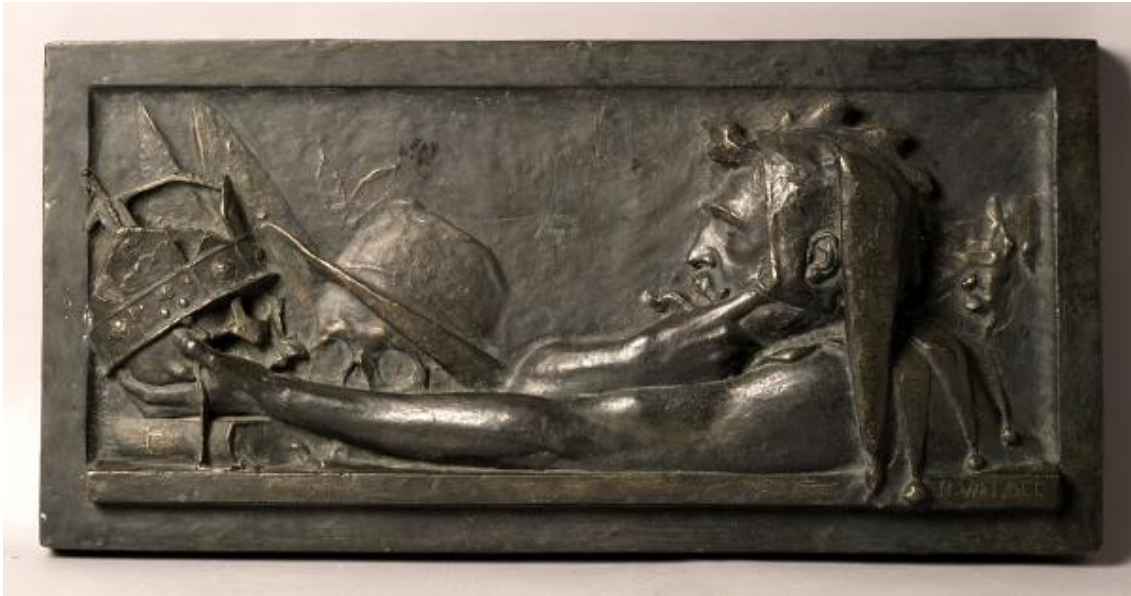
Slika 17. Rudolf Valdec, Memento mori , 1898., bronca

postavljena je lubanja s šešišrom. Utjecaj moderne umjetnosti i simbolizma, vidljiv je u odabiru teme smrti i prolaznosti života koju Valdec naznačuje naslovom Memento mori , tj. sjeti se smrti, ali i razradom motiva mrtvačkoga plesa koji u ovom reljefu prikazuje s minimalnim brojem predstavnika staleža. Nasuprot lubanji s krunom i građanskim šešišrom postavlja svoj autoportret u profilu s kapom dvorske lude, želeći naglasiti kako smrt izjednačava sve staleže. 22