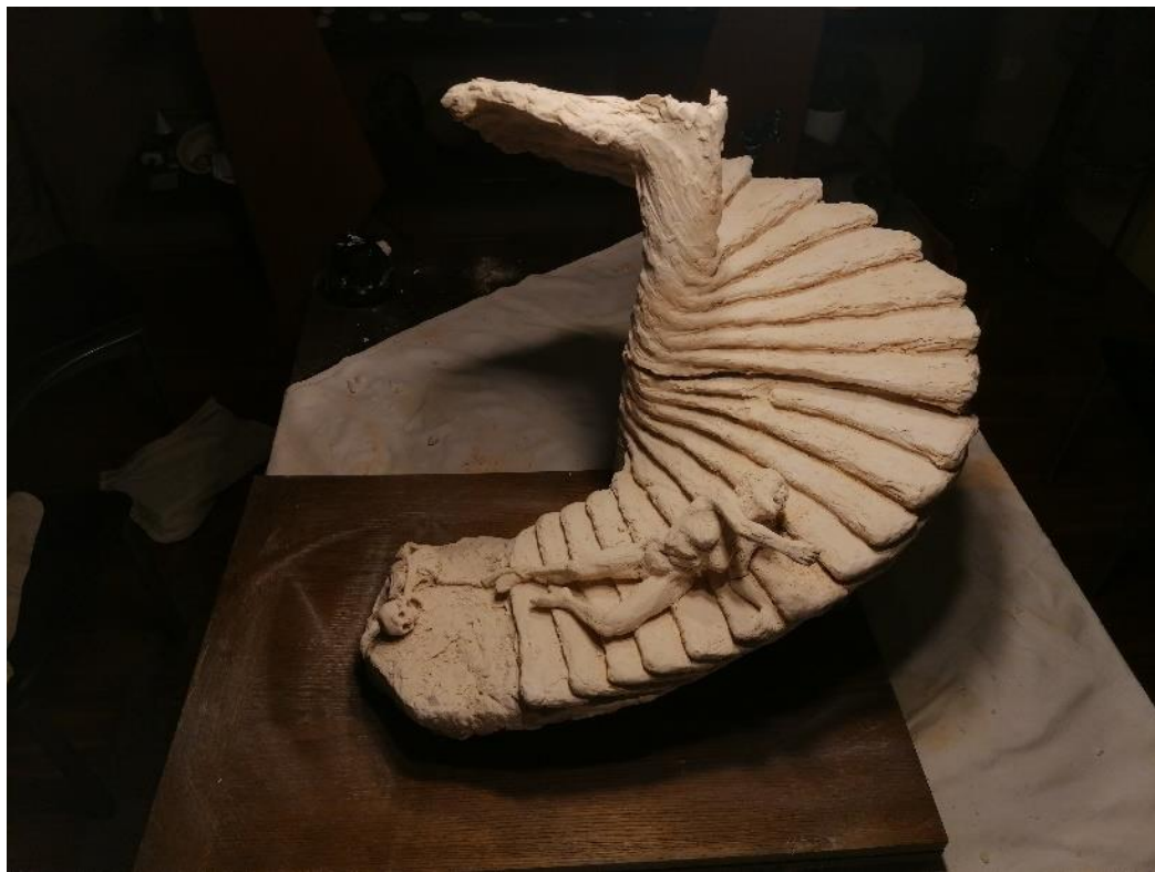
Slika 30, 31. Skulptura nakon pečenja, prikazana na postamentu, terakota, 57x56x55 cm