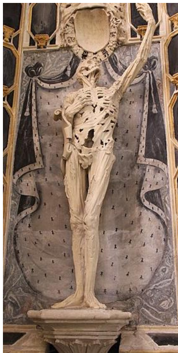
Slika 9. Ligier Richier Transi skulptura Renéa de Chalona, 1544.-1557., mramor i vapnenac, visina 170 cm

osušeno tijelo kako drži vlastito srce u zraku. Obično su skulpture heroja koji poginu u bitci isklesane pompozno, prikazujući hrabrog borca s žestokim stavom, zastrašujućim mišićima i odlučnim izrazom lica, ali u slučaju Renéa de Chalona nije tako. Kad je došlo vrijeme za obilježavanje princa u kamenu, renesansni francuski kipar Ligier Richier isklesao je truli leš s isjeckanim mišićima koji su padali s kostiju i kožom koja je visjela u preklopima preko šupljeg kostura. Lubanja kostura gleda prema podignutoj lijevoj ruci - izvorno je ova ruka držala prinčevo stvarno osušeno srce 13 . Time je ispunjena njegova navodna samrtnička želja, da njegova grobnica prikazuje njegovo tijelo kakvo će biti tri godine nakon njegove smrti. Skulptura je izložena u crkvi Saint-Étienne u francuskom gradu Bar-le-Duc, a smještena je iznad oltarne pale od isklesanog mramora i vapnenca. Iako se skulptura pripisuje Ligieru Richieru, ostali dijelovi, poput grba i poderane draperije, dodani su u 16. i 18. stoljeću. 18. lipnja 1898., proglašena je povijesnom skulpturom, a grobnica je premještena na čuvanje u Panteon u Parizu tijekom Prvog svjetskog rata, prije nego što je vraćena u Bar-le-Duc 1920. godine. Skulptura i oltarna pala restaurirani su između 1998. i 2003., a replike se nalaze u Musée Barrois u Bar-le-Ducu i Palais de Chaillot u Parizu. 14