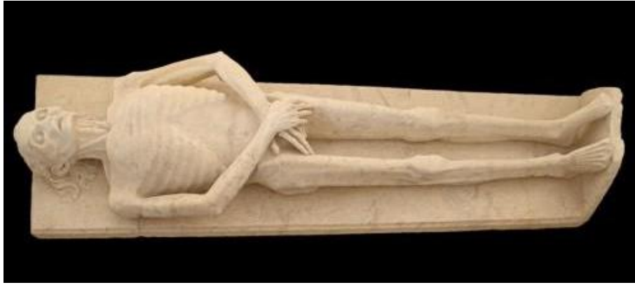
Slika 3. Grobnica Guillaumea de Harcignyja, nepoznati umjetnik, vapnenac, 1394., 184 cm