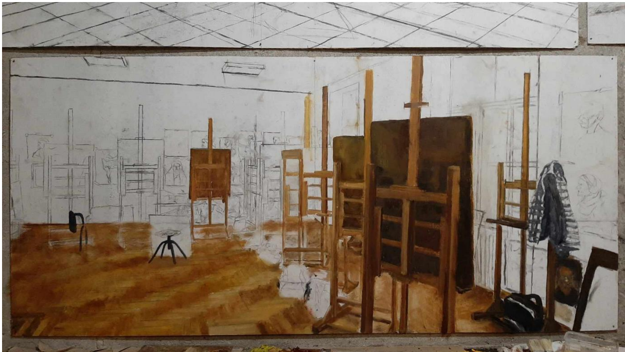
Slika 18. Prikaz 3. crteža završnog rada

Još jedan od izazova bio je postizanje ujednačenosti tonova. U početku, slike su bile tamnije nego što sam planirao, pa je bilo potrebno prilagoditi paletu boja i svjetlinu kako bi radovi postigli željeni efekt. Ovaj tehnički proces bio je dugotrajan, ali kroz njega sam naučio mnogo o harmoniji boja i o tome kako različiti tonovi mogu stvoriti specifičnu atmosferu.