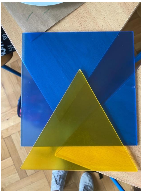
Slika 1. Likovna pomagala

U nastavku rada detaljnije će se opisati nastavni sat s učenikom Lukom. Luka je prije upisa u Centar za odgoj i obrazovanje „Ivan Štark“ išao u redovnu osnovnu školu. Sada pohađa nastavu u Centru „Ivan Štark“, gdje je jako zadovoljan i osjeća se ugodno. Iz prijašnje škole Luka pamti samo nogomet, najviše voli vlakiće te ih rado crta u svoje slobodno vrijeme. Oblik rada na satu bio je frontalni, a učenik je promatrao umjetničku reprodukciju. Umjetnička reprodukcija koja je prikazana bila je rad umjetnika Paula Kleeja te likovni pojmovnik o crtama, koji opisuje kakve sve crte mogu biti. Prikazana je i umjetnička reprodukcija Georgesa Seurata. Radovi koji su prikazani korišteni su u nastavi zbog teme sata, a učenici su učili miješanje boja dok im je učiteljica objašnjavala tehniku slikanja naziva pointilizam, gdje se malim jasnim točkama osnovnih boja stvara utisak velikog broja sekundarnih i ostalih boja (Slika 2.). Rad Paula Kleeja prikazan je zbog njegova načina slikanja, koji izgleda poput naslaganih geometrijskih likova (Slika 3.). Na slici 3. također je prikazan pojmovnik o likovnom elementu crte jer se učenicima objašnjavalo kako od crte dolazimo do slikarstva/slikanja.