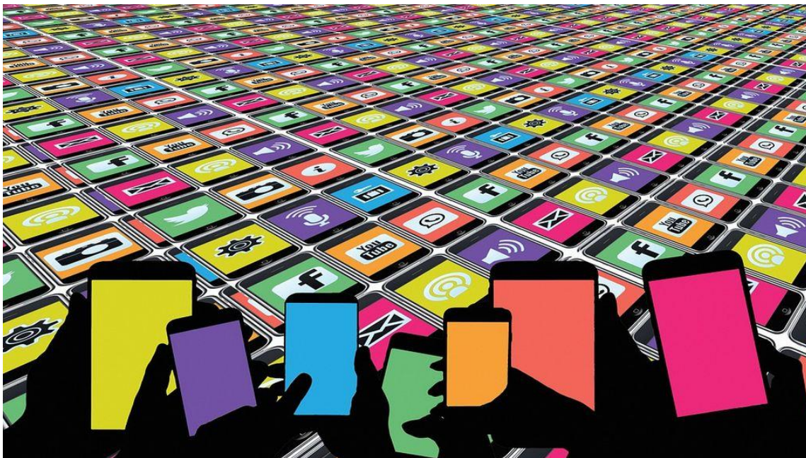
Slika 2. Uzorak angažmana na društvenim mrežama