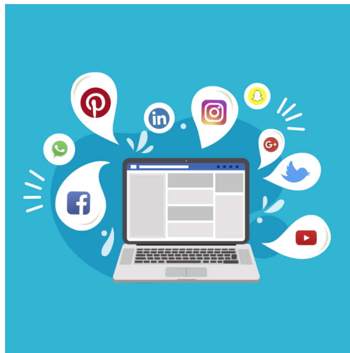
Slika 1. Evolucija društvenih mreža

Kako su se društvene mreže razvijale, tako je raslo i razumijevanje njihovog utjecaja na društvo. Proliferacija SNS-a dovela je do značajnih promjena u komunikacijskim obrascima, društvenim interakcijama, pa čak i marketinškim strategijama. Na primjer, integracija personaliziranog oglašavanja unutar društvenih mreža otvorila je važna pitanja u vezi s privatnošću korisnika i sigurnošću podataka (Tucker, 2013.). Korisnici su sve više svjesni kako se njihovi podaci koriste, što dovodi do potražnje za robusnijim kontrolama privatnosti i transparentnošću od pružatelja platformi. Ova promjena odražava širu društvenu zabrinutost oko digitalne privatnosti i etičkih implikacija praksi prikupljanja podataka (Tucker, 2013.).