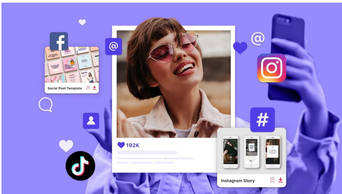
Slika 3. Primjer računa obiteljskog influencera.

Obiteljski influenceri pojavili su se kao značajan globalni trend na društvenim medijima, posebice na platformama poput Instagrama, YouTubea i TikToka. Ovi influenceri grade svoju online prisutnost dijeleći aspekte svojih obiteljskih života, uključujući savjete o roditeljstvu, dnevne rutine, pa čak i osobne prekretnice. Ono što obiteljske utjecajne osobe razlikuje od tradicionalnih kreatora sadržaja je uključivanje njihove djece i drugih članova obitelji kao dio narativa koji se često obraća širokoj publici koja cijeni autentičnost i povezanost (Okonkwo, 2023.). Porast obiteljskih utjecajnih osoba potaknut je sve većom potražnjom za sadržajima koji odražavaju svakodnevna iskustva prosječne osobe s usmjerenjem na obiteljski stil života. Ovaj je trend stvorio snažnu nišu unutar ekosustava utjecajnog marketinga gdje brendovi surađuju s obiteljskim utjecajnim osobama kako bi promovirali proizvode i usluge namijenjene roditeljima i djeci. Dok ovi utjecajni ljudi prikazuju svoje živote na pristupačan i često ambiciozan način, oni njeguju snažne parasocijalne odnose sa svojim sljedbenicima, koji se osjećaju osobno povezanima s obiteljskim putovanjem (Ashraf et al., 2023.).