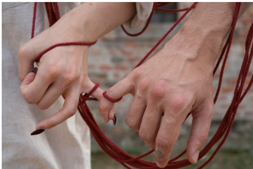
Slika 4 - crvena nit koju smo koristili kao simbol i rekvizit u diplomskom radu.

mogućnosti tjelesnosti, što omogućava i otvara prostor igri. Crvena se nit transformira iz malog, ravnog i zapetljanog konopčića do obruča koji obavija dva protagonista.