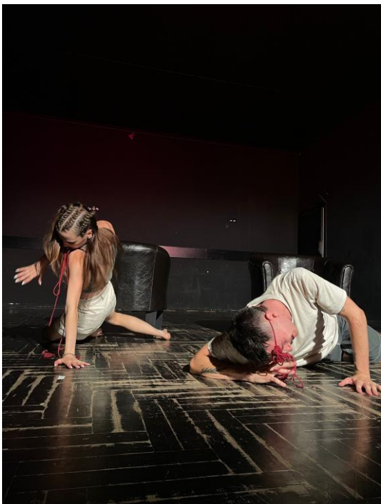
Slika 6 - pokušaj odvajanja od naslonjača.

Do ideje obruča došli smo sasvim slučajno: na jednoj sam probi spojio dva naslonjača i omotao crvenu nit oko njih. Osigurao sam ih ostalim malim konopima koje sam odrezao. Prvobitno nismo znali što raditi s omčom, pa sam predložio improvizacijsku vježbu kretanja prostorom. Jedini je uvjet bio da ostanemo u stalnom fizičkom kontaktu s omčom. Nakon par serija improvizacija lagano smo uz mentoricu Sauerborn fiksirali pokrete i situacije koje su spojene u jednu cjelinu. Imali smo tjelesni materijal (kostur), a sumentor Josipović pomogao nam je taj isti materijal oživjeti u glumi, postavljajući naš odnos kao odnos likova unutar predstave.