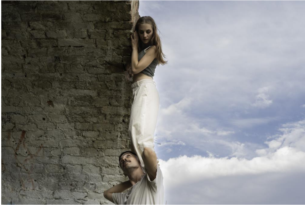
Slika 8 - tjelesni materijal scene „Trešnjica“, fotografiran ispred barutane.