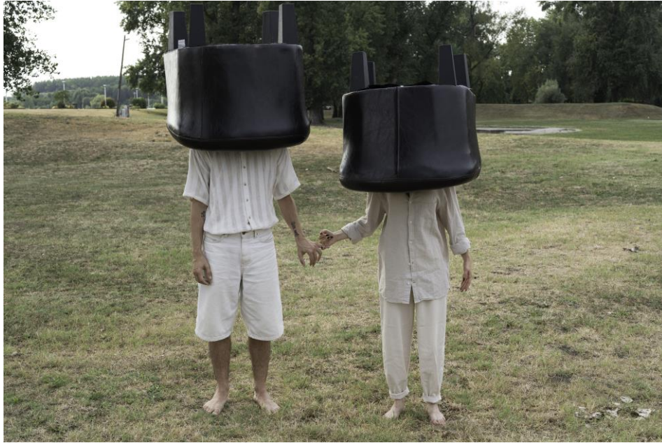
Slika 2 - Naslonjači korišteni u radu na predstavi.