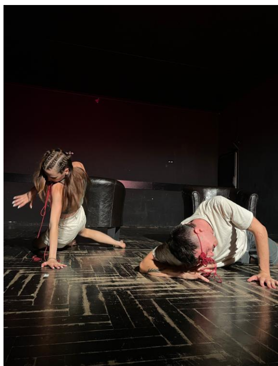
Slika 6 - pokušaj odvajanja od naslonjača.

Do ideje obruča došli smo sasvim slučajno: na jednoj sam probi spojio dva naslonjača i omotao crvenu nit oko njih. Osigurao sam ih ostalim malim konopima koje sam odrezao. Prvobitno nismo znali što raditi s omčom, pa sam predložio improvizacijsku vježbu kretanja prostorom. Jedini je uvjet bio da ostanemo u stalnom fizičkom kontaktu s omčom. Nakon par serija improvizacija lagano smo uz mentoricu Sauerborn fiksirali pokrete i situacije koje su spojene u jednu cjelinu. Imali smo tjelesni materijal (kostur), a sumentor Josipović pomogao nam je taj isti materijal oživjeti u glumi, postavljajući naš odnos kao odnos likova unutar predstave.