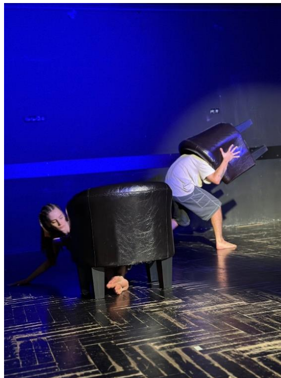
Slika 5 – scena inspirirana slikom Christina's World (1948) Andrewa Wyetha.

Možemo reći da dvoje protagonista traži drugu osobu da upotpune same sebe – Laura donji dio tijela, a ja gornji – ying yang . Postavili smo i prostorni put. Naša je ideja bila kombinacijom spomenutih elemenata dovesti do „susreta“ naslonjača na sredini scene, gdje bismo Laura i ja, kao i sami naslonjači, prvi put došli u fizički kontakt – prvi susret. Mentori su nas uputili da zamislimo da nas gravitacijske sile u svemiru dovode jedno do drugog, što je ujedno i sama poveznica s teorijom crvene niti sudbine. Ta je uputa uvelike objasnila kvalitetu pokreta, koji su sada bili mirniji i laganiji, kao da plutamo. Kombinacijom svih spomenutih elemenata dobili smo scenu.