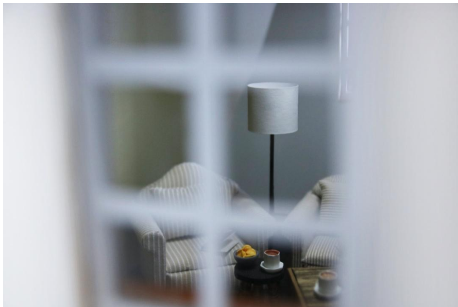
Slika 8. Pogled kroz prozor - prostorija s dnevnim borvacom