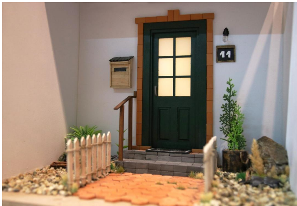
Slika 5. Presjek makete - prostorija s ulaznim vratima