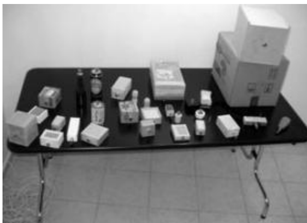
Slika 1. Stefan Bohnenberger, Mala špijunka

odnosi se na duhovni aspekt osobe, povezan s umom, srcem, dušom i duhom osobe. Nasuprot tome, vanjsko, odnosno, „vanjski čovjek“ predstavlja vidljivi, vanjski aspekt osobe (Kandi, 2021: 2). Riječi unutarnje i vanjsko odražavaju dihotomiju u izravnom iskustvu. Unutarnje i vanjsko ne mogu se vidjeti istovremeno. Bihevorist se, zanemarujući unutrašnjost uma, usredotočuje na svijet vanjskih objekata, bilo da su živi ili neživi. Ti su objekti definirani njihovim izgledom i ponašanjem. Njihov vanjski izgled sam po sebi ne otkriva unutrašnjost, ali ostavlja prostor za pretpostavke o prirodi skrivene jezgre. Nasuprot tome, introspekcija, koja se bavi unutrašnjim svijetom uma, može samo nagađati o izgledu promatrača na temelju onoga što se osjeća unutar. Osoba ne može vidjeti vlastito lice. Svijet kakav percipira introspekcija nikada nije stvarno izvanjski, to je više proširenje unutrašnjosti - skup prepreka i prilika, kako je Freud opisao cjelokupnost nesvjesnog. (Arnheim, Zucker, Watterson, 1996 : 3).