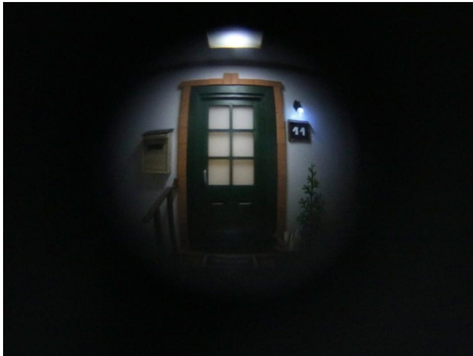
Slika 7. Pogled kroz špijunku - prostorija s ulaznim vratima