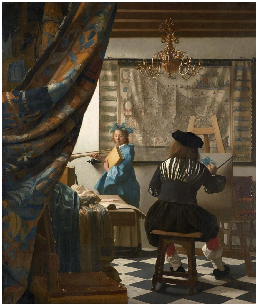
Slika 3. Johannes Vermeer, Alegorija slikarstva

Dakle, za voajerizam je najvažniji vizualni aspekt iako ne treba zanemariti i auditivni aspekt koji upotpunjuje kontekst vizualnog. Vizualni aspekt odnosi se na gledanje ili promatranje određene scene, osobe ili događaja kako bi se dobila određena stimulacija ili zadovoljstvo. U voajerizmu su vizualni podražaji ključni jer osoba dobiva užitek prvenstveno kroz gledanje. Ovaj aspekt može uključivati promatranje situacija koje su privatne, intimne ili na neki način zabranjene ili skrivene. Kulturni kontekst, u smislu gledanja društvenih, kulturnih ili umjetničkih prikaza onog skrivenog također može izazvati osjećaj uzbuđenja ili intrige.