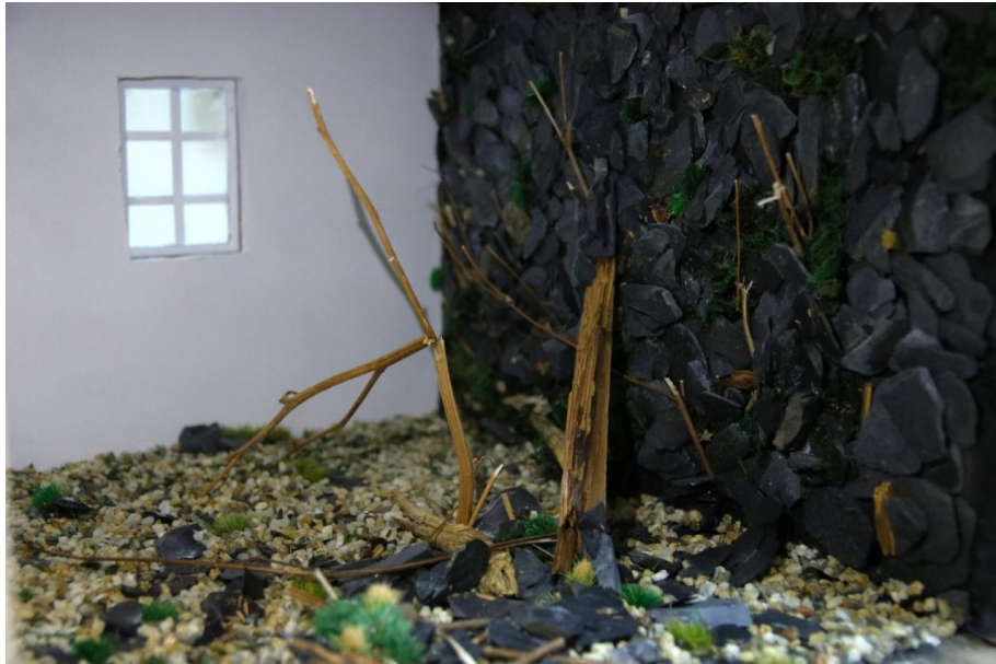
Slika 6. Presjek makete u izradi - prostorija s prirodom