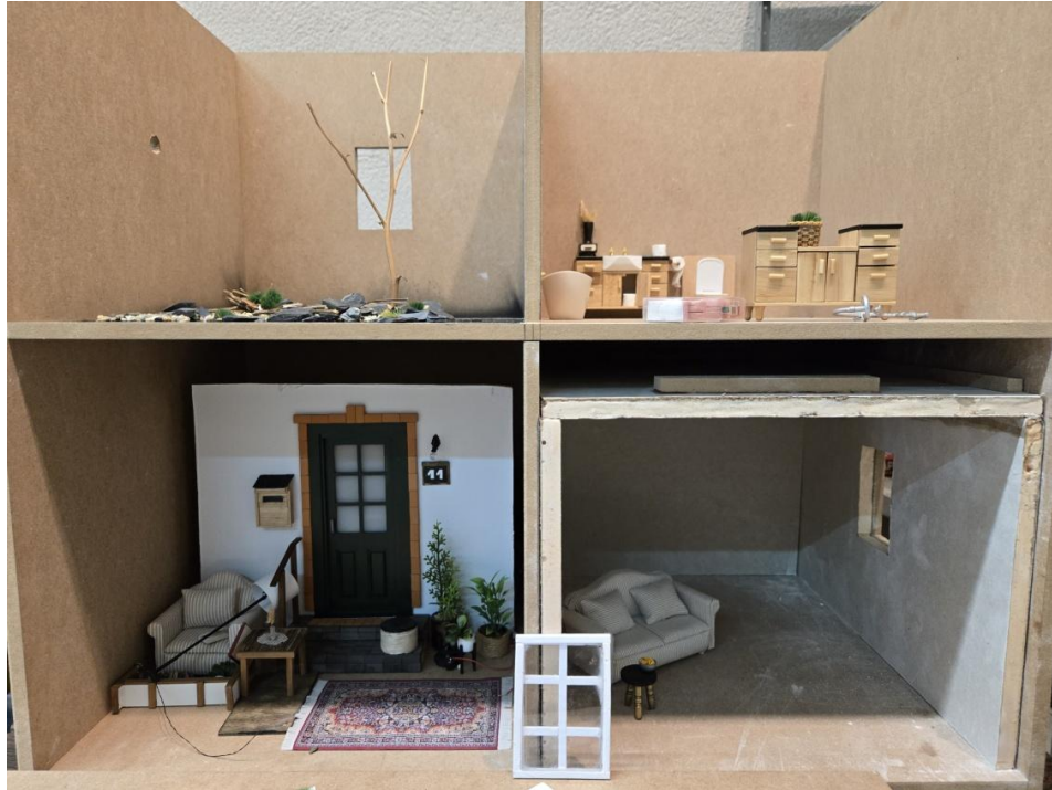
Slika 4. Proces izrade rada - presjek makete u izradi