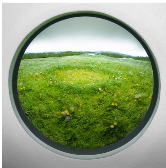
Slika 2. Patrick Jacobs, Familiar Terrain

strane, opisuje trodimenzionalnu scenu koja se spaja s dvodimenzionalnom, obično naslikanom, pozadinom. Najčešći tipovi su ili u mjerilu 1:1, obično prikazujući preparirane životinje u njihovom staništu, tzv. stanišne diorame, ili to mogu biti minijaturne inačice različitih scenarija. Iako obje definicije dijele sličnosti, njihovi povijesni konteksti i ciljevi prilično se razlikuju (Ludwig, 2016 : 12).