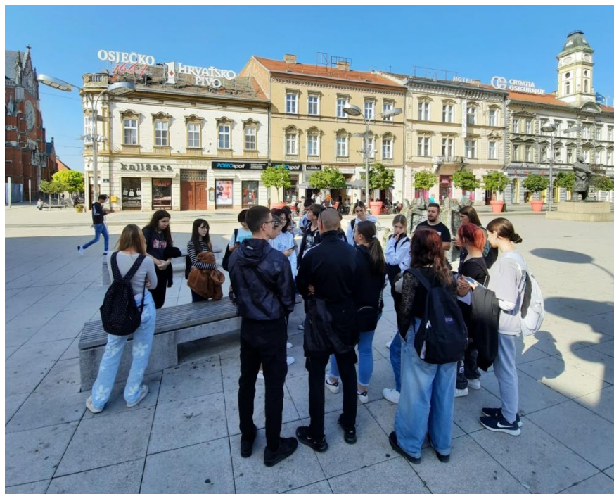
Slika 1. Radionica Multikulturalnost grada Osijeka