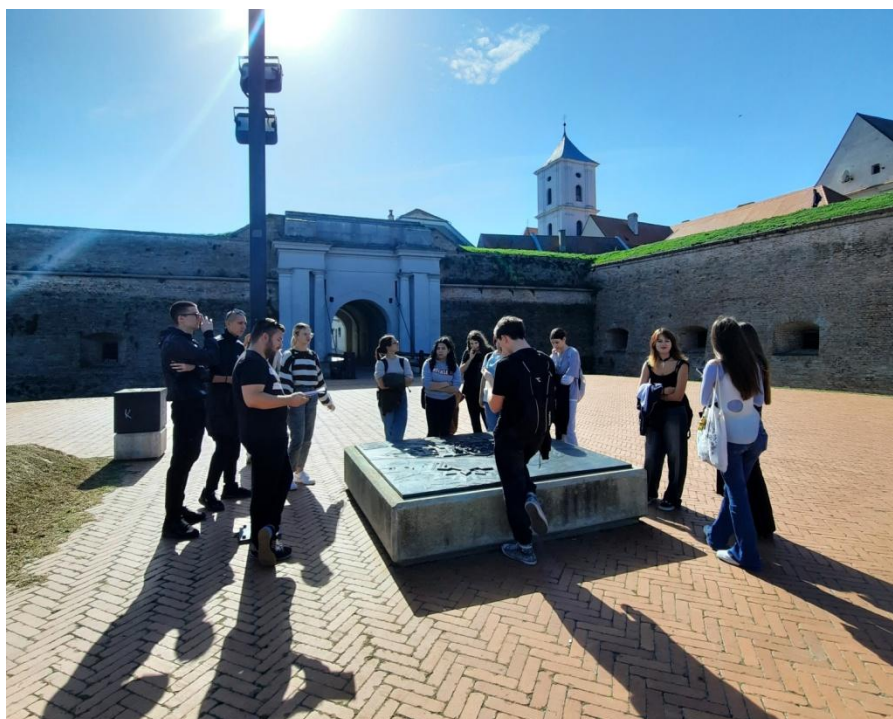
Slika 2. Radionica Multikulturalnost grada Osijeka