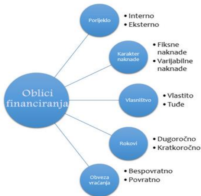
Slika 3: Oblici financiranja