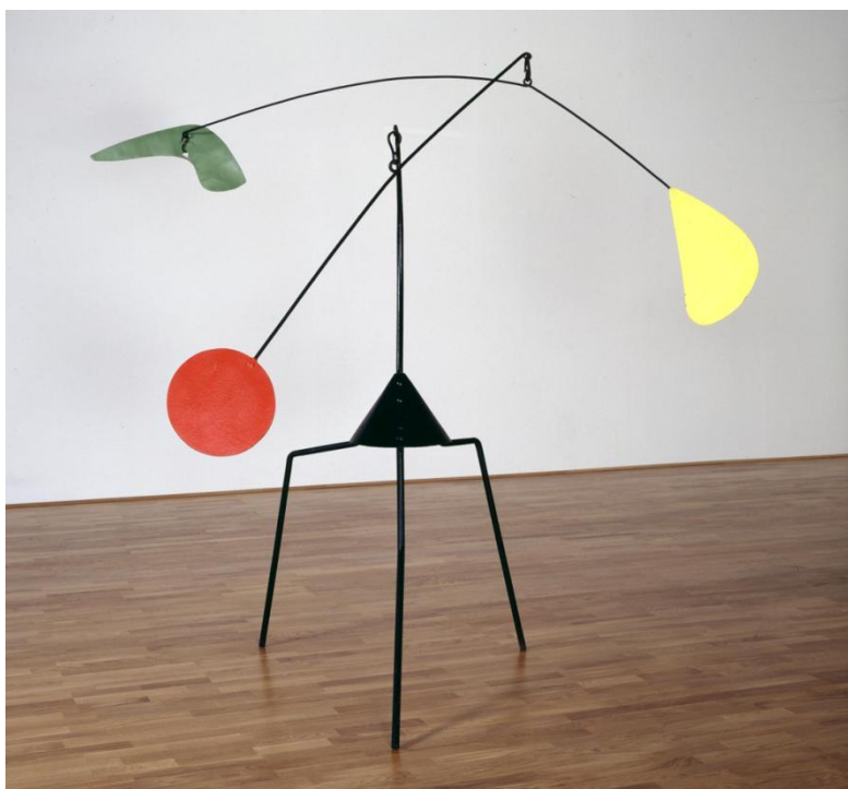
Slika 7. Alexander Calder, Bez naslova , 1937.