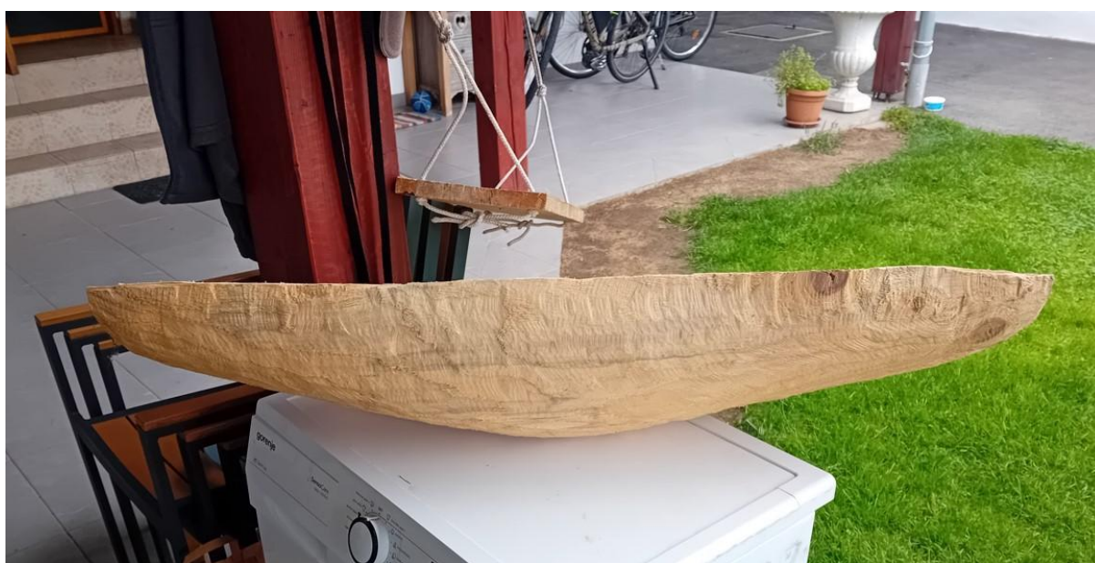
Slika 8. Oblikovanje drveta

Rad je realiziran tako što je komad drveta topole odsječen na pola motornom pilom. Sve je drvo korišteno za izradu rada topola. Ta polovica nije odrezana pravilno zbog teškoća s alatom, koji nije ravno prolazio kroz drvo i zbog veličine motorne pile koja nije bila adekvatna jer mač motorne pile nije bio dovoljno dugačak. Kada sam odsjekao polovicu drveta, krenuo sam još ugrubo rezati motornom pilom veće komade kako bi oblikovao komad drveta. Odsjekao sam više komada da bi dobio deblju sredinu drveta, a krajeve tanje. Zatim sam uzeo kutnu brusilicu i stavio brusnu ploču za drvo te sam krenuo u grubu obradu drveta. Ravni dio drveta koji sam odsjekao motornom pilom nije bio ravan, bio je grbav s dvije različite strane te sam to poravnao brusnom pločom za drvo. Kutnom brusilicom oblikovao sam drvo kako bi bilo oblije i vizualno mekše. Na sredini sam ostavio najdeblje dio jer na njemu mobil treba stajati. Krajeve sam kasnije motornom pilom malo skratio i oblikovao te sam nastavio oblikovati drvo kutnom brusilicom. Brusio sam tako kako bi na sredini ostalo najdeblje, a iz sredine se sužavalo prema krajevima, takve sam poteze radio s brusnom pločom za drvo.