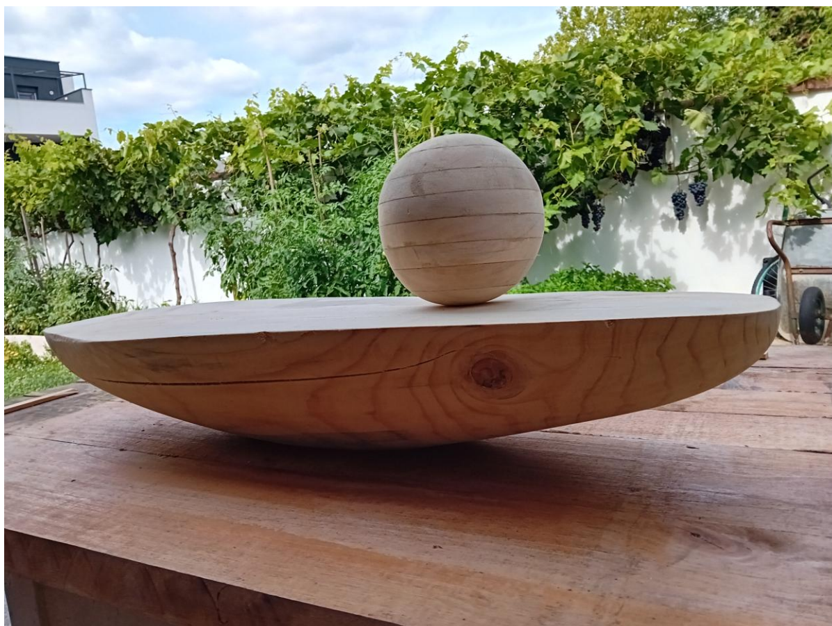
Slika 12. Oblikovano drvo i kugla

Zatim sam izbušio rupu točno na sredini kugle s bušilicom, debljine 1 cm i probušio sam rupu na glavnom dijelu skulpture, točno na sredini do dubine 3 cm, također širine rupe 1 cm. Točno na sredini daske izbušio sam rupu promjera 1 cm. Uzeo sam drvenu tiplu debljine 1 cm, skratio ga, krajeve sam izbrusio brusnim papirom kako bi lakše ulazili i izlazili te sam provukao tiplu kroz glavni veliki komad drveta, pa sam kuglu provukao kroz tiplu i dasku provukao kroz tiplu.