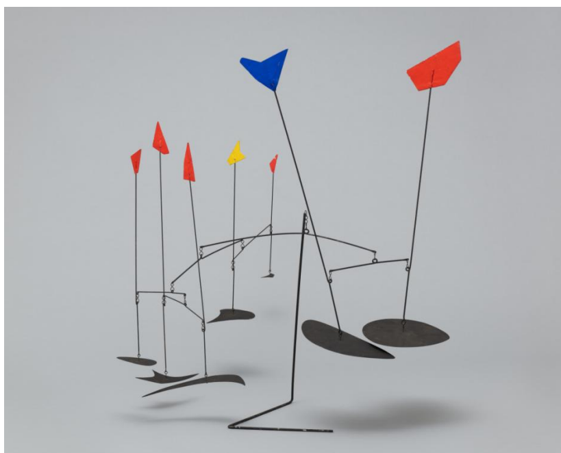
Slika 6. Alexander Calder, Mobil s četrnaest zastava , 1945.