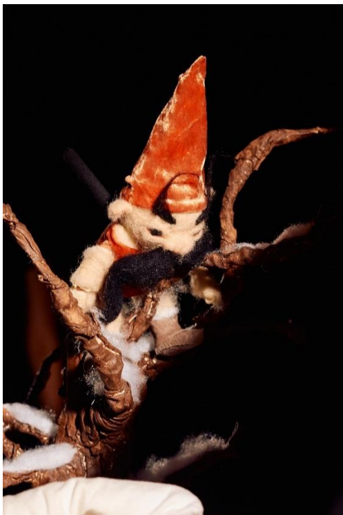
Slika 25: Fotografija Malika iz lutkarske predstave "Šuma Striborova"