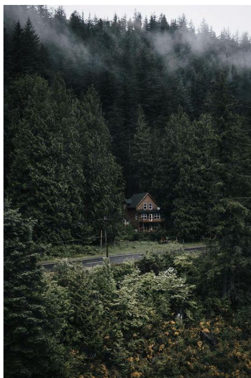
Slika 6: Fotografija kuće u šumi