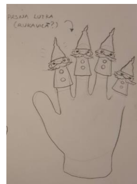
Slika 31: Skica Tintilinića na rukavici