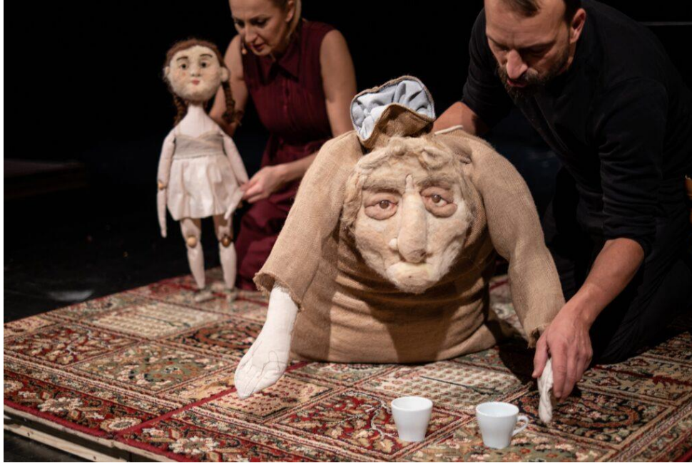
Slika 10: Fotografija lutkarske predstave "Sedam gavranova", Kazalište mladih, Bugojno, fotografija: promo