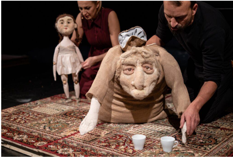
Slika 10: Fotografija lutkarske predstave "Sedam gavranova", Kazalište mladih, Bugojno