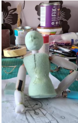
Slika 28: Prikaz procesa izrade Djevojke

Djevojka nosi jednostavnu seosku odjeću – bijelu košulju i tamnu dugačku suknju, koja se skladno uklapala u njezin lik. Cipelice su izrađene od tamne kože kako bi spriječile klizanje pri svakom koraku lutke. Njezina plava kosa ispletena u dvije pletenice, a lice, ruke i dio nogu također su izrađeni tehnikom filcanja.