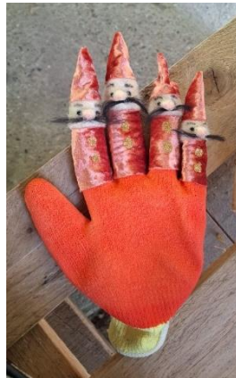
Slika 32: Fotografija lutke Tintilinića

Lica Tintilinića izrađena su tehnikom filcanja te izrazito nalikuju na Malika. Kapica i prsluk koji nose izrađen je od istog materijala kao i Malikova odjeća, odnosno od crvenog baršuna.