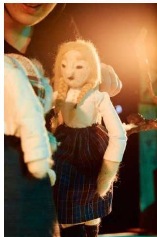
Slika 29: Fotografija Djevojke iz lutkarske predstave "Šuma Striborova"