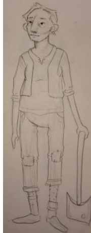
Slika 14: Skica Sina