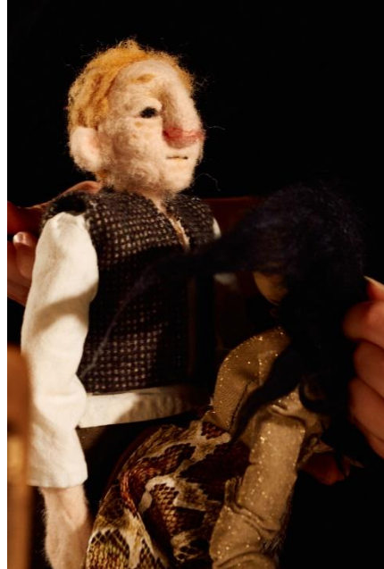
Slika 16: Fotografija Sina iz lutkarske predstave "Šuma Striborova"