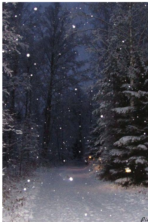
Slika 4: Fotografija, autor: Pia Silvo