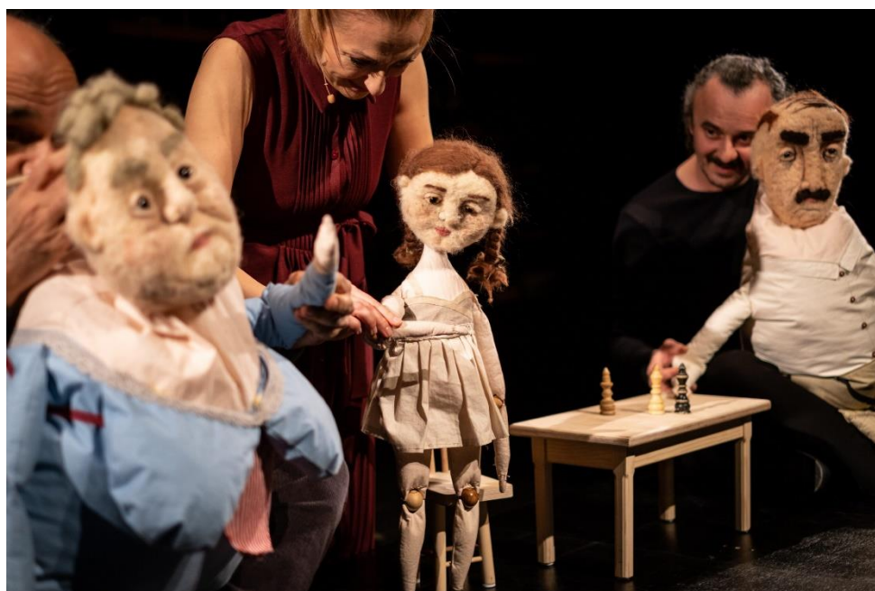
Slika 9: Fotografija lutkarske predstave "Sedam gavranova", Kazalište mladih, Bugojno