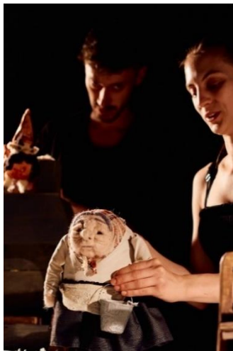
Slika 12: Fotografija Majke iz lutkarske predstave "Šuma Striborova"

Odabir materijala i tehnika zajedno su doprinijeli stvaranju lutke koja je bila ne samo estetski usklađena s ostatkom predstave, već i funkcionalna i lako upravljiva za animatore. Kroz ovaj proces, ostvarena je lutka koja oživljava karakter stare Majke, omogućujući publici da osjeti njezinu prisutnost i važnost unutar priče.