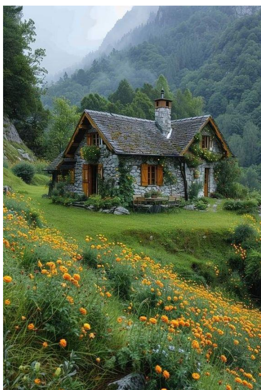
Slika 5: AI generirana slika, autorica: Maria Rojas