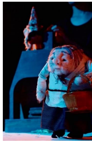
Slika 13: Fotografija Majke iz lutkarske predstave "Šuma Striborova"