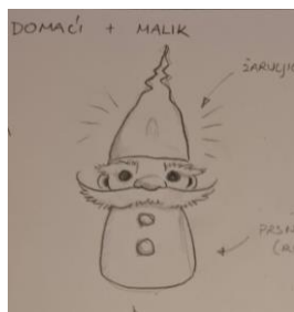
Slika 30: Skica Tintilinića

Svi Tintilinići izgledaju identično, što je namjerno učinjeno kako bi se stvorio dojam da svi potječu iz vatre. Njihov dizajn kao personifikacija iskrica dodatno naglašava njihovu ulogu kao malih, ali moćnih pomagača, koji svojim prisustvom donose toplinu, svjetlost i igru u priču. Njihova uniformnost i sličnost s Malikom služe da bi se vizualno prenijela ideja da su oni produžetak njegove energije i volje, čineći ih ne samo pratećim likovima, već ključnim elementom koji doprinosi čaroliji predstave.