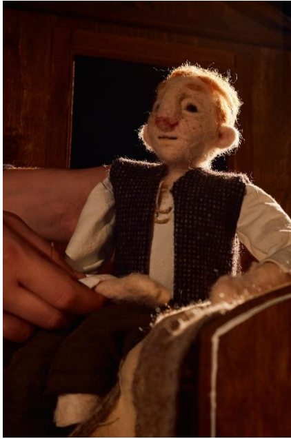
Slika 15: Fotografija Sina iz lutkarske predstave "Šuma Striborova"