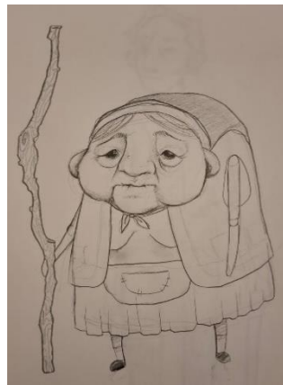
Slika 11: Skica Majke

Sve ove karakteristike spojene su u cjelinu koja prenosi majčinu srž – njezin neuništiv duh, beskrajnu ljubav prema sinu i sposobnost da izdrži čak i najteže životne udarce. Njezina figura, iako mala i pogrbljena, na sceni zrači snagom koja dolazi iznutra, snagom ljubavi i majčinske požrtvornosti. Kroz ovaj dizajn, nastojalo se oživjeti lik stare Majke tako da svaki njezin pokret, svaka crta lica, priča priču o njezinoj neiscrpoj ljubavi i unutarnjoj snazi.