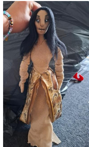
Slika 21: Fotografija Guje