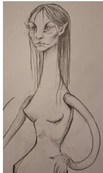
Slika 18: Skica Guje