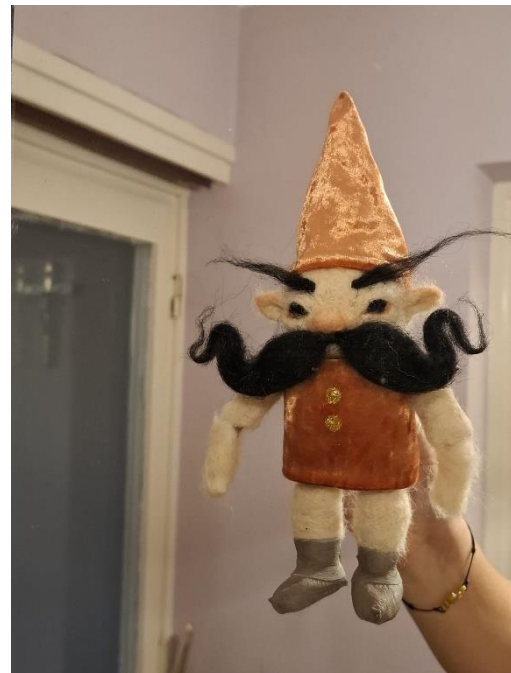
Slika 24: Fotografija Malika na samom završetku izrade