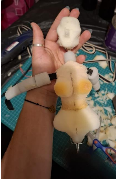
Slika 19: Prikaz procesa izrade Guje

Ova promjena ne samo da naglašava dramski preokret u priči, već i vizualno dočarava metamorfozu koja odražava temeljnu dualnost Guje kao lika. U konačnici, ovaj kostim je sredstvo za izražavanje složenosti Gujinog karaktera, te je ključan element u postizanju željenog estetskog i narativnog učinka u predstavi.