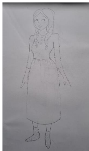
Slika 27: Skica Djevojke

Dizajn djevojke odražava njezinu ključnu ulogu u priči – iako se pojavljuje kratko, ona donosi promjenu koja omogućava sretan završetak. Kroz njezin izgled i način na koji je prikazana, publika treba osjetiti njezinu važnost i simboliku, čineći je neizostavnim dijelom scenske priče.