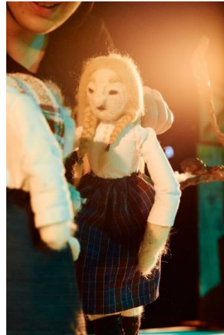
Slika 29: Fotografija Djevojke iz lutkarske predstave "Šuma Striborova"