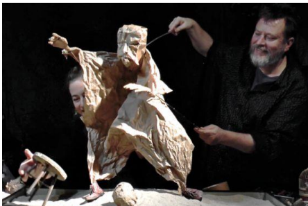
Slika 1: Prikaz stolne lutke izrađene na radionici, mentori: Julian Crouch i Saskia Lane, Courtesy Watermill Center

Također je važno istaknuti da broj animatora može varirati – jednu stolnu lutku može animirati jedan, a ponekad i dva ili tri animatora, ovisno o njenoj veličini, obliku, složenosti pokreta, veličini scenografije te ograničenosti prostora. Animacija lutke može biti ista tijekom cijele predstave, ali se također može prilagođavati prema zahtjevima izvedbe. „U nekom trenutku, na primjer, potrebno je da lutka hoda ili trči, pa joj se animiraju noge; ako stoji i nešto obavlja rukama, animator će ispustiti noge i animirati ruke lutke.“ 6