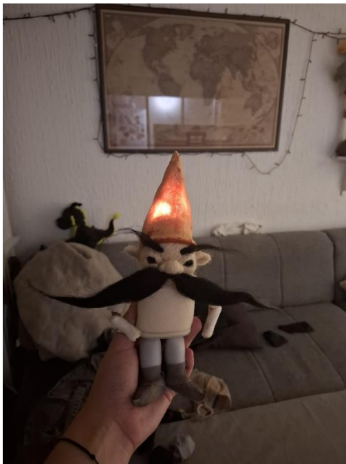
Slika 23: Fotografija Malika sa svjetlećom kapicom

Na kraju, lutka je bila obučena u crveno ruho izrađeno od baršuna koje je odražavalo njegovu živahnu osobnost i ulogu u predstavi kao Malika, razigranog i dobroćudnog vatreneog čovječuljka.