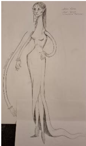
Slika 17: Skica Guje

Sve ove karakteristike zajedno stvaraju lik koji je jednako zavodljiv koliko i zastrašujuć, spajajući suptilnu ženstvenost s hladnokrvnom prijetnjom zmijske. Guja je utjelovljenje mračnih sila, čija vanjska ljepota skriva zlu i opasnu prirodu, a njezin dizajn pažljivo je osmišljen kako bi prenio složenost i dvosmislenost njezine uloge u priči.