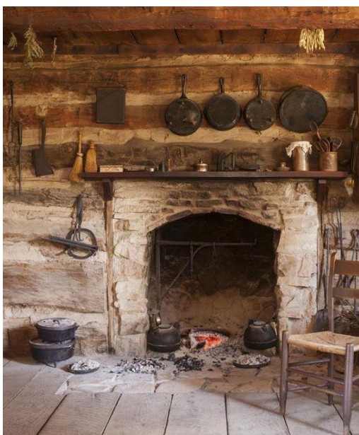
Slika 7: Fotografija peći