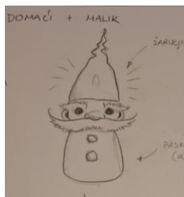
Slika 30: Skica Tintilinića

Svi Tintilinići izgledaju identično, što je namjerno učinjeno kako bi se stvorio dojam da svi potječu iz vatre. Njihov dizajn kao personifikacija iskrica dodatno naglašava njihovu ulogu kao malih, ali moćnih pomagača, koji svojim prisustvom donose toplinu, svjetlost i igru u priču. Njihova uniformnost i sličnost s Malikom služe da bi se vizualno prenijela ideja da su oni produžetak njegove energije i volje, čineći ih ne samo pratećim likovima, već ključnim elementom koji doprinosi čaroliji predstave.