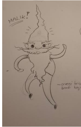
Slika 22: Skica Malika