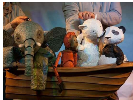
Slika 2: Fotografija iz predstave „The Journey Home“, Little Angel Theatre