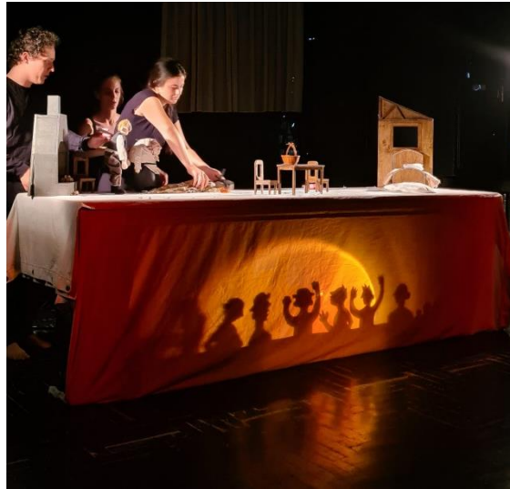
Slika 33: Fotografija Sela iz predstave "Šuma Striborova", kazalište sjena

Ovaj detalj pokazao se kao vrlo upečatljiv dodatak predstavi. Publika je na njega reagirala iznimno pozitivno, a selo izvedeno tehnikom kazališta sjena pridonijelo je stvaranju specifične atmosfere i dodatno obogatilo vizualni dojam predstave.