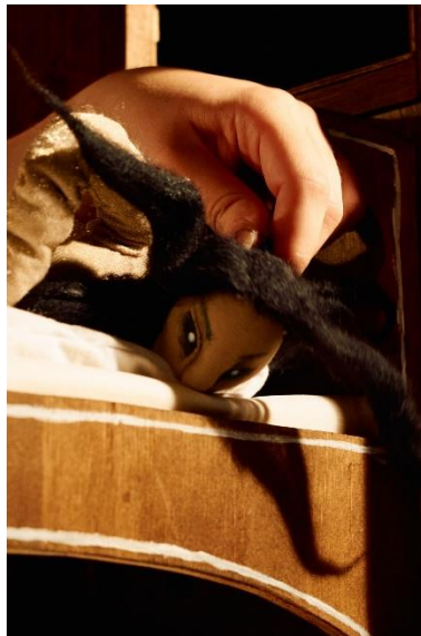
Slika 20: Fotografija Guje iz lutkarske predstave "Šuma Striborova"