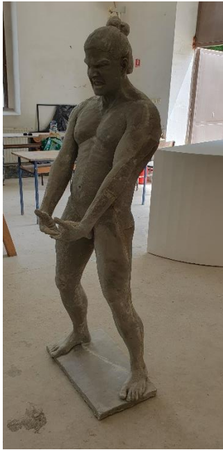
PRILOG 1: Vikispiki , poliester, 180 x 64 x 24