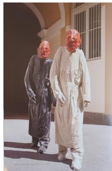
PRILOG 17: Stjepan Gračan, Bez naziva, Grupa I – IV, 2001. PRILOG 18: Stjepan Gračan, Bez naziva XXXV, 1977. – 78.