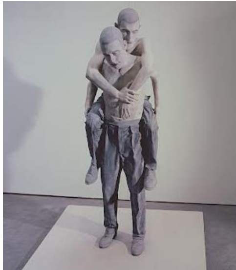
PRILOG 10: John Davies, Two figures (Pick-a-black) , 1977. – 80. kombinirana tehnika

da je figure lijevao iz prirode, radi u četiri petine prirodne veličine, čime je djelo malo udaljeno od promatrača. Panny je izradio nekoliko verzija Jima u raznim materijalima, siva figura od smole oponaša dojam klasične statue, ali površinski detalji mnogo su impresivniji od onih na starom mramoru.“ (Collins, 2014: 22)