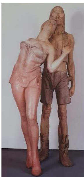
PRILOG 14: Stanko Jančić, Ona i on , 1974. – 75.

Preuzeto iz: Šimat Banov, I. (2013) Hrvatsko kiparstvo od 1950. do danas . Zagreb: Naklada Ljevak, d.o.o.