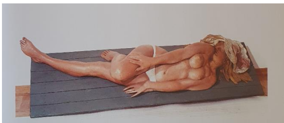
PRILOG 12: Stanko Jančić, Na plaži , 1969. – 70.

Preuzeto iz: Šimat Banov, I. (2013) Hrvatsko kiparstvo od 1950. do danas . Zagreb: Naklada Ljevak, d.o.o.