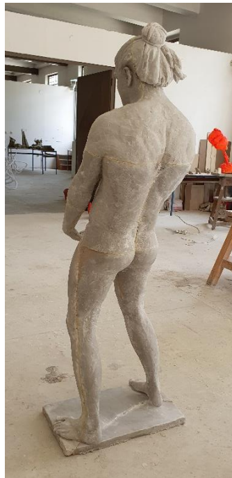
PRILOG 5: Vikispiki , poliester, 180 x 64 x 24