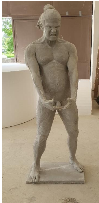
PRILOG 2: Vikispiki , poliester, 180 x 64 x 24