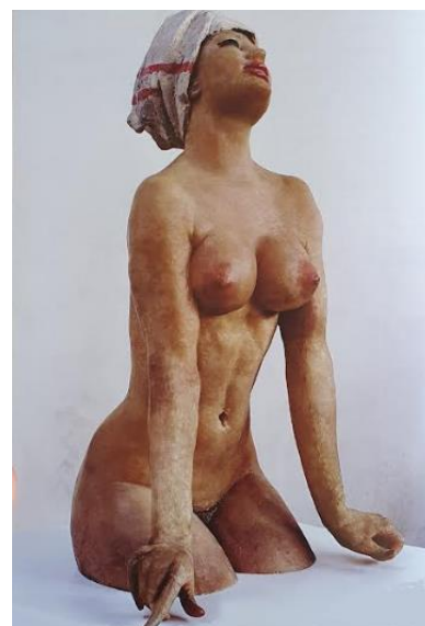
PRILOG 13: Stanko Jančić, U kadi , 1973.