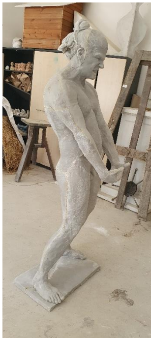
PRILOG 4: Vikispiki , poliester, 180 x 64 x 24