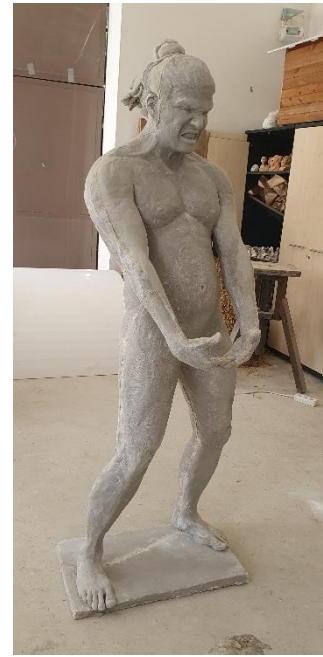
PRILOG 3: Vikispiki , poliester, 180 x 64 x 24