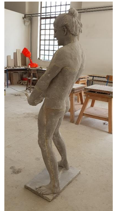
PRILOG 6: Vikispiki , poliester, 180 x 64 x 24