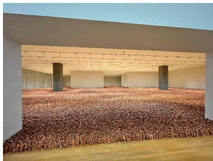
PRILOG 7: Antony Gormley, Aisan Field

Navest ću nekoliko primjera suvremenih umjetnika koji su rabili figuraciju u izražavanju svojih svjetonazora i općenito umjetnika koji su upotrebljavali figuraciju u svojem umjetničkom opusu.