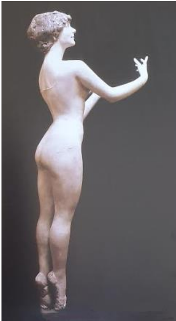
PRILOG 15: Svan Riedl Vujičić, Portet figura Dijane Bogović , 1977.

»angažirane« strategije. Kada je uvidio da se erotizam ne da anestetizirati socijalnim i ideološkim parolama, da erotika nije samo moralni ili socijalni, nego i najintimniji ljudski sadržaj (objekt je postao subjekt), došlo je do kraha njegova socijalnoga koncepta.“ (Šimat Banov, 2013: 311)