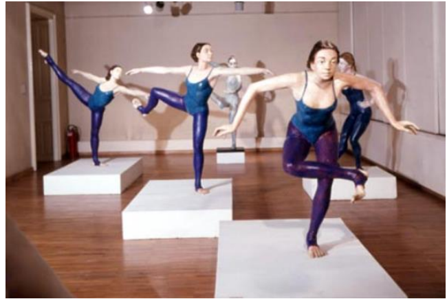
PRILOG 16: Svan Riedl Vujičić, Razvitak pokreta , 1978.

Preuzeto iz: Šimat Banov, I. (2013) Hrvatsko kiparstvo od 1950. do danas . Zagreb: Naklada Ljevak, d.o.o.