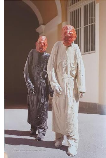
PRILOG 17: Stjepan Gračan, Bez naziva, Grupa I – IV, 2001. PRILOG 18: Stjepan Gračan, Bez naziva XXXV, 1977. – 78.

Preuzeto iz: Šimat Banov, I. (2013) Hrvatsko kiparstvo od 1950. do danas . Zagreb: Naklada Ljevak, d.o.o.