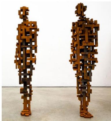
PRILOG 8: Antony Gormley, Cast Beamers , serija skulptura

Tijekom 2000-tih Gormley je propitivao odnos između ljudskog tijela i arhitekture, posebno u svojoj seriji radova od čelika i željeza Blockworks i Beamers . U tim radovima je Gormley zamijenio anatomiju arhitektonskim blokovima koji podsjećaju na izgrađeni okoliš.