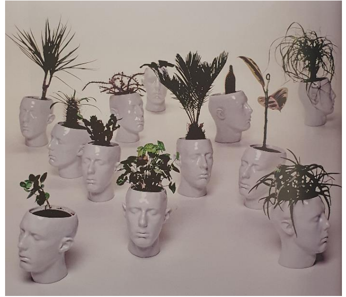
PRILOG 20: Ivan Fijolić, 12 autoportreta , 2002.

Preuzeto iz: Šimat Banov, I. (2013) Hrvatsko kiparstvo od 1950. do danas . Zagreb: Naklada Ljevak, d.o.o.