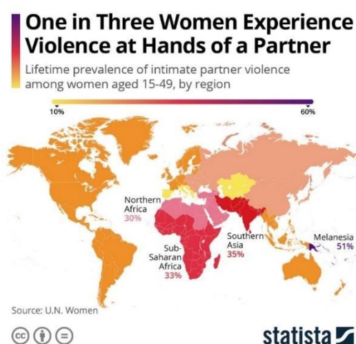
Slika 1. Statistički prikaz problematike nasilja nad ženama od strane partnera na globalnoj razini

Svjetska zdravstvena organizacija (2024.) također navodi kako je većina tog oblika nasilja nasilje od strane intimnog partnera. „Diljem svijeta, gotovo jedna trećina (27%) žena u dobi od 15 do 49 godina koje su bile u vezi izjavljuje da su bile izložene nekom obliku fizičkog i/ili seksualnog nasilja od strane svog intimnog partnera. Također, naglašavaju kako nasilje može negativno utjecati na tjelesno, mentalno, seksualno i reproduktivno zdravlje žena te može povećati rizik od dobivanja HIV-a.“ (Svjetska zdravstvena organizacija, 2024.).