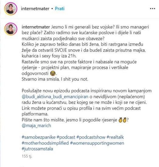
Slika 8 Objava na profilu @internetmater