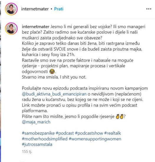
Slika 8 Objava na profilu @internetmater